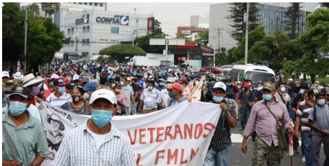
Este año la Secretaría Nacional de Veteranos se propuso como meta la participación de 300 veteranos en la marcha del Día de la Clase Trabajadora.

Después de 14 años de existencia desapareció y pasó a ser parte del Instituto Administrador de los Beneficios de los Veteranos (INABVE), pero ahora también está bajo amenaza y como resultado todos los beneficios y proyectos, pues todos aquellos espacios y resultados de los Acuerdos de Paz y tienden a desaparecer, denunció Arévalo, al tiempo que los convirtió en bandera de lucha para el próximo uno de mayo.