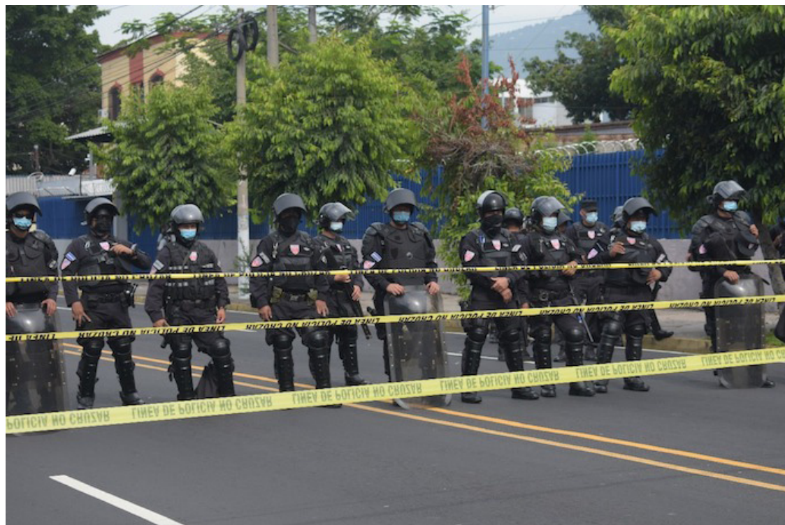
El Régimen de Excepción se ha prorrogado en 22 ocasiones, y ha dejado 75, 163 personas detenidas, muchas de forma arbitraria. Organizaciones de la sociedad civil contabilizan 5,775 afectadas en sus derechos humanos por las detenciones, más de 150 muertes bajo custodia estatal y con signos de tortura, afirma el SSPAS.

“Hemos hecho este ejercicio de monitorear y evaluar como ha ido la implementación de la Política de Derechos Humanos de la Policía Nacional Civil, porque creemos fundamental recuperar el énfasis en la contraloría social”, dijo el director del Servicio Social Pasionista, el padre Carlos San Martín.