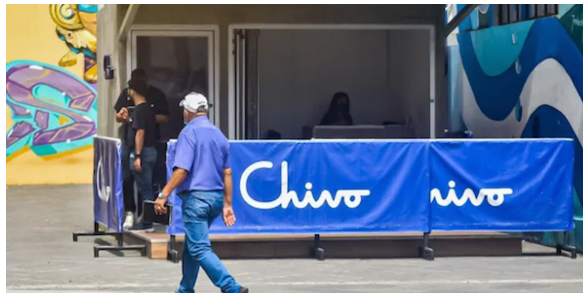
Los cajeros bitcoin ya no son utilizados por la población; solamente fueron utilizados al inicio para sacar los $30 que dio el Gobierno.