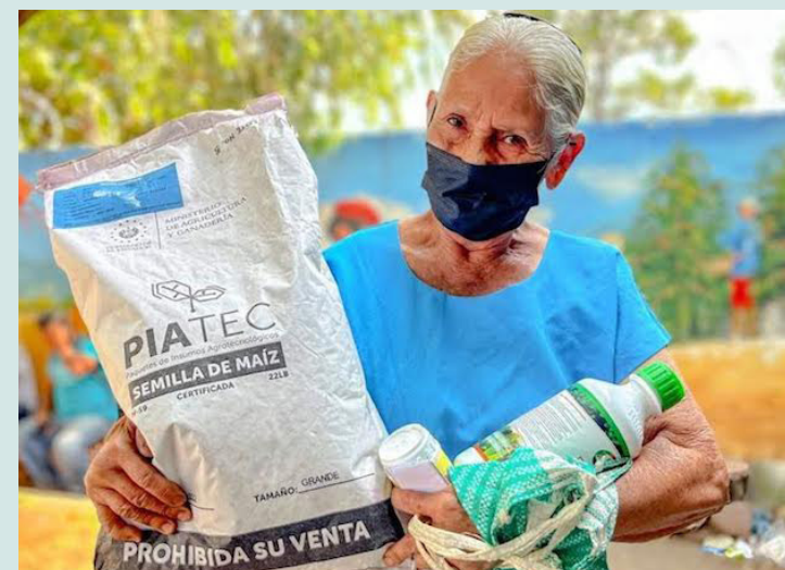
El traspaso de $40,000,000 dólares del Presupuesto de Hacienda al Presupuesto de Agricultura y Ganadería representa un aumento del 43.8% para este último, con respecto a su Presupuesto Programado.

Por otro lado, el Presupuesto de Hacienda, que contaba con un Programado Modificado de $3,233,898,873.65 dólares antes de la reforma, experimenta una disminución del 1.24% al transferir los $40,000,000 al Ramo de Agricultura y Ganadería.