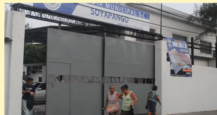
De 262 alcaldías pasarán a ser 44; los ahora municipios pasarán a ser distritos debido a la Ley de Reestructuración Municipal.

También, la ley permite que se reorienten los fondos provenientes de préstamos; el decreto, menciona que el concejo municipal podrá solicitar la modificación del destino de los fondos ya