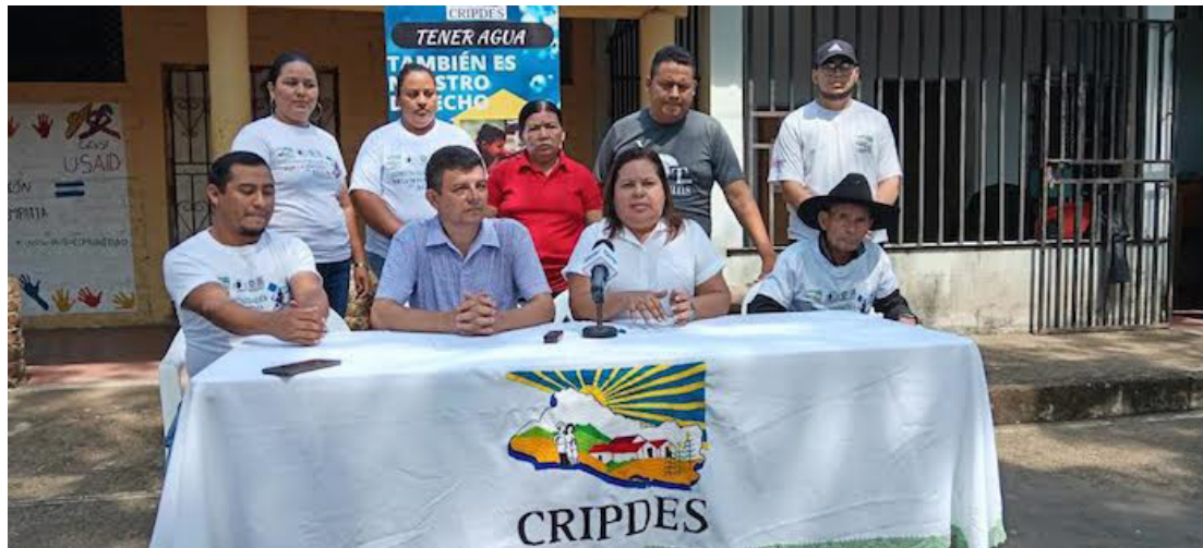
En el marco del Día Mundial de la Tierra, CRIPDES, junto a PROGRESO, acompañan 13 asociaciones rurales de agua en su denuncia ante la escasez de agua, provocada a la tala sin control de los árboles y la quema indiscriminada del cultivo de la caña de azúcar en el caserío Milingo en Suchitoto, Cuscatlán.

“Han venido a veces, se han identificado, y en otras