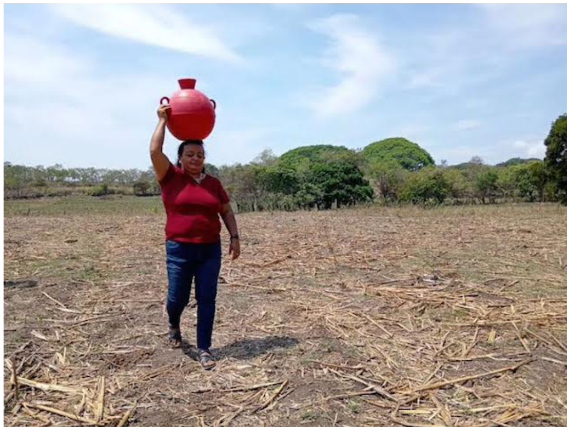
Las mujeres son en su mayoría quienes se ven impactadas por la escasez de agua, porque son ellas culturalmente y por los patrones machistas las encargadas al acarreo del agua para abastecer a sus familias.