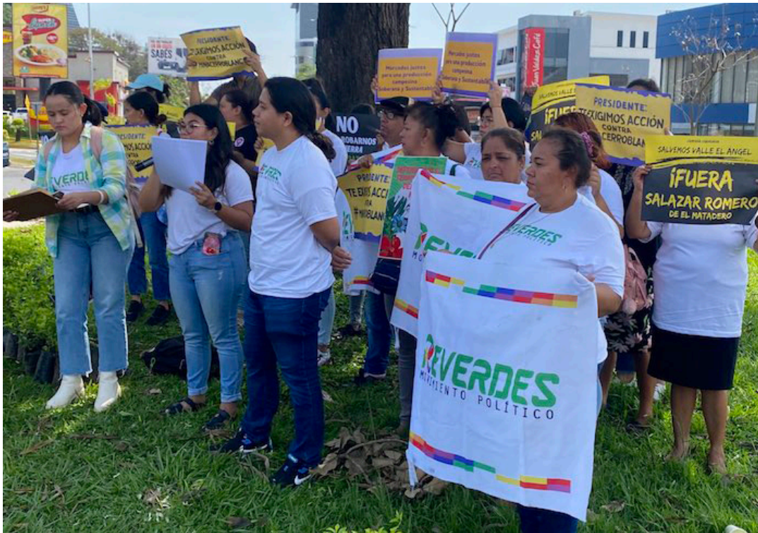
REVERDES PROPONE INCORPORAR LOS DERECHOS DE LA NATURALEZA EN LA CONSTITUCIÓN DE LA REPÚBLICA, PARA UN CAMBIO DE PARADIGMA QUE PONGA AL CENTRO LA VIDA.