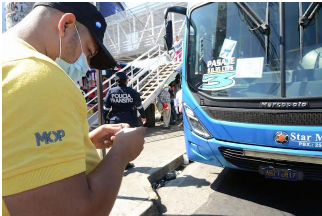
La Ley de Derechos Fiscales por la Circulación de Vehículos se ha mantenido en vigencia desde el año 1993.

El Artículo 5 define la matrícula como “el asiento numerado que se hace en los registros del Departamento General de Tránsito, del nombre, dirección y número de Identificación Tributaria de la persona propietaria o poseedora legítima de un vehículo cuyas características son incorporadas a dichos registros.