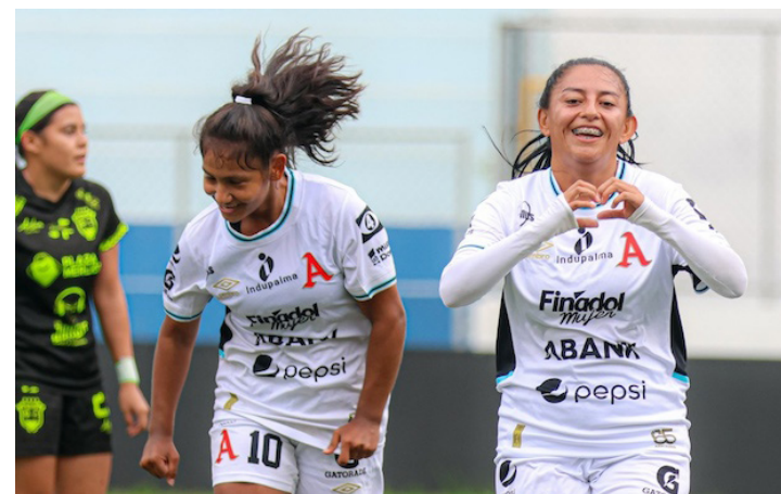
La Liga Femenina se dirige directo a los cuartos de final.

Y, finalmente, Dragón tendrá la prueba más importante ante el cuadro aliancista, primero del grupo B, contra el último del grupo A.