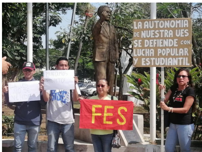
Representantes de colectivos y movimientos universitarios piden al Ministerio de Hacienda, pagar los fondos adeudados a la UES, que ascienden a $52 millones.

Expresó que debido al impago se han tomado medidas de austeridad las cuales comprometen aspectos como la investigación, contratación de docentes y adquisición de servicios; también afecta los programas de beneficio directo, para estudiantes becarios y auxiliares de cátedra.