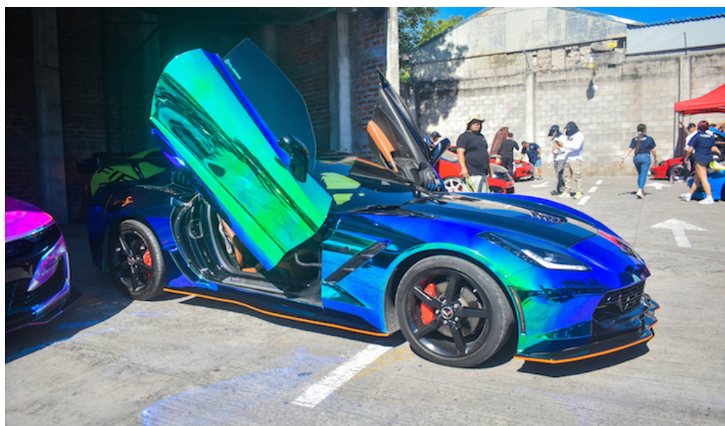
Camaro corvette B8, modificado con motor 6.2 del guatemalteco Henry Hall, quien participó con tres de estos en la XXXIV edición del Super Auto Show (SAS) de El Salvador.