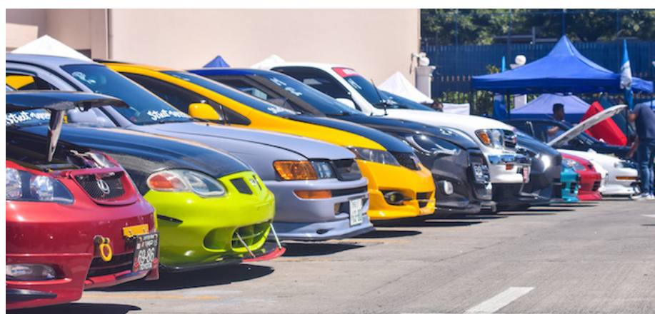
Aproximadamente 450 autos modificados y extravagantes participan en el trigésimo cuarto aniversario del Super Auto Show (SAS) en el centro de San Salvador.