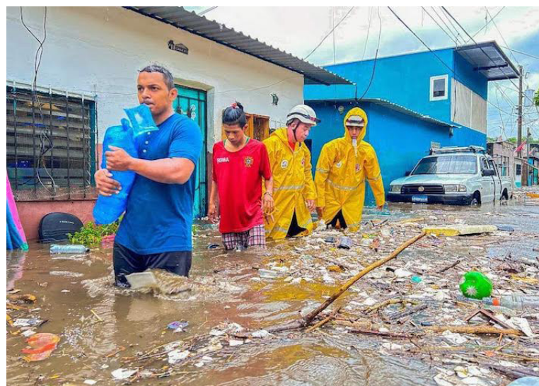
Los Estados saben que hay crisis ambiental, que exige justicia climática, y también que no para la degradación ambiental, empeorando la situación que afecta cada vez más a las poblaciones, las inundaciones, son un ejemplo.

- ¿Cuál es la situación de las personas defensoras de