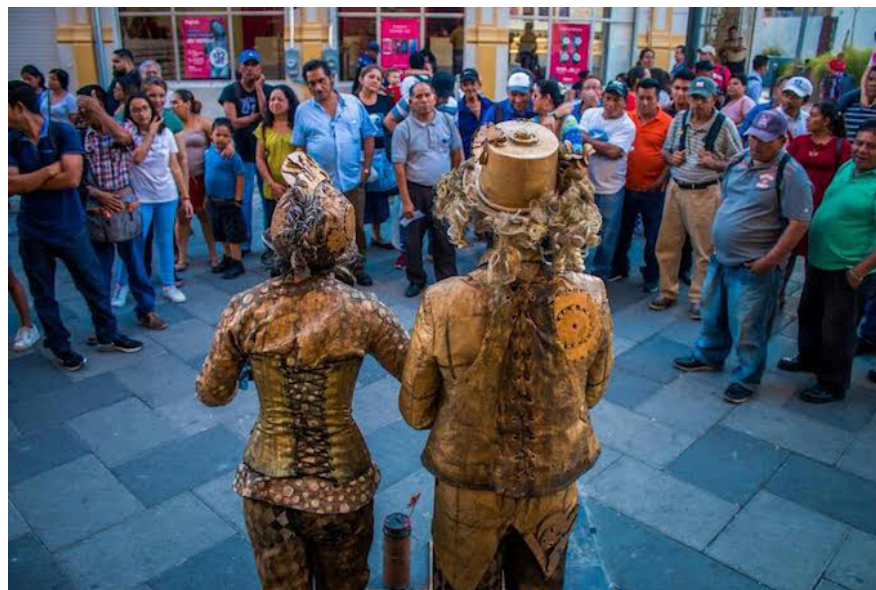
Estatuistas del Centro Histórico de San Salvador adornan las calles en representación de la cultura salvadoreña.

Mendoza dijo que el problema radica en la documentación que la alcaldía ha solicitado a los artistas y que cierta parte de los artistas no la ha entregado; sin embargo, otro bloque de estatuistas han alegado que en la documentación la administración actual pide que firmen, existen ciertos criterios que quedan sujetos a mala interpretación y se podrían prestar para arbitrarie-