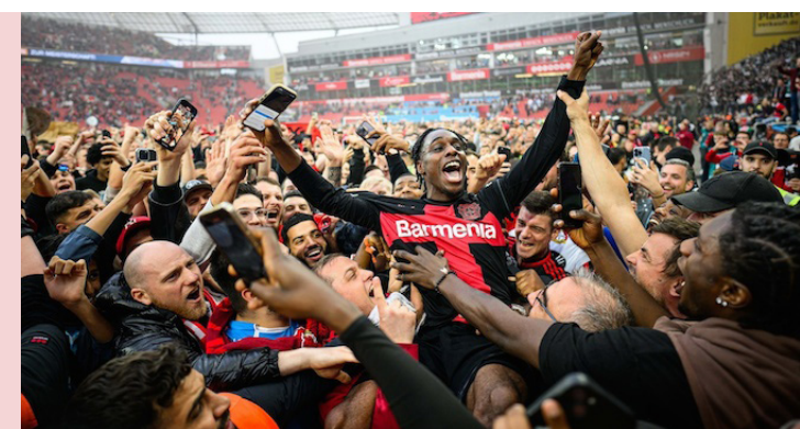
El Bayer Leverkusen celebra con la afición el primer título de la Bundesliga en 119 años de fundación del equipo alemán.