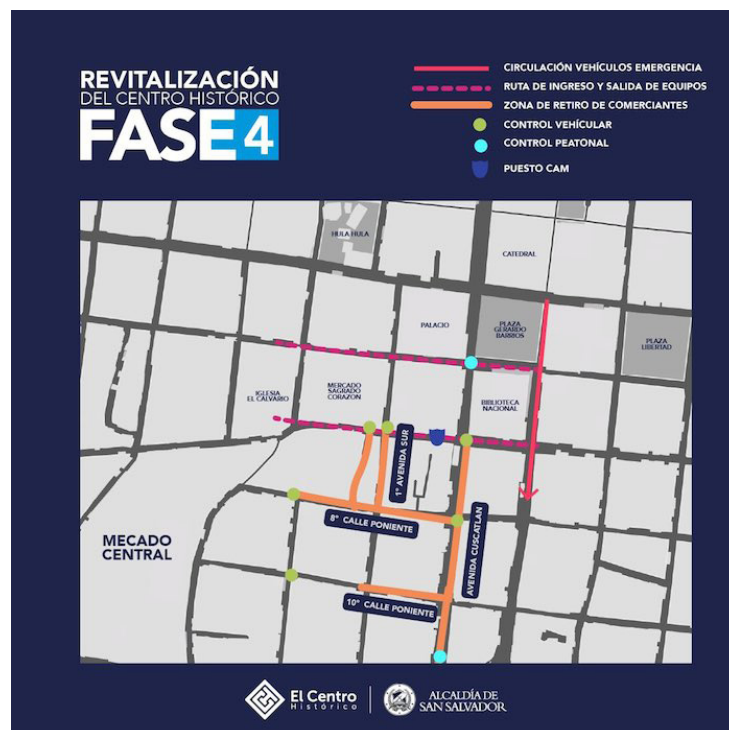
El desalojo de vendedores ambulantes se da en el circuito de calles que, se extiende en 16 cuadras, entre la 8a Calle Poniente a la 1a. Avenida Sur, junto a la Avenida Cuscatlán y la 10a. Calle Poniente de la ciudad capital.