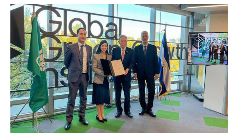
Asamblea Legislativa ratifica “Acuerdo entre la República de El Salvador y el Instituto Global para el Crecimiento Verde sobre el Estatus Legal y Privilegios e Inmunicaciones del Instituto Global para el Crecimiento Verde.

El documento establece que el acuerdo ente la entidad Estatal y la Internacional “concreta-