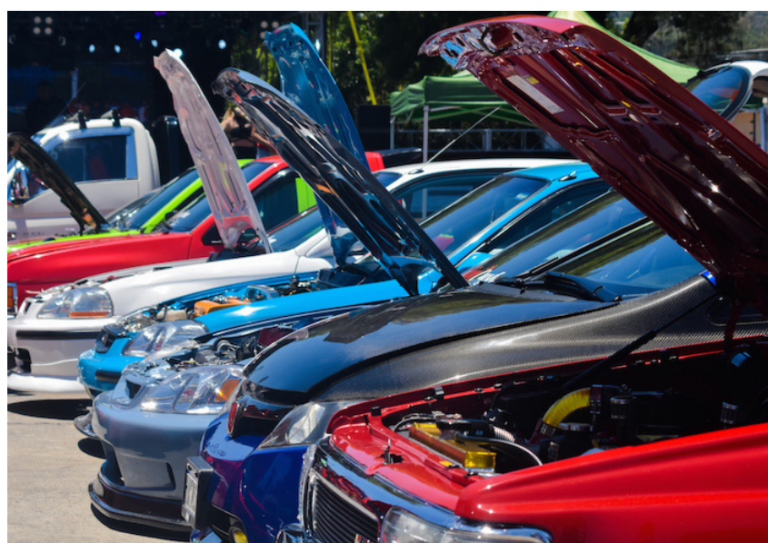
Los vehículos modificados de la fabricante de automóviles, Honda, destacaron en el desfile del Súper Auto Show (SAS) 2024.