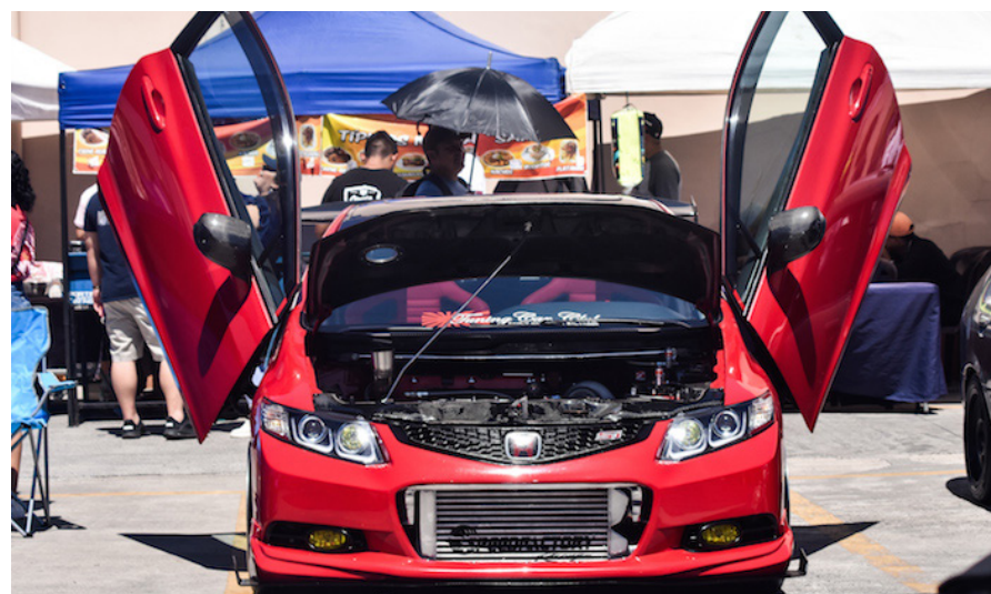
De Cuscatlán el Honda Civic Si 2012, con culata del K20A2 y turbo añadido, del salvadoreño Luis Torres, se roba las miradas en el Super Auto Show (SAS) 2024.