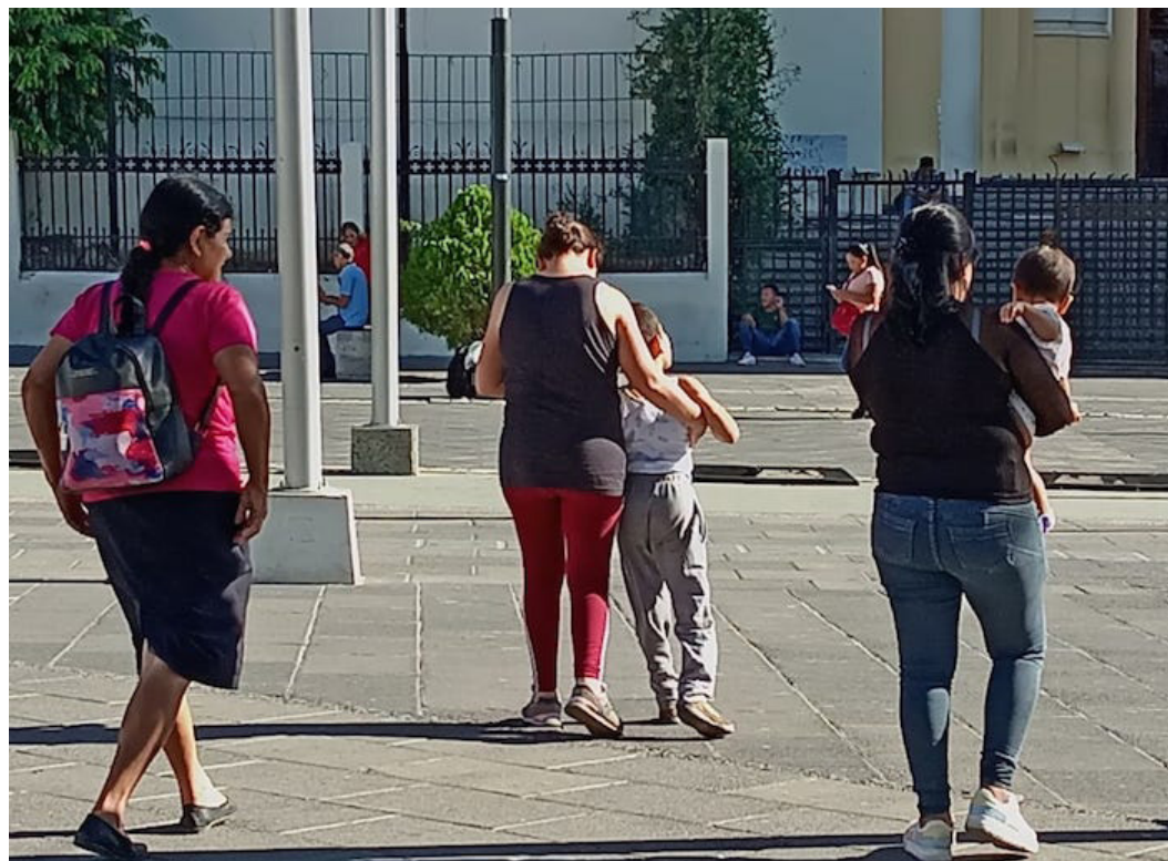
Históricamente por la cultura y el marco simbólico heredado las encargadas de los cuidados de la familia o cuidar de personas en estado de vulnerabilidad, es responsabilidades que en su mayoría recae en las mujeres.

“El tercer desafío es el financiamiento que debe ser suficiente, para la ejecución de esta normativa. En El Salvador se ha dado ese gran paso con la Política Nacional de Cuidados, entonces, esperaríamos ciertas actividades, acciones y estrategias para que se ponga en marcha y funcione por el bienestar de salvadoreños y salvadoreñas”, puntualizó Martínez.