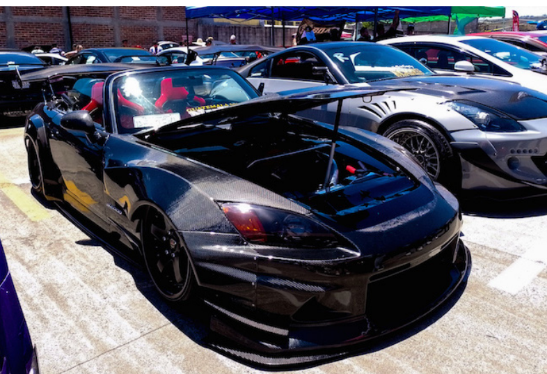
El 2002 Honda S2000, con tuberías de aire, timón de carbono, butacas braum del guatemalteco Cristian Sosa, desfila en el Super Auto Show (SAS) 2024.