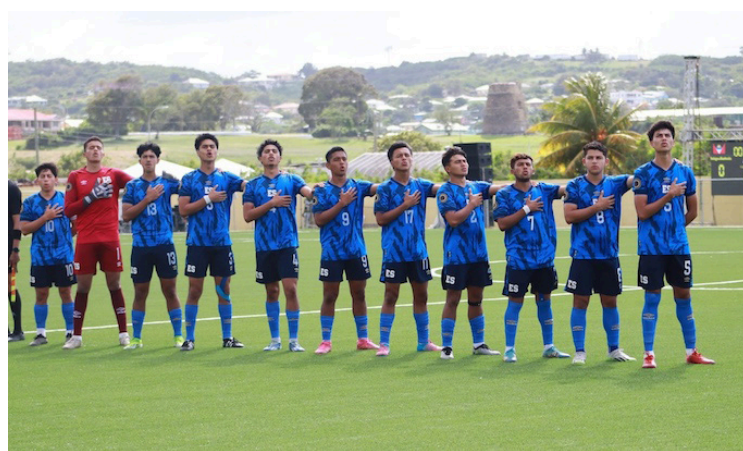
La selección Sub-20 se prepara para el Premundial de la CONCACAF.