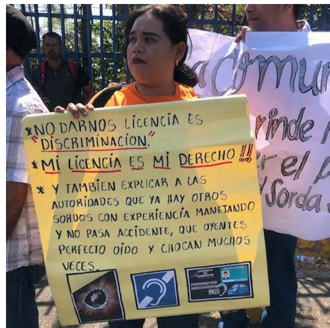
Las personas llegan a la Asamblea con pancartas donde exponen que tener una licencia de conducir es un derecho y no darla es “discriminación”.

Según datos del Consejo Nacional de Atención Integral a la Persona con Discapacidad (CONAIPD), y la Asociación Salvadoreña de Sordos, (ASS), en El Salvador existen más 28,526 personas que tienen alguna discapacidad auditiva, más de 6,000 personas sordas, y aproximadamente 22,500 personas que tienen pérdida de audición o disminución de la capacidad auditiva.