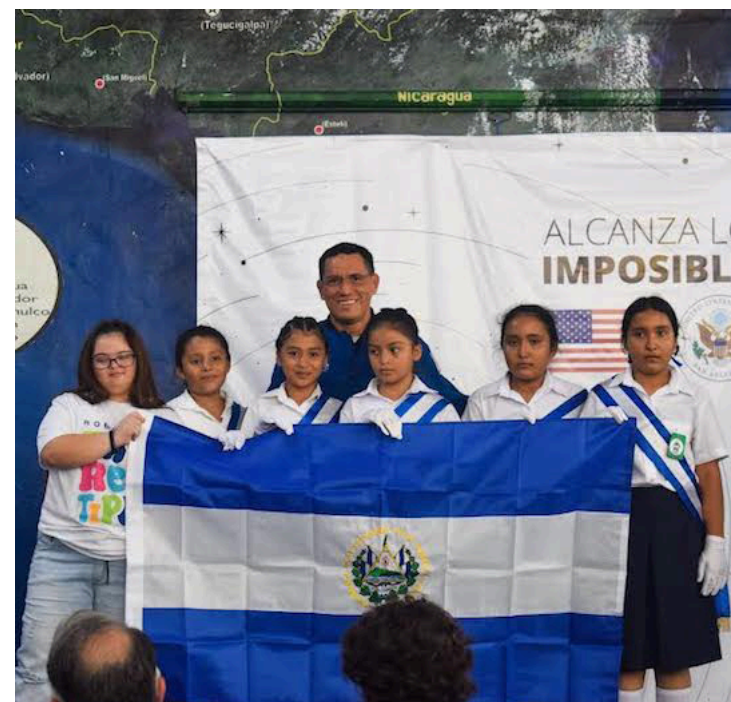
Frank Rubio entrega al Museo Tin Marín la bandera de El Salvador, la cual lo acompañó durante su misión espacial. FOTO: DIARIO CO LATINO / GABRIELA SANDOVAL.

FOTO: DIARIO CO LATINO / GABRIELA SANDOVAL.