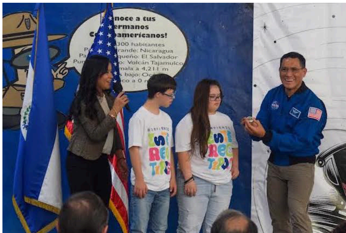
Frank Rubio anima a los niños a enfocarse en áreas como la ciencia, arte, matemáticas y tecnología. La visita, respaldada por la NASA y la Embajada de Estados Unidos, busca inspirar y acercar a los jóvenes al mundo de la ciencia y el espacio.

viernes, los jóvenes estudiantes, destacados por su excelente desempeño académico de la Fundación Paraíso Down, alumnos del Centro Escolar Pedro Pablo Castillo y estudiantes de otras instituciones educativas, tuvieron la oportunidad de hacer preguntas y expresar sus curiosidades a Ru-