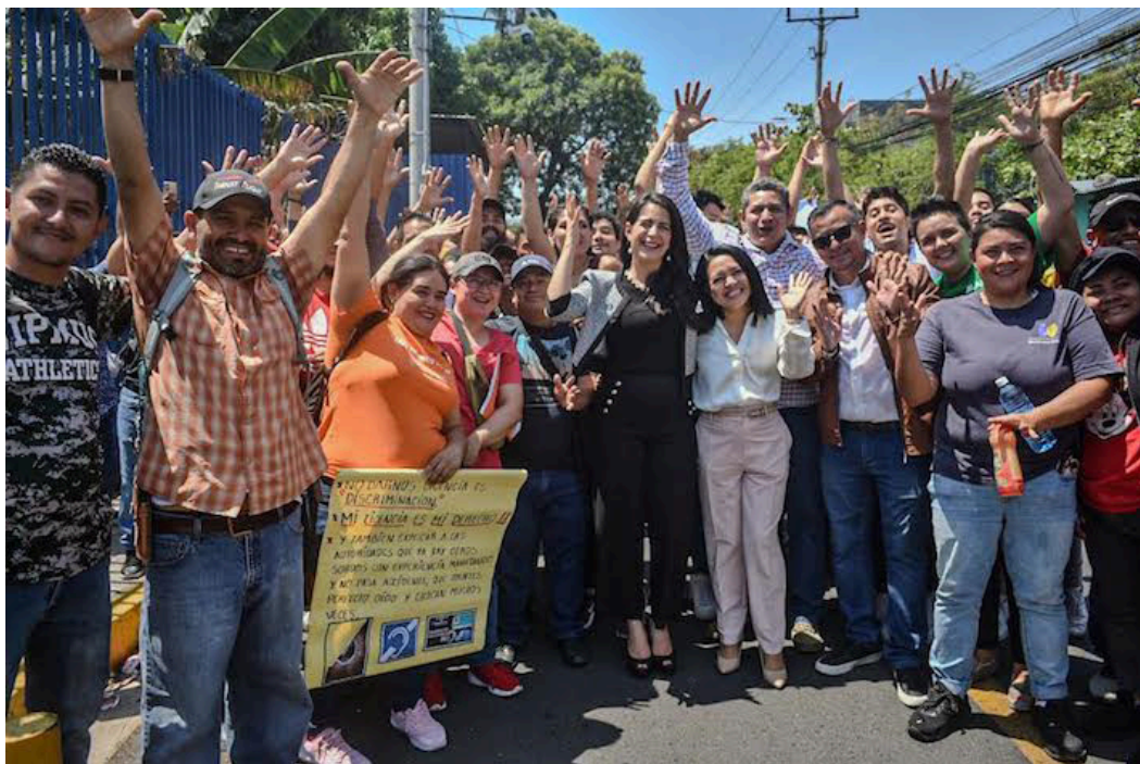
Un bloque de personas con discapacidades auditivas se reúnen frente a la Asamblea Legislativa para pedir que se regule y habilite los trámites para la licencia de conducir en este sector.