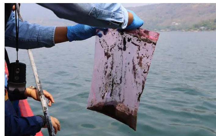
El LABTOX-UES recolectó la tercera muestras de agua y sedimentos en el Lago de Coatepeque, para continuar con el monitoreo de cianobacterias.

Salinas agregó que las cianobacterias a diferencia de otras bacterias, pueden hacer fotosíntesis y afectar a la fauna por el hecho de que cuando se reproducen en esta forma masiva como ocurre en el Lago de Coatepeque, impiden la penetración de la luz y hay menos oxígeno en el agua. Las cianobacterias que mueren van al fondo del agua, donde los organismos que descomponen utilizan más oxígeno. Los resultados de este tercer estudio se presentarán en los próximos días. Desde el 8 de abril, el Ministerio de Medio Ambiente y Recursos Naturales (MARN) anunció estado de emergencia ambiental por año en el Lago de Coatepeque, ante la proliferación de cianobacterias del género Limnorphis detectada durante los meses de marzo y abril, debido al aumento de