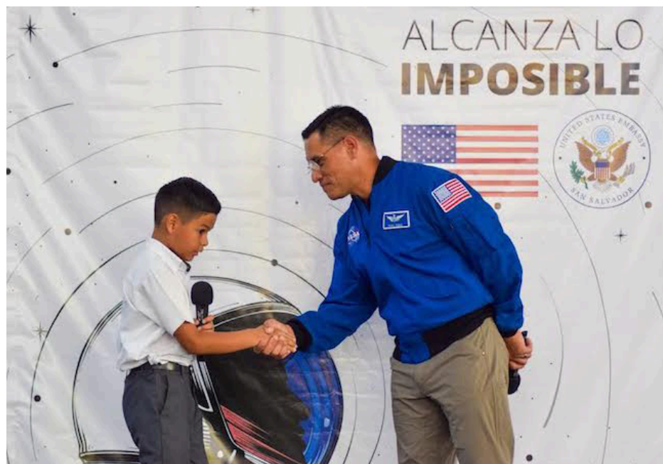
Francisco Rubio, astronauta de origen salvadoreño, comparte con niños y niñas en el museo Tín Marín de San Salvador su experiencia en el espacio.

La jornada concluyó con la entrega de una artesanía local a Rubio, un recuerdo de su visita al museo y un testimonio de la calidez y gratitud de los niños y niñas con los que compartió su experiencia.