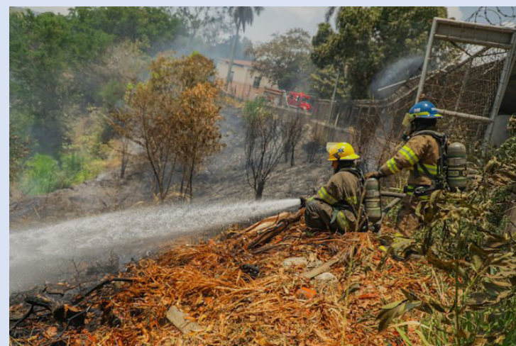
Un incendio en terreno con maleza seca y hojarasca ocurrió contiguo al Centro de Atención a Ancianos Sara Zaldívar, colonia Costa Rica, San Salvador, no se reportan lesionados.

Asimismo, en el kilómetro 138 de la Ruta Militar, cerca del cantón La Trinidad, un motociclista fue lesionado en un accidente de tránsito, el conductor de un camión, no respetó la distancia; mientras que, sobre el bulevar del Ejército un vehículo