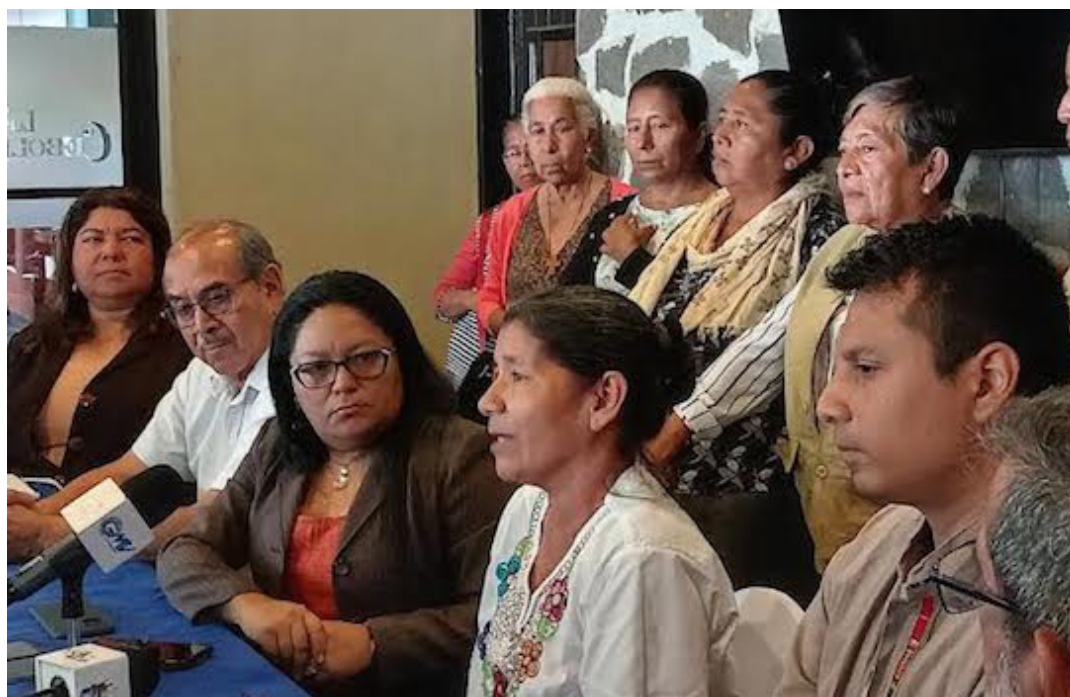
Representantes de diversas organizaciones, redes, comités, foros, mesas y alianzas, exigen a la Fiscalía General de la República y al Sistema Judicial, el cese a la “persecución penal” contra los cinco ambientalistas de San Isidro Cabañas.

“Entonces, sería bien visto si la Fiscalía General de la República y el Sistema Judicial atienden el llamado de hacer valer la legalidad y la justicia en este caso, porque el ente fiscal en el proceso de instrucción no encontró ningún ele-