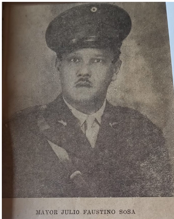
MAYOR JULIO FAUSTINO SOSA

Las jornadas de abril y mayo de 1944, esos destellos de libertad y democracia, quedaron como gestas heroicas y de sacrificios para recordarlas y mantenerlas como fuente de lecciones sobre las posibilidades y límites de las luchas políticas populares y de las dictaduras que se creen perpetuas.