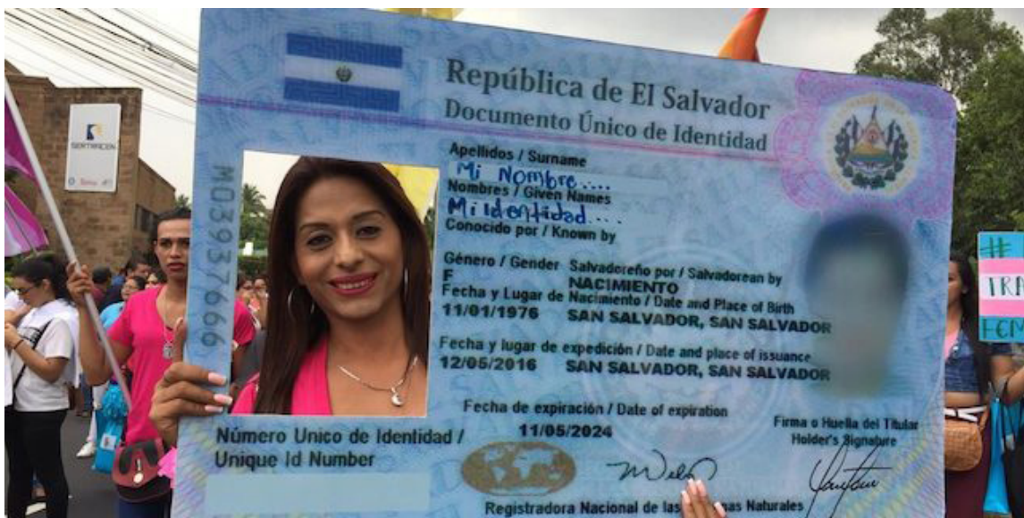
La CSJ consideró que la ley vigente establece un "trato discriminatorio no justificado" contra la comunidad LGTBI, por lo que ordenó a la Asamblea Legislativa reformar la Ley del Nombre y Persona Natural (LNPN).