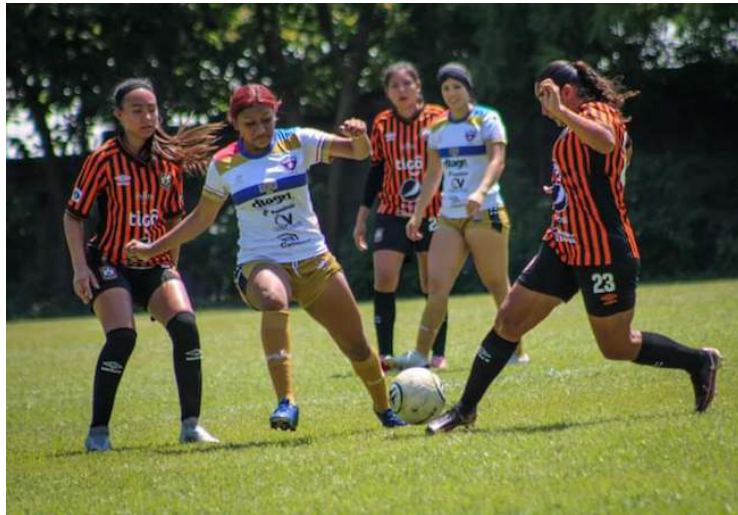
Águila vence 4-2 a Firpo en San Miguel, y se mete a los cuartos de final del Clausura 2024.

Con 18 unidades en la tabla de clasificación, Jocoro, uno de los equipos más destacados del grupo, selló su clasificación a la siguiente fase tras el 7-0 que le impuso a Fuerte San Francisco, en el polideportivo Tierra de Fuego. El equipo se encuentra invicto.