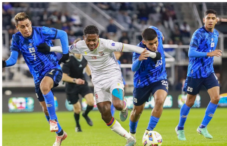
La Selecta empató 1-1 con Bonaire en encuentro amistoso de Marzo 2024.

“Durante los primeros meses de vigencia del contrato, la relación contractual se desempeñó acorde a lo planeado; sin embargo, en los últimos meses FESFUT ha incumplido con el derecho de prioridad otorgado. Primeramente, la FESFUT otorgó derechos para organizar partidos a la Liga Mayor de Fútbol de El Salvador, compli-