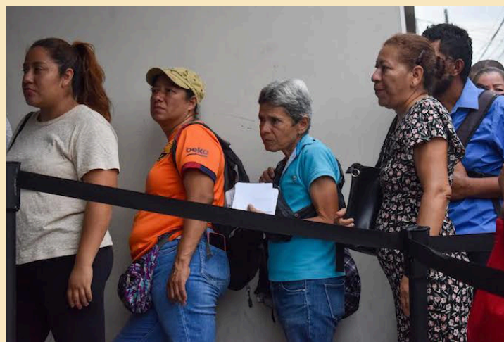
Decenas de personas hacen filas para poder solicitar información de su pago por los servicios prestados en las dos jornadas electorales pasadas.

Por su parte, el ministro de Trabajo, Rolando Castro, reaccionó ante la situación del TSE; a tra-