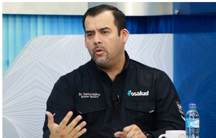
Carlos Núñez, titular del FOSALUD, asegura que las empleadas embarazadas no fueron despedidas, sino contratadas para interinato y este no fue renovado.

“Si durante un interinato una persona sale embarazada, no se le puede dar otro interinato porque es un gasto para el Estado, lo que siempre ha pasado es que al terminar su maternidad se le puede volver a dar un interinato”, aseguró Carlos Núñez, titular del Fondo Solidario para la Salud (FOSALUD), con respecto a las empleadas embarazadas que fueron despedidas.