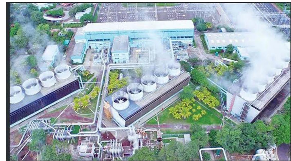
Los resultados en los ingresos de energéticos se deducen con la estabilización de precios en productos tales como el Gas Licuado del Petróleo y de la Gasolina.

El 10.38% en el incremento de las exportaciones de energéticos; y la reducción del 93.8% en la importación de los mismos deduce una menor dependencia del mercado externo, y un mayor consumo de los bienes de consumo local; así como una mayor producción en la matriz energética y vapor nacional. De modo que, su participación en el Producto Interno Bruto (PIB) sería del 3.2%; casi