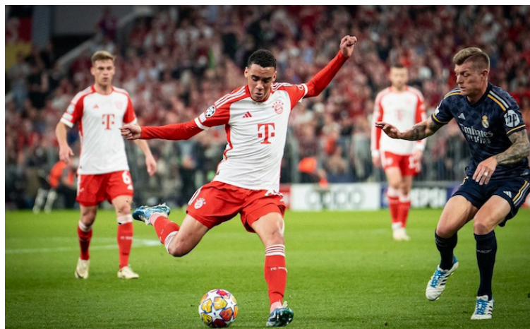
El Bayern de Munich y el Real Madrid empatan 2-2 en el Allianz Arena en el partido de ida de las semifinales de Champions League.

Se habían jugado los primeros 15 minutos en Alemania, donde el cuadro teutón dominó el esférico y generó incontables llegadas al área chica de la meta defendida por Lunin. Lo intentaron tanto dentro del área como fuera con la aparición de Musiala, Kane y Sané. Sin