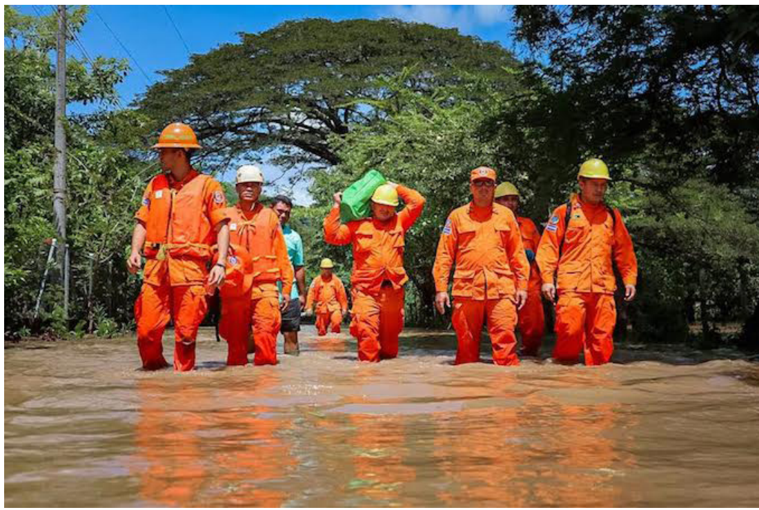
La Asamblea Legislativa aprobó con 67 votos a favor las reformas a la Ley de Protección Civil, Prevención y Mitigación de Desastres, contenidas en el Dictamen No. 62 emitido por la Comisión de Legislación y Puntos Constitucionales.

El artículo 34-F establece que los grupos USAR Nacionales debidamente acreditados “se encuentran obligados a dar cumplimiento a los manuales, guías, protocolos, procedimientos, directrices de planificación, instrucciones y demás disposiciones operativas emitidas por las autoridades del Sistema Nacional de Protección Civil, Prevención y Mitigación de Desastres que se encuentre a cargo de la conducción de las operaciones USAR en cada evento”.