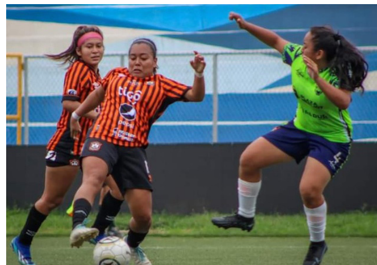
Águila vence 0-1 a Santa Tecla en los cuartos de final de la Liga Femenina del Clausura 2024.

El sábado 4 de mayo, Isidro Metapán se enfrentará a Municipal Limeño en el estadio Jorge