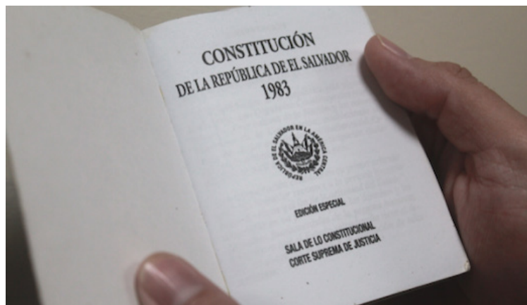
Las organizaciones sociales indican que la Asamblea Legislativa incumple el proceso de reforma constitucional, y vulnera el diálogo ciudadano.

Asimismo, enfatizaron que durante la fase informativa se debe garantizar un intervalo de tiempo adecuado, para que la ciudadanía se informe de las alternativas en juego y comprenda la exacta dimensión de la reforma constitucional sometida a su consideración. “El fundamento de ello, es asegurar que la sociedad salvadoreña se exprese limpia y transparentemente en relación con la conformación de la Asamblea Legislativa que deberá decidir si ratifica o no el acuerdo de reforma, es necesario que medie una elección legislativa para que la ciudadanía se pronuncie a favor o en contra de la reforma, de acuerdo con las propuestas políticas de los candidatos a diputados”, señalaron. A la vez, cuestionaron para quiénes se está re-