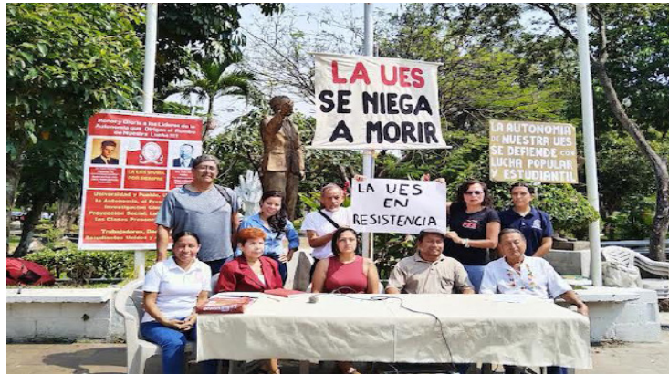
La comunidad universitaria denuncia la deuda presupuestaria que sobrepasa los $50 millones, así como en la retención de aulas y laboratorios por parte del MOPT.