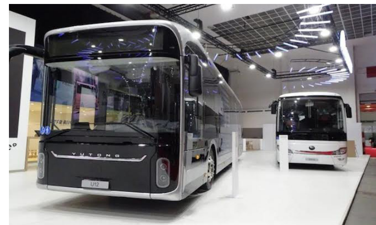
La inversión de los $179.5 millones en transporte se adhiere a los gastos presupuestarios de la cartera de Obras Públicas, que deberá documentarse en el presupuesto devengado del Portal de Transparencia Fiscal.

El plazo de amortización será de 96 meses, con pagos trimestrales tras 6 meses de recibidos después de la fecha del Acta de Recepción de Bienes. La tasa de interés fija y anual es del 6.5%, pagaderos trimestralmente, “comenzando a devengarse una vez finalizada la aplicación de los recursos del fi-