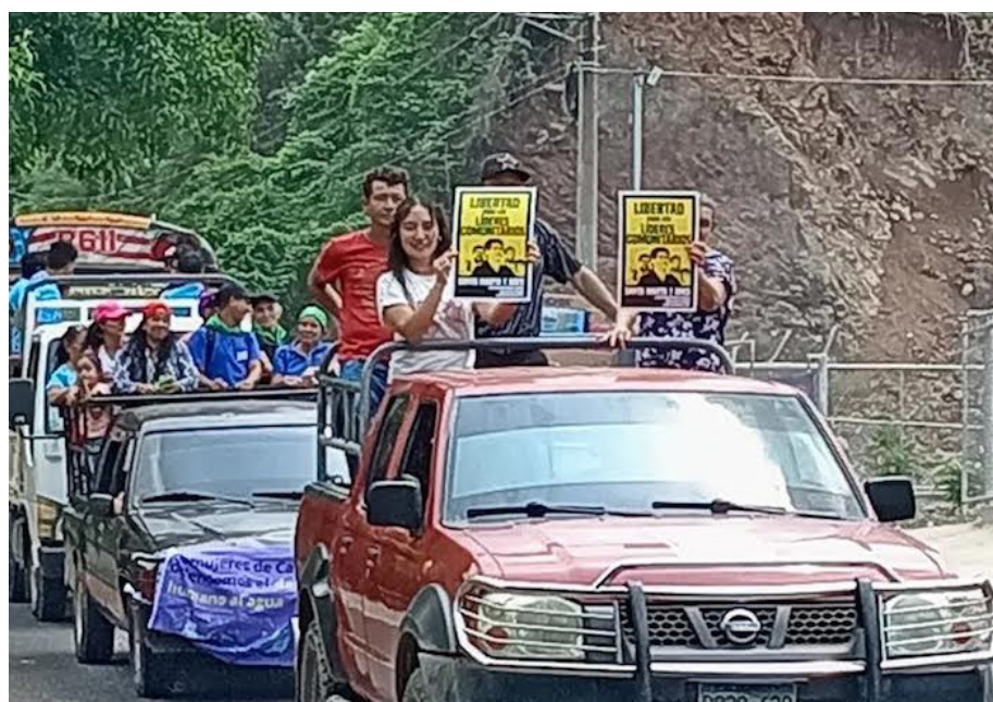
El mensaje de las organizaciones es clara en “mantener la prohibición de la minería metálica”, por su inviabilidad en un país cuyo territorio es pequeño y la densidad poblacional es alta, lo que provocaría un desastre ambiental.