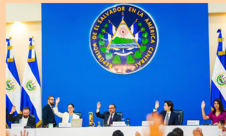
Comisión Ad Hoc estudiaría reformas constitucionales en esta legislatura.

ticos habían secuestrado al país ya se acabó. Se le ha regresado el poder al pueblo, ellos son los que mandatan ahora. Si hacemos cambios, conformaremos una comisión ad hoc, donde recibiremos a expertos, académicos y jurídicos, sesionando de manera pública y transparente”,