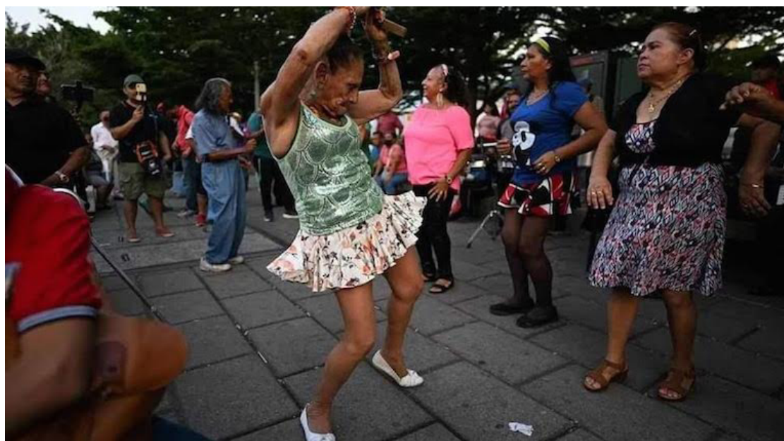
El Parque Libertad pertenece al Centro Histórico de San Salvador, un lugar público con historia social y política del país.