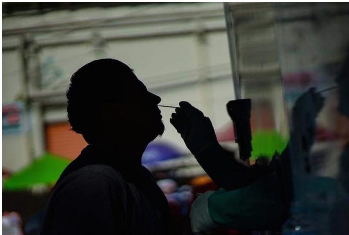
Los $12.1 millones aprobados se utilizarán para llevar a cabo acciones pendientes en el Proyecto de Respuesta de El Salvador ante el COVID-19.

La Asamblea Legislativa aprobó, en su Sesión Plenaria Ordinaria Número 138, con 53 votos a favor, la incorporación de $12 millones 138 mil 714 al Presupuesto General de la Nación 2024, provenientes de préstamos del Banco Interamericano de Reconstrucción y Fomento (BIRF). Los fondos serán asignados al Ministerio de Salud para fortalecer acciones pendientes del Proyecto de Respuesta de El Salvador ante el COVID-19, que contempla la adquisición de equipos médicos y readecuación de infraestructura hospitalaria.