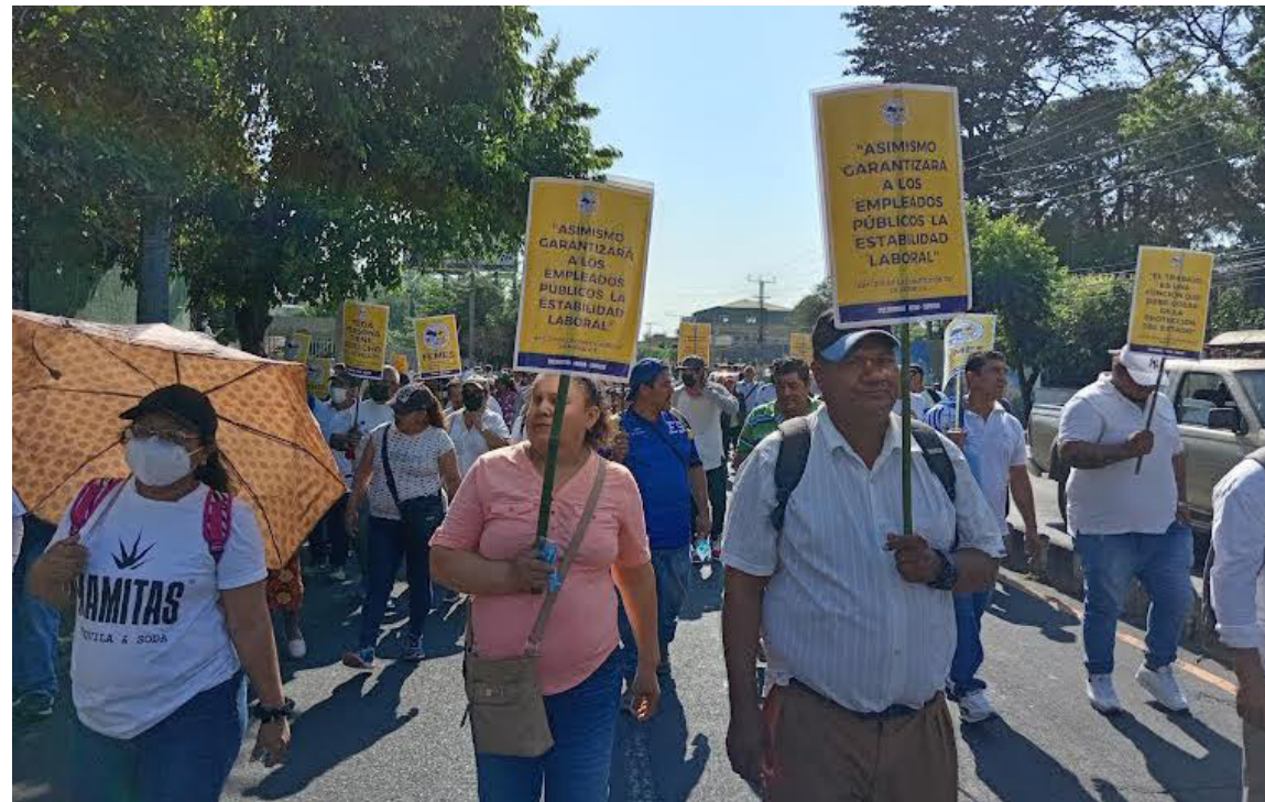
La Federación de Empleados Municipales de El Salvador (FEMES), marcha par exigir estabilidad laboral para el trabajador municipal. Y frenar la nueva posible ola de despidos masivos.