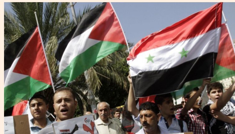
El Salvador sumó fuerza con Palestina para reiterar el derecho de ese pueblo al retorno a su tierra, que ocupan los sionistas.

Kury destacó el apoyo solidario de los pueblos del mundo,