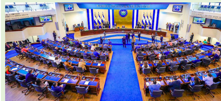
Con la normativa se elimina el Derecho Arancelario a la Importación (DAI) a productos como la leche, papas, tomates, cebollas, chiles verdes, frijoles, carne, plátanos arroz, harina, aceites, vegetales, alimentos para animales, fertilizantes y abonos.

Según datos de la Mesa por la Soberanía Alimentaria, el precio de la canasta básica alimentaria en El Salvador aumentó significativamente entre 2019 y octubre de 2023, esta se elevó $47.52 en la zona rural y $59.67 en la urbana. Siendo que los precios de los productos básicos de alimentos son: para la zona urbana $257.81 y rural de $193.48.