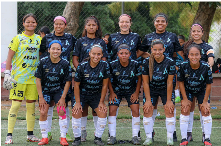
Alianza Women, campeón vigente de la Liga de Fútbol Femenino del país, podría clasificar a la Copa de Campeones con los mejores clubes de la región.