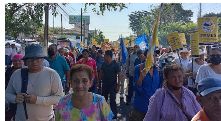
FEMES afirma que pese a que aún no hay despidos a empleados por parte de los gobiernos municipales. Se siguen cometiendo ilegalidades como la retención de prestaciones sociales o créditos bancarios que no son reportados a las instituciones correspondientes en un 80% de las alcaldías.

Con sólo 44 de los anteriores 262 gobiernos locales, las y los empleados municipales han comenzado a percibir una nueva disposición a despidos masivos como los ocurridos en municipalidades como la de Soyapango, que bajo la figura de “supresión de plazas” dejó sin empleo a más de 500 personas, Mejicanos alrededor de 100 personas y en la municipalidad de Ilopango a 80 personas. Con similares situaciones las de San Marcos y Cuscatancingo desde junio del año pasado.