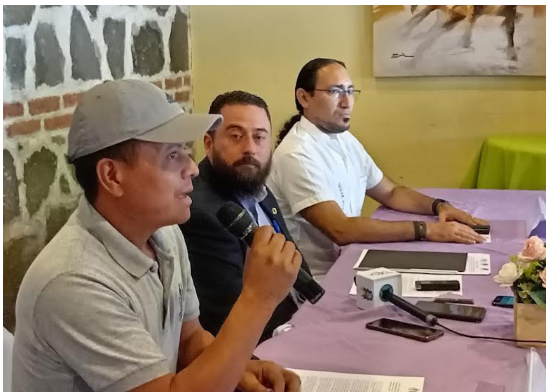
APDHEM, Tutela Legal “Dra. María Julia Hernández” y la Unidad Ecológica Salvadoreña (UNES), denuncian el incumplimiento del Juzgado Ambiental de San Miguel, al negar medidas cautelares a la planta de aguas residuales que construye la DOM, en el Caserío El Mozote.

Gloria Silvia Orellana @Redacción CoLatino