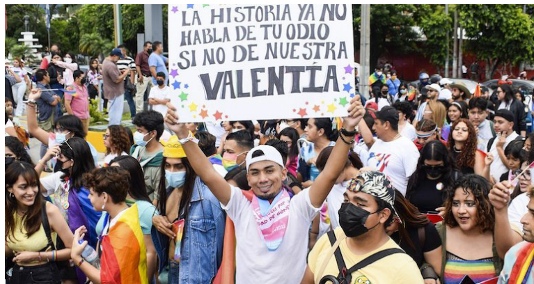
El Movimiento Ampliado LGBT+ de El Salvador, denuncia ataques contra la comunidad LGBTI en el país.

El pasado 22 de febrero, luego de su salida de un foro internacional, el presidente Nayib Bukele