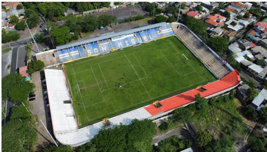
El equipo emplumado podría dejar de jugar en el estadio Juan Francisco Barraza ante el incumplimiento de modificaciones al estadio Juan Francisco Barraza.

Entre los aspectos del equipo debía subsanar está el mantenimiento adecuado del terreno