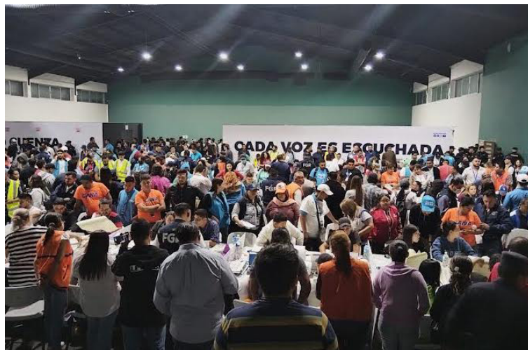
Organizaciones en Estados Unidos instan a las autoridades salvadoreñas a que rindan cuentas claras respecto a las irregularidades de las elecciones del 4 de febrero.

La Oficina en Washington para Asuntos Latinoamericanos (WOLA), Ciudades Hermanas de Estados Unidos-El Salvador, Fundación SHARE, Oficina Maryknoll para Asuntos Mundiales, Grupo de trabajo sobre América Latina (LAWG), Grupo de Trabajo Interreligioso sobre Centroamérica (IRTF), Instituto Fronterizo Hope, y el Comité en Solidaridad con el Pueblo de El Salvador (CIS-