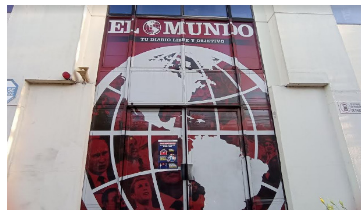
Diario El Mundo cierra su versión impresa y se traslada a plataformas digitales a partir del 2 de marzo.

Diario El Mundo manifestó por medio de una nota en