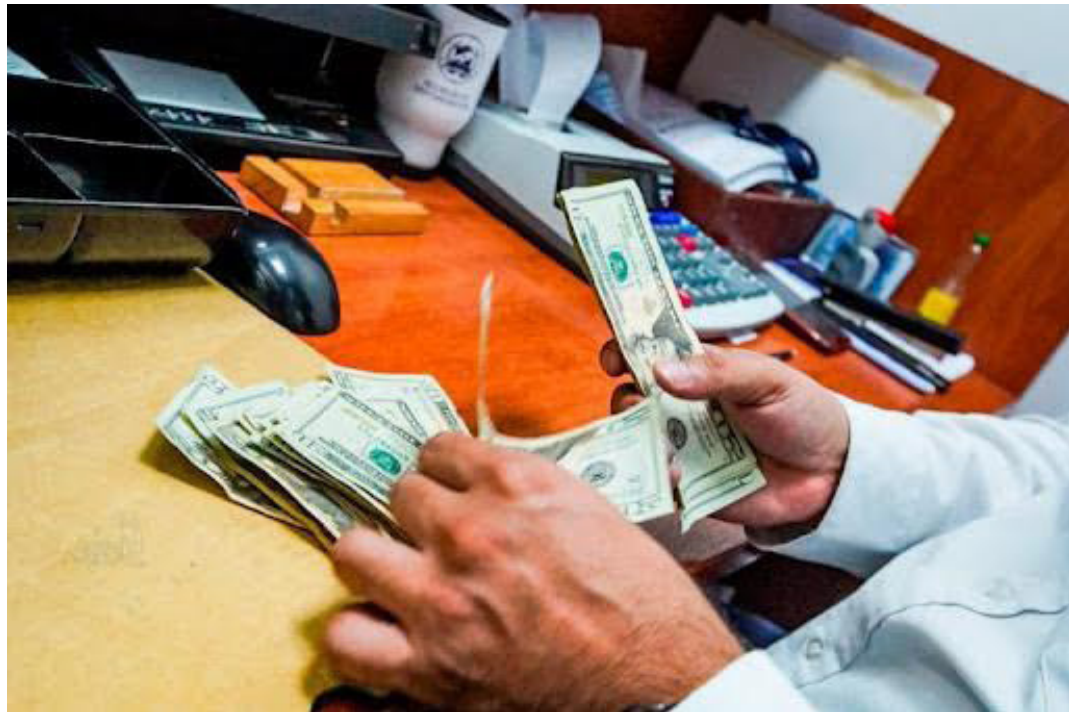
La Asamblea Legislativa aprobó recientemente, con 61 votos a favor y dispensa de trámite una serie de reformas al Código Tributario contenidas en la Pieza 6-A.