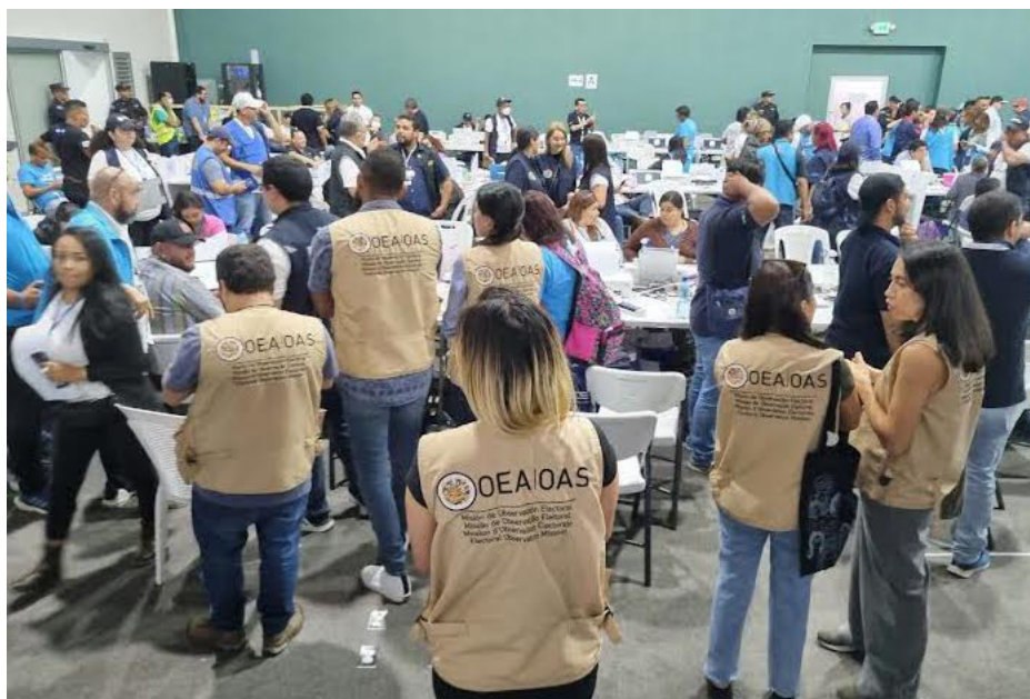
La OEA dijo que durante su despliegue, integrantes de la misión se reunirán con autoridades electorales y de Gobierno, representantes de partidos entre otros.