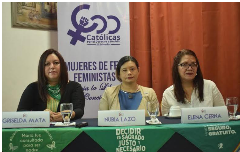
CDD lanza la campaña “Católicas y Feministas ¡Claro, que sí!”, que busca promover una visión que integre lo religioso y los derechos de las mujeres.

La CDD es una organización dedicada a una labor de activismo y defensa de los derechos humanos, particularmente enfocada en visibilizar los derechos sexuales y reproductivos de las mujeres. La organización se centra en visibilizar la situación de las mujeres criminalizadas por aborto, promover el respeto a la