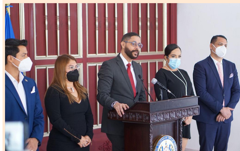
Luego de las elecciones para concejos municipales se retomará el trabajo de la comisión especial que investiga el pago de supuestos sobresueldos en gobiernos anteriores.