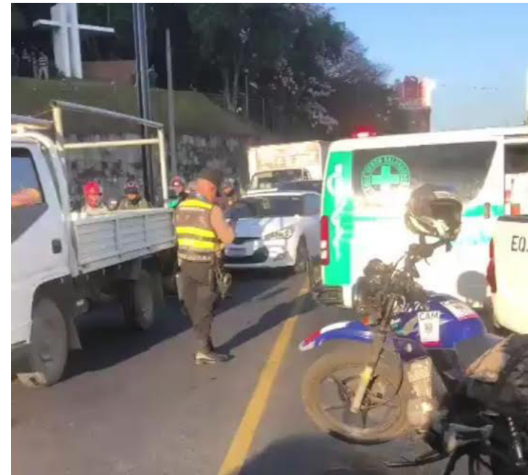
Múltiple accidente de tránsito en boulevard Los Próceres, deja saldo de 4 personas lesionadas y un embotellamiento en horas de la mañana.

Mientras, en las cifras de lesionados para el 2024 suman mil 807, frente a los mil 652 del año pasado. Y comparten la misma cifra 210, para ambos años, de personas falleci-