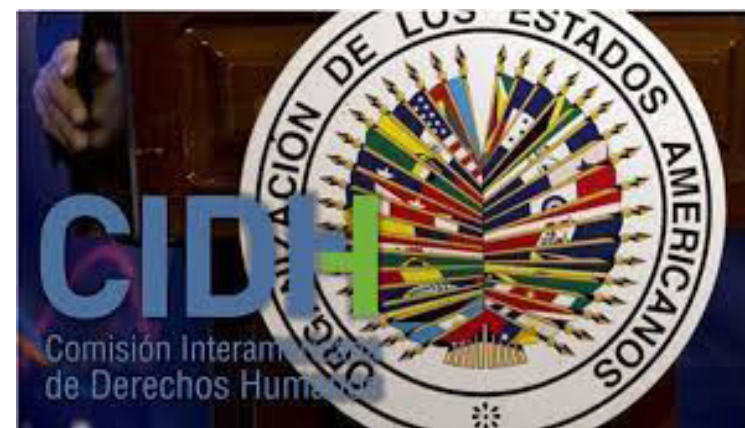
La Comisión Interamericana de Derechos Humanos (CIDH), elige su nueva junta directiva para el año 2024, en el marco de la apertura del 189 Período de Sesiones de la CIDH.