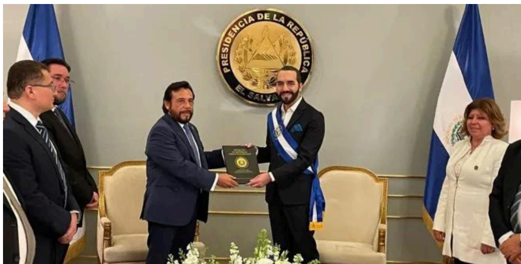
Nayib Bukele y Félix Ulloa serán acreditados por el Tribunal Supremo Electoral (TSE) como presidente y vicepresidente, a pesar de ser inconstitucional.

A pesar de que la Carta Magna prohíbe en al menos seis artículos la reelección de forma consecutiva, Bukele se ratificó como “el nuevo” presiden-