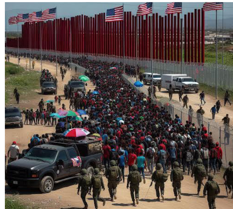
El dato ha sido divulgado por la Oficina de Aduanas y Protección Fronteriza (CBP, en inglés), el cierre del mes de enero de 2024.

México, ciertamente, es el país de origen que capitaliza el mayor número de migrantes irregulares, con un aporte de 61,272; sin embargo, la cantidad es un 3.65% menor respecto a los 63,511 reportados en 2023. Un caso contrario fue el de Haití, que llegó a reportar hasta 23,723 irregulares, siendo un 9.78% mayor respecto al de 2023; Cuba acrecentó el flujo de irregulares en un 9.46%, pasando de los 11,914 en 2023 a los 22,946 migrantes irregulares en el mismo