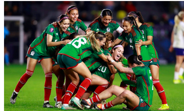
De forma histórica, México vence a Estados Unidos y avanza como líder a los cuartos de final de la Copa Oro W.

Sin embargo, este cometido tiene muy pocas probabilidades tras el desarrollo que ha tenido el cuadro cuscatleco al caer por goleada tras la media docena de goles que le propi-