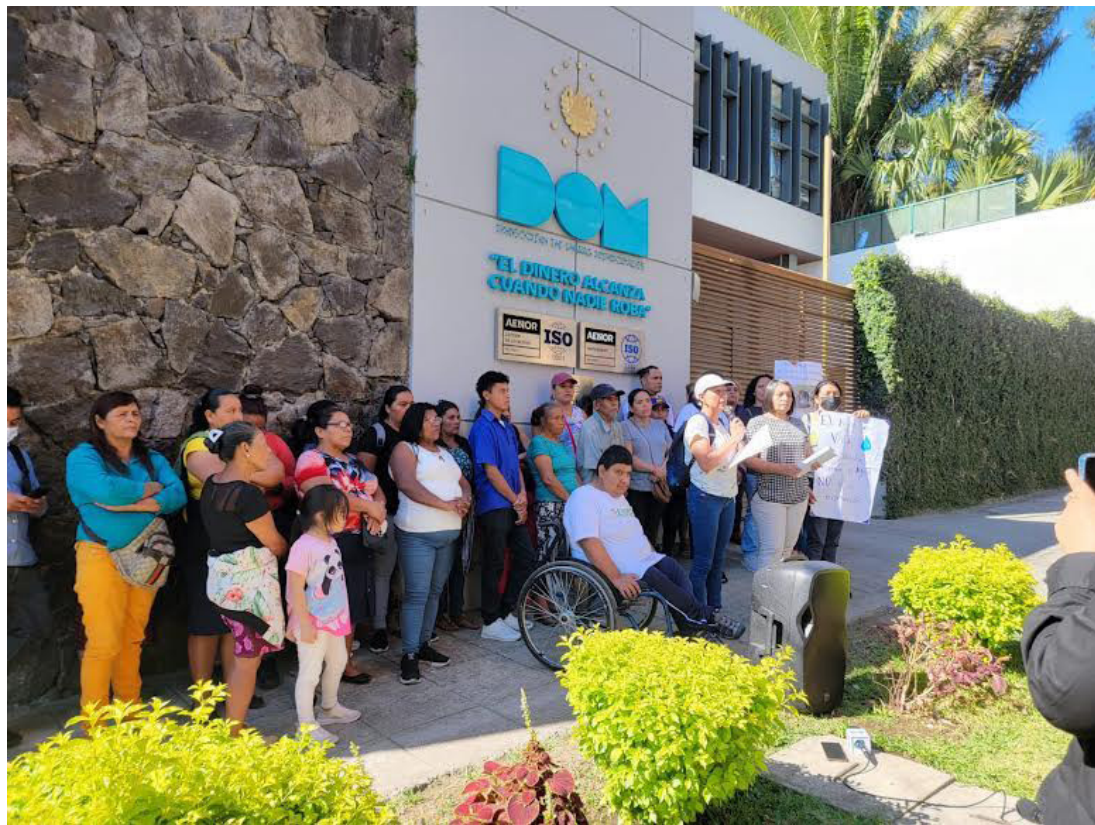
La Asociación de Desarrollo Comunal El Matazano, del municipio de Santa Tecla, La Libertad, y la Red Nacional de Juntas de Agua, exigen no ser expropiadas de un terreno que garantiza su derecho al agua.

Por años hemos estado abandonados por diferentes gobiernos y cuando hubo una esperanza de una mejora nos vienen a estancar todo, cuando la DOM llega a decirnos que quiere esos terrenos