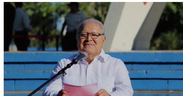
Expresidente de la República Salvador Sánchez Cerén.

La acusación que recae sobre los acusados es que recibían dinero de la partida secreta y solo Sánchez Cerén ha-