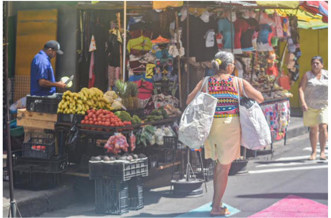
La realidad es muy distinta para los salvadoreños que resienten la actual situación económica y señalan un alto costo de los alimentos y servicios básicos.

Una encuesta del Instituto Universitario de Opinión Pública de la UCA (Iudop), reveló que un poco más de la mitad de los salvadoreños encuestados (53.6%) manifestaron que su situación económica familiar en 2023 siguió igual que en años