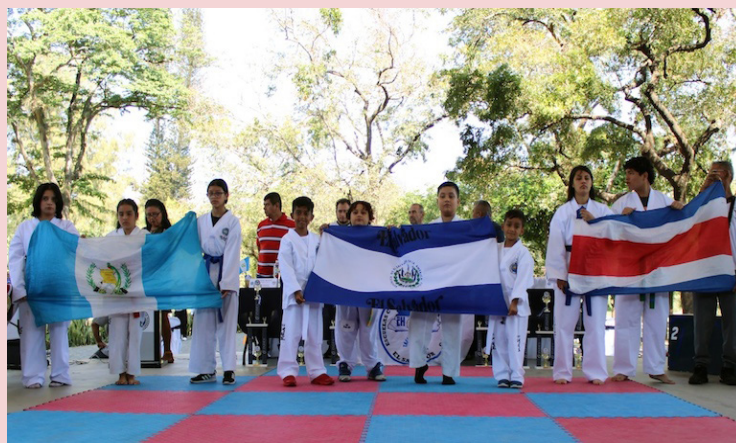
El taekwondo reúne a aproximadamente cien estudiantes de El Salvador, Guatemala y Costa Rica en el 4º Ranking Amistoso.

El cuarto ranking amistoso se efectuó en el Parque Cuscatlán, con la participación de la Escuela de Taekwondo República de Guatemala y la Escuela de Taekwondo República de Costa