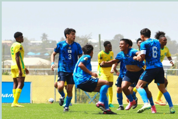
La selección sub-20 de El Salvador podría enfrentar dos bajas importantes de cara a los últimos dos partidos de la eliminatoria de CONCACAF. Una ya está confirmada.