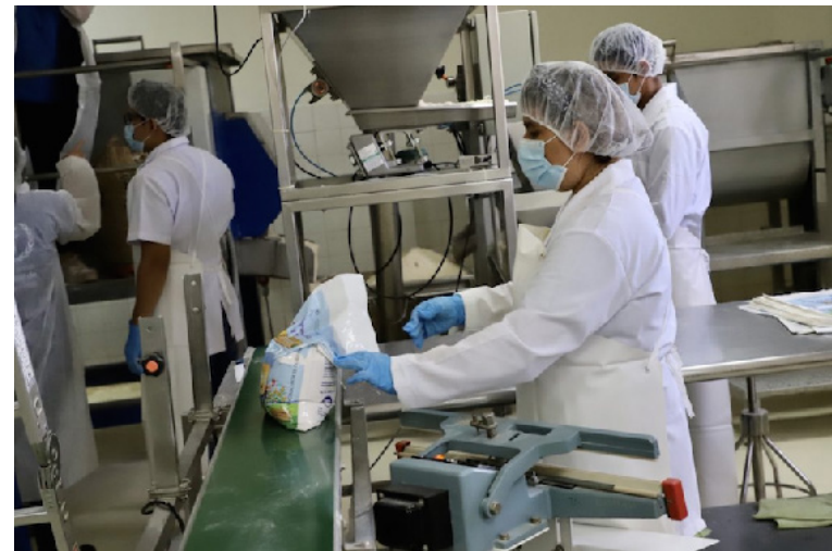
La Asamblea Legislativa aprobó, con 73 votos a favor, la ratificación del acuerdo entre el Ministerio de Hacienda y el Programa Mundial de Alimentos (PMA) de la ONU.

El acuerdo se enmarca en prioridades como el Plan Maestro de Rescate Agropecuario y la Política Nacional de Seguridad Alimentaria. Según el dictamen, la ratificación contribuirá a planes estratégicos para “fortalecer comunidades afectadas