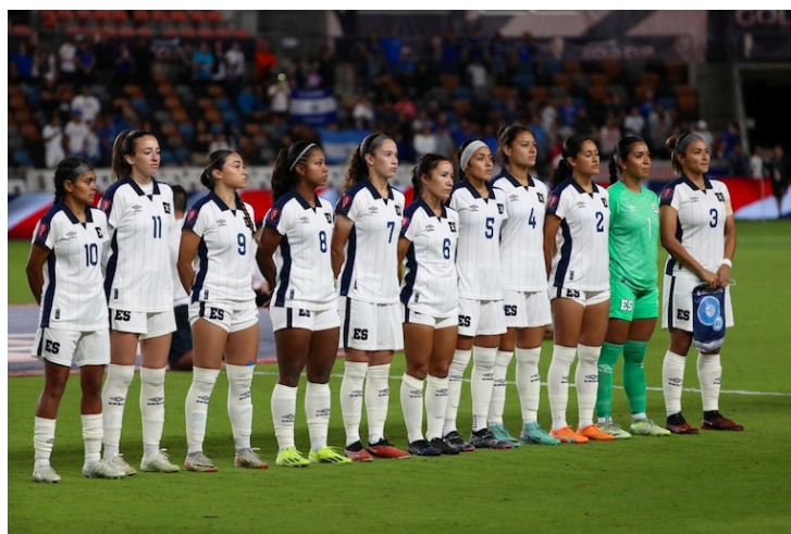
La selección femenina previo al encuentro contra Costa Rica en el segundo partido de la Copa Oro W, en Houston.