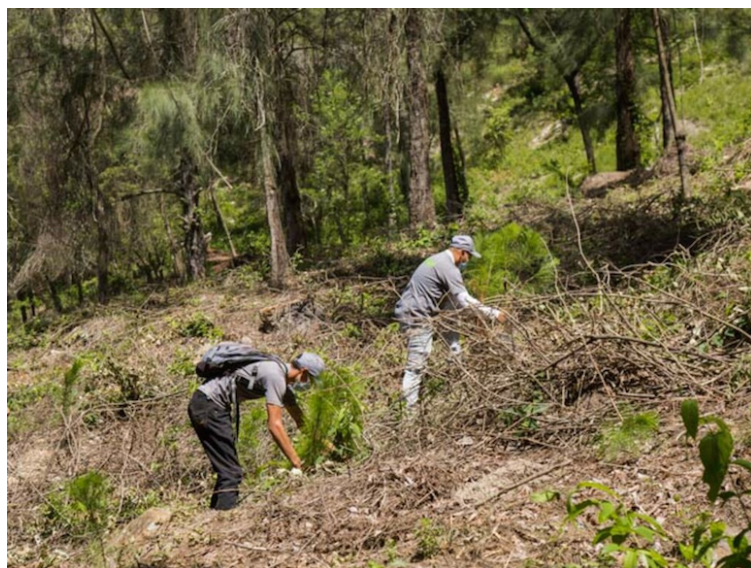
La Asamblea Legislativa aprobó en la Sesión Plenaria Ordinaria la incorporación de $311,653.00 para el financiamiento del “Programa de Corredores Productivos Componentes I, III y IV”, otorgados por el Banco Interamericano de Desarrollo (BID) al Ministerio de Hacienda de El Salvador.

El BID ha financiado anteriormente otros programas de corredores productivos en El Salvador. En 2016, se aprobó el préstamo BID 2499/OC-ES por $30 millones para el “Programa Inte-