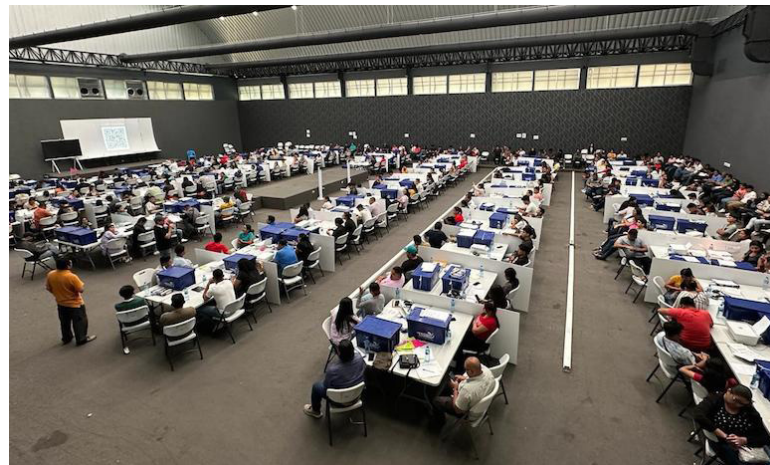
El Tribunal Supremo Electoral (TSE) capacita a los auxiliares de soporte para la transmisión de resultados de las Juntas Receptoras de Votos (JRV) de las elecciones del 3 de marzo.

“El TSE sigue impartiendo capacitaciones a los integrantes de las JRV para las elecciones