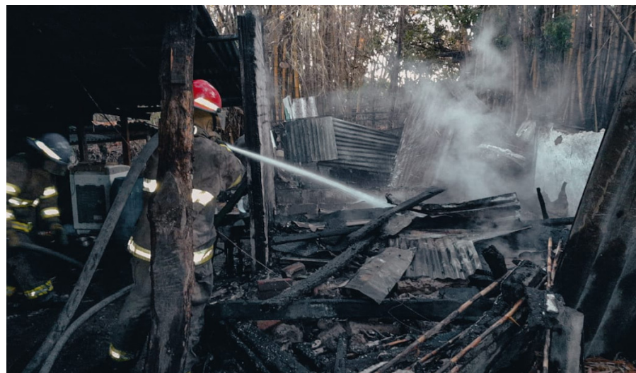
Una vivienda de La Comunidad California, en Soyapango, se incendió dejando daños materiales.

El Cuerpo de Bomberos no ha dado detalles