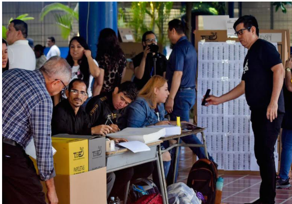
La Fundación de Estudios para la Aplicación del Derechos (FESPAD), analiza que de las recientes elecciones presidencial y legislativas, cuestiona la falta de respuestas a la situación que actualmente vive el país.

El recuento de votos no será capaz de establecer quién ganó o perdió el 4 de febrero, tampoco qué se ganó o perdió. Únicamente definirá la simpatía hacia una u otra persona o partido político. Y promover la construcción de una ciudadanía informada.