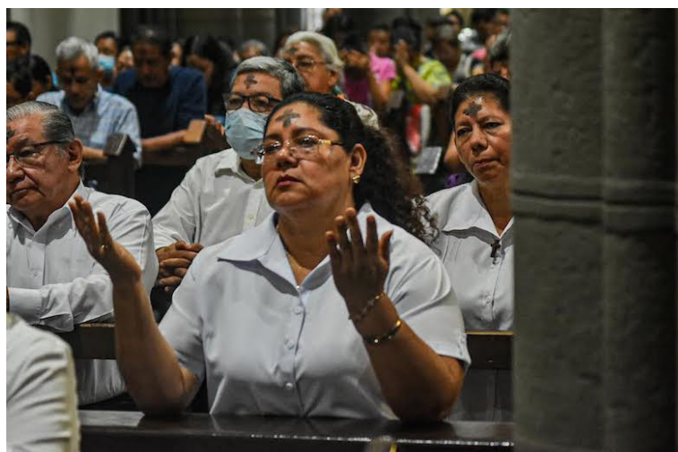
Este miércoles los feligreses acuden a los templos católicos desde tempranas horas, para que le sea colocada la cruz de ceniza en sus frentes.