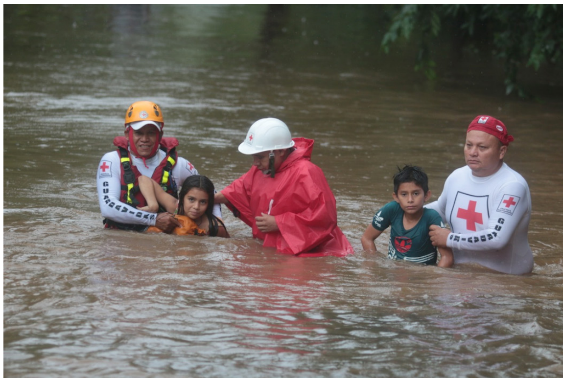
La entrada del fenómeno de La Niña, en el país en este año, genera inquietud por amplias poblaciones vulnerables y déficits en seguridad alimentaria del 2023.

“Estamos hablando que en el año 2023 más de 867 mil personas, vienen necesitando atención humanitaria justo por la inseguridad alimentaria. Y esto puede agudizarse en el presente año por las proyecciones climáticas y áreas meteorológicas en los términos de la transición del fenómeno de El Niño al fenómeno de La Niña”, explicó Amaya. Entidades reconocidas como el Centro de Predicciones Climáticas de la Oficina Nacional de Administración Oceánica y Atmosférica de Estados Unidos (NOAA/inglés) y el Centro de Predicción Climática (CPC), indicaron, en un informe reciente, que existe un “55% de probabilidad” que el fenómeno de La Niña se desarrolle a partir del mes de junio y agosto de 2024. Para Amaya, el fenómeno de El Niño impactó directamente a campesinos y campesinas, así como Pueblos Indígenas, en sus cultivos de granos básicos que se perdieron por la falta de lluvias y por la elevación de las temperaturas, que provocó, además, una sequía. “No olvidemos que el año