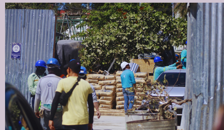
Al comparar el avance en las obras del nuevo hospital con las visitas anteriores realizadas por YSUCA no se observan muchos avances.

Al intentar tomar fotografías de los avances el equipo de la radio fue dirigido a un encargado para solicitar acceso a la construcción, quien