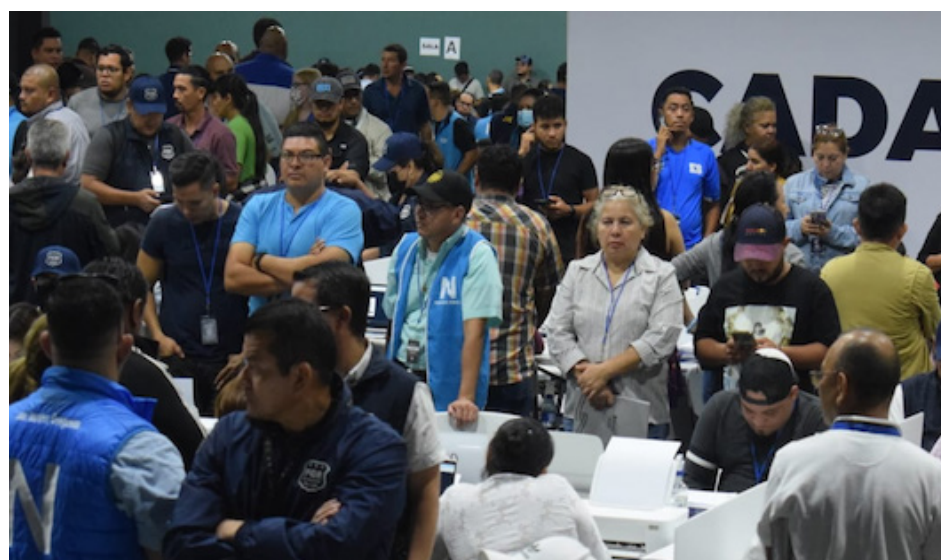
El conteo de votos se lleva a cabo en el Gimnasio Nacional con múltiples denuncias de irregularidades.

“Yo creo que los magistrados están queriendo ver cómo se limpian sus nombres, pero aquí los únicos culpables han sido la presidenta (Dora Esmeralda), el magistrado (Guillermo) Wellman, el magistrado (Noel) Orellana, el magistrado Rubén (Meléndez), el magistrado Marlon (Cornejo) y que aún siguen sin dar la cara”, concluyó.