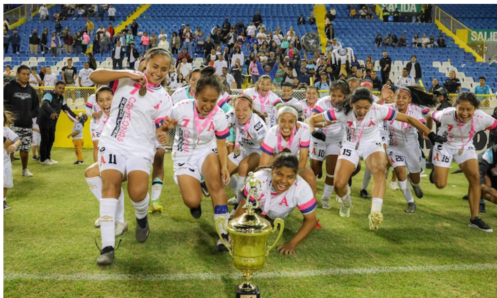
Alianza celebra el trofeo del Apertura 2023 tras derrotar a Águila en el Cuscatlán.

La jornada uno dará inicio este sábado 17 a las 10:00 a.m. en la Federación Salvadoreña de Fútbol (FESFUT), con la serie entre Santa Tecla y las tigrillas de FAS.