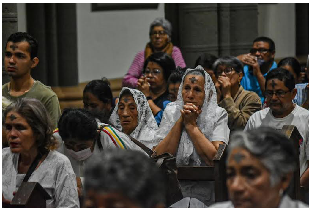
Desde el Miércoles de Ceniza hasta antes del Triduo Pascual son los cuarenta días simbólicos, que recuerdan el tiempo cuando Jesús estuvo en el desierto.

El aporte puede ser entregado en las parroquias, ermitas o depositarlo a la cuenta del Banco Agrícola 0050 4010 5399.