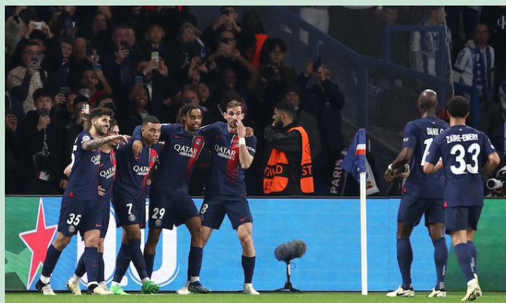
El PSG derrota al Real Sociedad en el encuentro de ida de la Champions League.

La posesión del balón fue en mayoría para los alemanes, de un 61%, a un 38% de los locales, pero la suerte no estuvo a favor del equipo de Tomas Tuchel, que