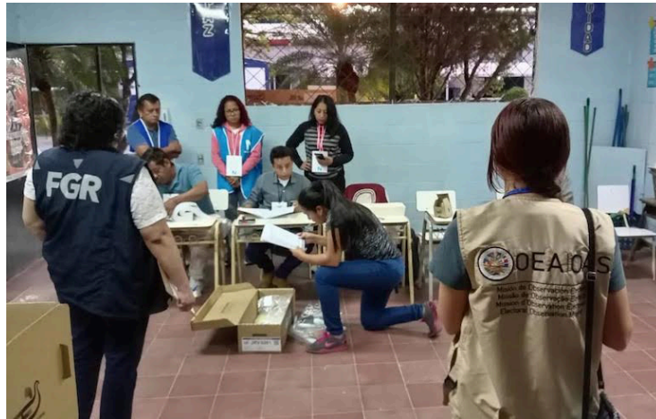
La misión de observadores de la OEA destaca el trabajo de las Juntas Receptoras de Votos, en las elecciones del 4 de febrero, quienes en muchos casos ejercieron funciones por más de 20 horas.

La misión encabezada por la exvicepresidenta y ex canciller de Panamá, Isabel de Saint Malo, indicó que fallas como retrasos en la distribución de los kits tecnológicos, ausencia de materiales para imprimir las actas, falta de luz y conectividad de Internet, son todos previsibles y podrían haberse evi-