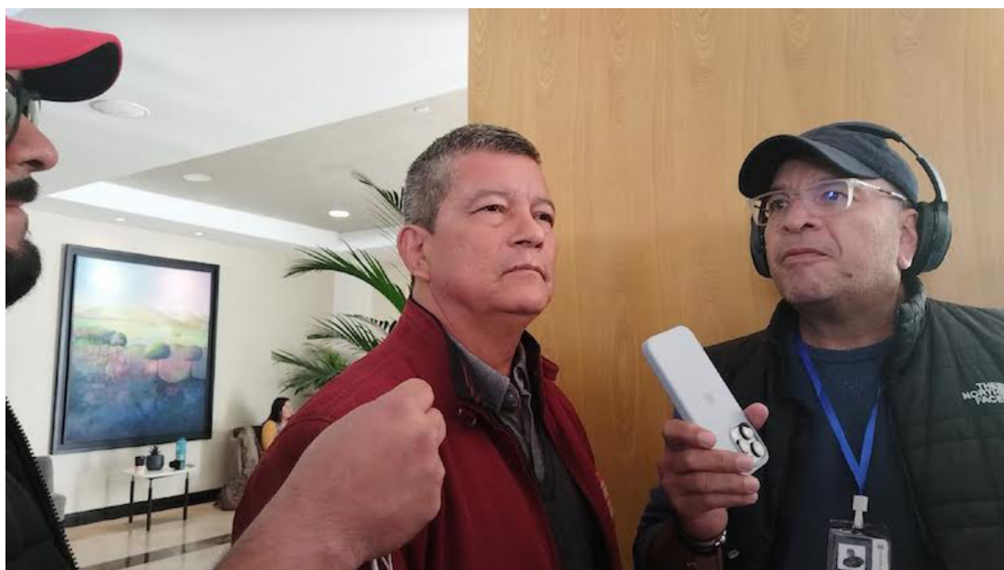
Manuel Flores, candidato presidencial de FMLN, sostiene que el proceso electoral se ha manipulado.

Flores recordó que, para la elección legislativa, “no hay datos oficiales”, pero Bukele y Nuevas Ideas se ampararon en una encuesta “boca de urna”. Este miércoles se tenía previsto que iniciaría el escrutinio final tanto para las presidenciales como Asamblea Legislativa.