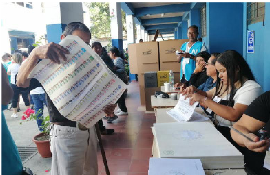
Con el 70% de actas escrutadas para la elección de presidente, se determina que la votación fue de 2 millones de salvadoreños, es decir, votó el 48% de la población y el 52% no emitió el sufragio.

“El Tribunal comenzó a dar datos erróneos y de acuerdo a la información que estaban dando iban a votar 7 millones, pero aquí vivimos un