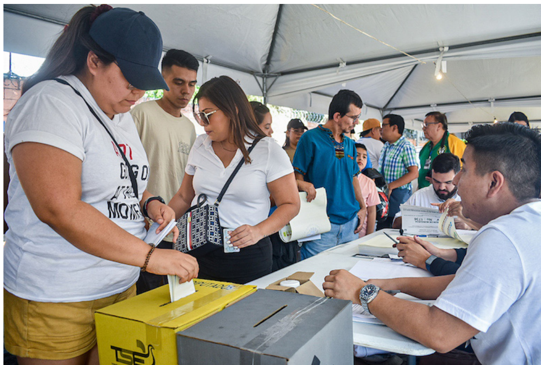
El CISPES, evalúa las elecciones presidenciales y legislativas del pasado domingo 4 de febrero como injustas y no se aplica a los estándares internacionales del derecho a emitir el sufragio.

y justas”, el CISPES reiteró que son difíciles de realizarse si la población se encuentra en “circunstancias extraordinarias del estado de excepción” que anulan derechos básicos como libertad de asociación y el debido proceso que están suspendidos por casi dos años, sin que se vislumbre una verdadera política de seguridad pública.