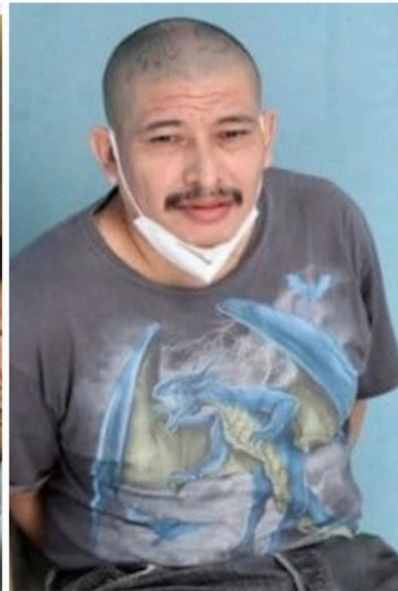
El Gobierno salvadoreño fue engañado por un líder pandillero de la 18 en su desesperación por recapturar al Crook.

puso a Escuintla que le proporcionara datos de inteligencia salvadoreña que indicaran el paradero del Crook; para, así, coordinar con el cártel Jalisco Nueva Generación una operación relámpago para raptarlo. Claro que ni el cártel ni su pandilla trabajarían de gratis, habría que negociar el precio para cada uno. Rafael, además, solicitó "viáticos" para la movilidad y comunicación; el agente le aseguró que no habría problema. El Cártel Jalisco Nueva Generación es una de las mayores organizaciones de tráfico de drogas en el mundo.