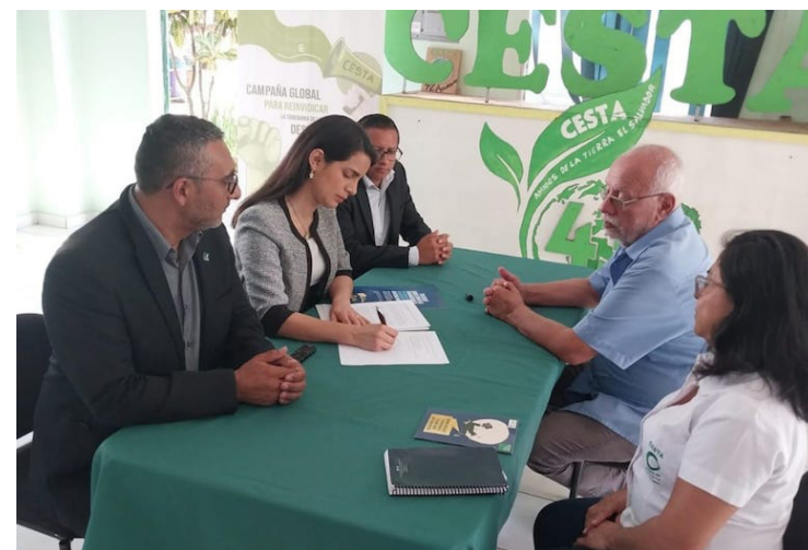
El CESTA informa que cuatro diputadas de diferentes partidos políticos se unieron a la Red Interparlamentaria Global en apoyo a un tratado vinculante sobre empresas transnacionales y derechos humanos.

Además, Navarro consideró que el Tratado vinculante sobre empresas transnacionales y Derechos Humanos que se discute en las Naciones Unidas es la oportunidad para trascender de normas jurídicas voluntarias que son con las que actualmente las empresas hacen mención y de esta manera