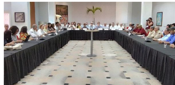
El ELN pide garantías de que el cese cumpliera su función principal, que era mejorar las condiciones de vida y los derechos humanos de la población civil.

En ese sentido, el jefe negociador de la guerrilla dijo que “las operaciones paramilitares contra el ELN en algunas regiones son