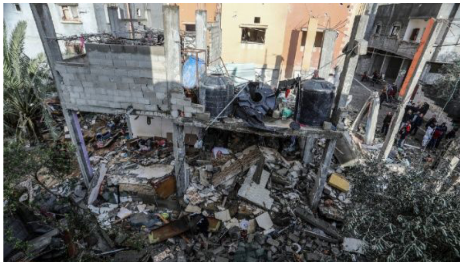
Las tropas invasoras israelíes continuaron su campaña de destrucción de viviendas y estructuras pertenecientes a ciudadanos palestinos locales en la zona de Al-Batn Al-Sameen de Khan Yunis.

El Ministerio de Salud palestino afirmó que todavía hay 30 muertos no identificados en la morgue del Complejo Médico Nasser, mientras que los ciudadanos se vieron obligados a enterrar a 150 muertos en el patio del Complejo debido del asedio de la ocupación al mismo.