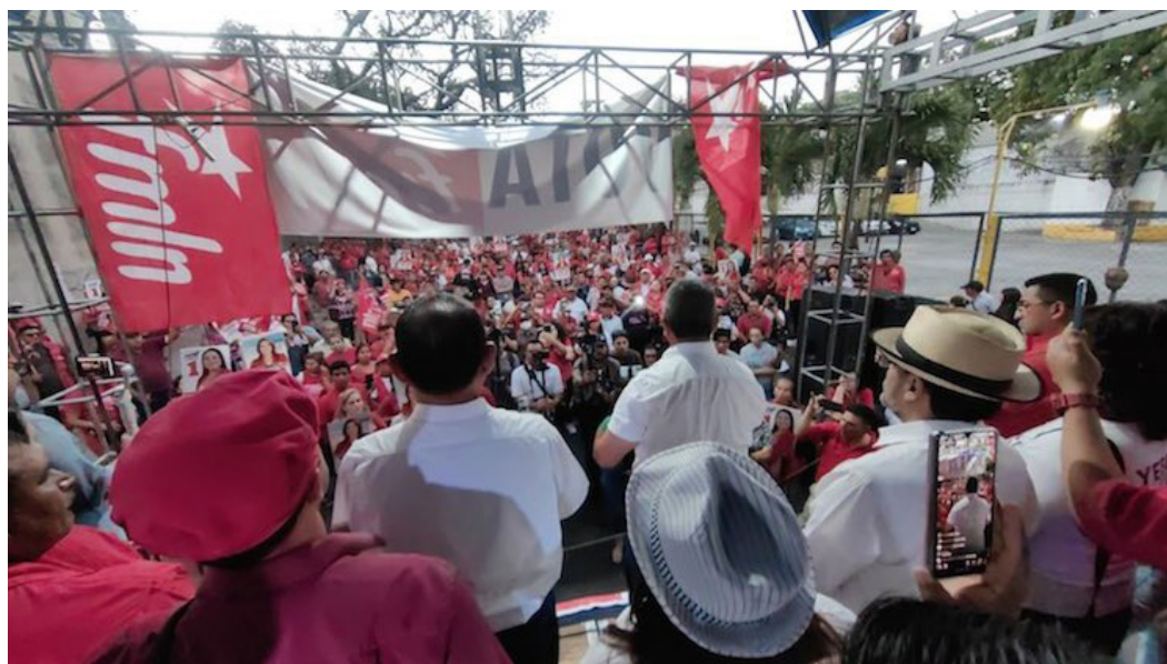
El Frente Farabundo Martí para la Liberación Nacional (FMLN), tanto candidatos a diputados, así como la fórmula presidencial, realiza el cierre de campaña en San Salvador, previo a las elecciones del próximo fin de semana.

Las elecciones están a la vuelta de la esquina; este próximo 4 de febrero se escogerán a un presidente, un vicepresidente y a 60 diputados de la Asamblea Legislativa.