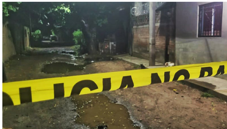
La Organización de Mujeres Salvadoreñas por la Paz (ORMUSA) manifiesta preocupación por feminicidios a menores de edad a inicios del 2024.

Los recientes casos de asesinatos a niñas de 3 y 7 años a manos de sus progenitores, ocurridos en las primeras semanas de 2024, han encendido las alarmas de la Organización de Mujeres Salvadoreñas por la Paz (ORMUSA). En un pronunciamiento, la entidad manifestó su “profunda preocupación” por estos hechos que evidencian la urgencia de combatir la violencia contra menores de edad. Uno de los incidentes se registró el 21 de enero en Ahuachapán, donde una niña de 7 años fue golpeada hasta la muerte por su padre. El otro fue el 4 de enero, en Usulután, donde una niña de 3 años fue presuntamente asesinada a golpes por su padrastro. Estos casos se suman a las altas cifras de violencia que persisten contra niñas, niños y adolescentes en el país. De acuerdo con datos del Consejo Nacional de la Niñez y Adolescencia (CONNA), entre enero y noviembre de 2023 se registraron 20,618 menores de