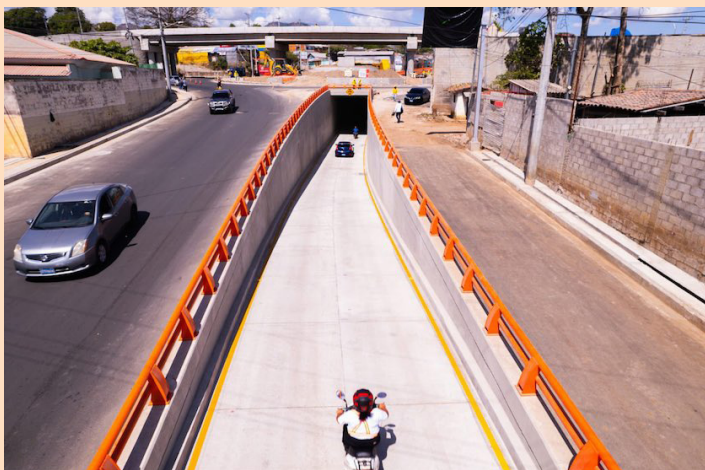
Las personas que quieran movilizarse desde la calle antigua a San Salvador hacia la 25 avenida Sur, pueden utilizar el paso subterráneo que se habilitó en el sector del redondel UNICAES.

El paso a desnivel contempla dos obras importantes: un paso elevado con 269 metros de longitud y un túnel de 226 metros de longitud, aproximadamente. El túnel que se construyó y se habilitó en el redondel UNICAES conectará la calle antigua a San Salvador con la 25 avenida Sur.