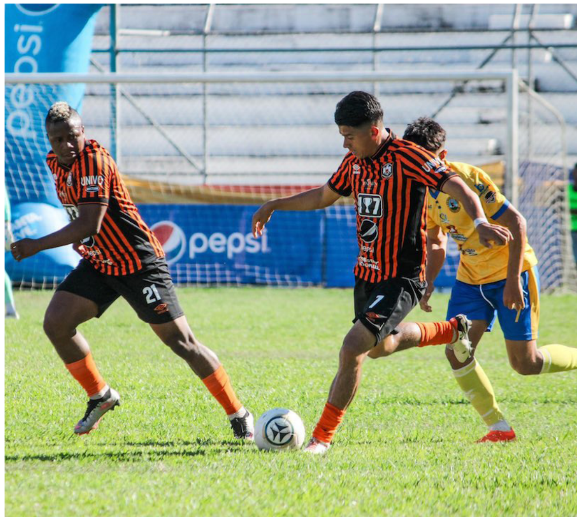
CD Águila vence a Municipal Limeño por la mínima en el Barraza, suma la primera victoria y se queda con el invicto del cuadro cuchero en la jornada 4 del Clausura 2024.

Alianza fue otro de los equipos de la cuarta fecha que sumó de a 3, luego de golear 1-3 a los