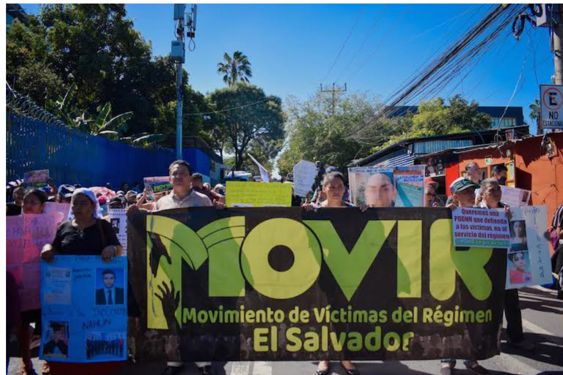
Miembros de MOVIR y Contraloría Ciudadana solicitan a la Asamblea Legislativa la creación de un decreto transitorio que permita la liberación de inocentes privados de libertad con enfermedades crónicas.