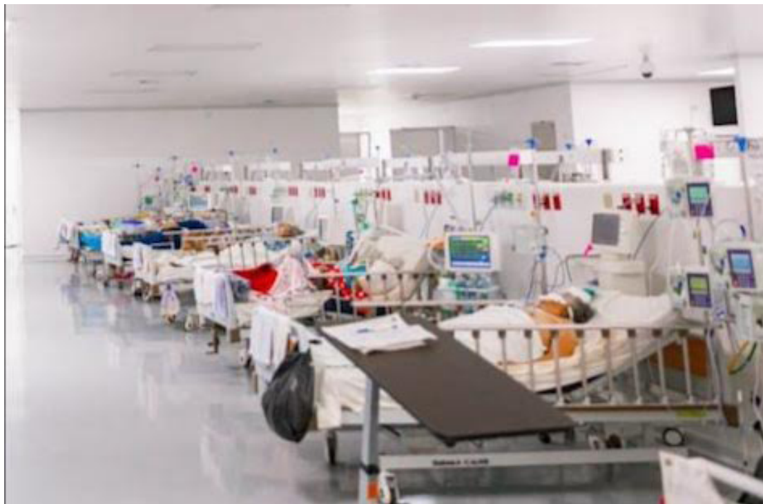
El Ministerio de Salud reporta que 18 adultos y un menor de edad, permanecen ingresados por COVID-19.