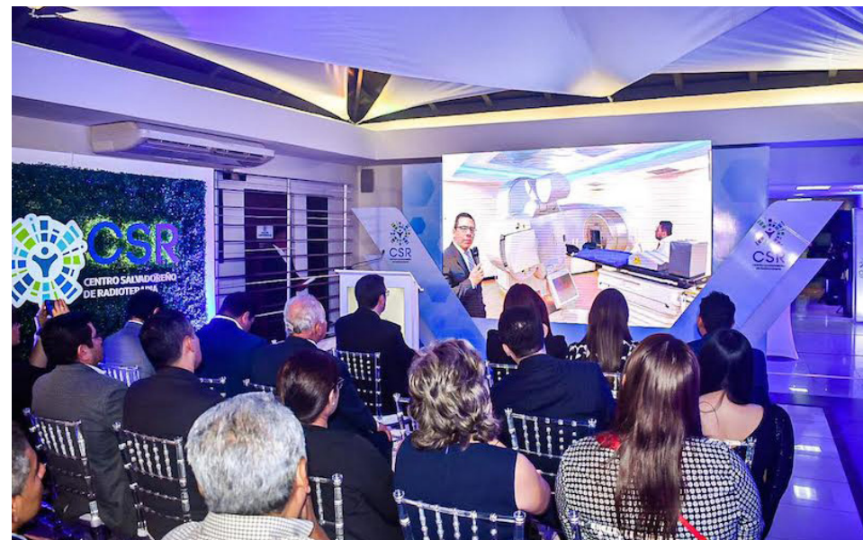
La re-inauguración fue un evento lleno de distinción, con la grata presencia de importantes invitados en el área de la salud para presentar la nueva tecnología única en la región centroamericana para el tratamiento en radioterapia.