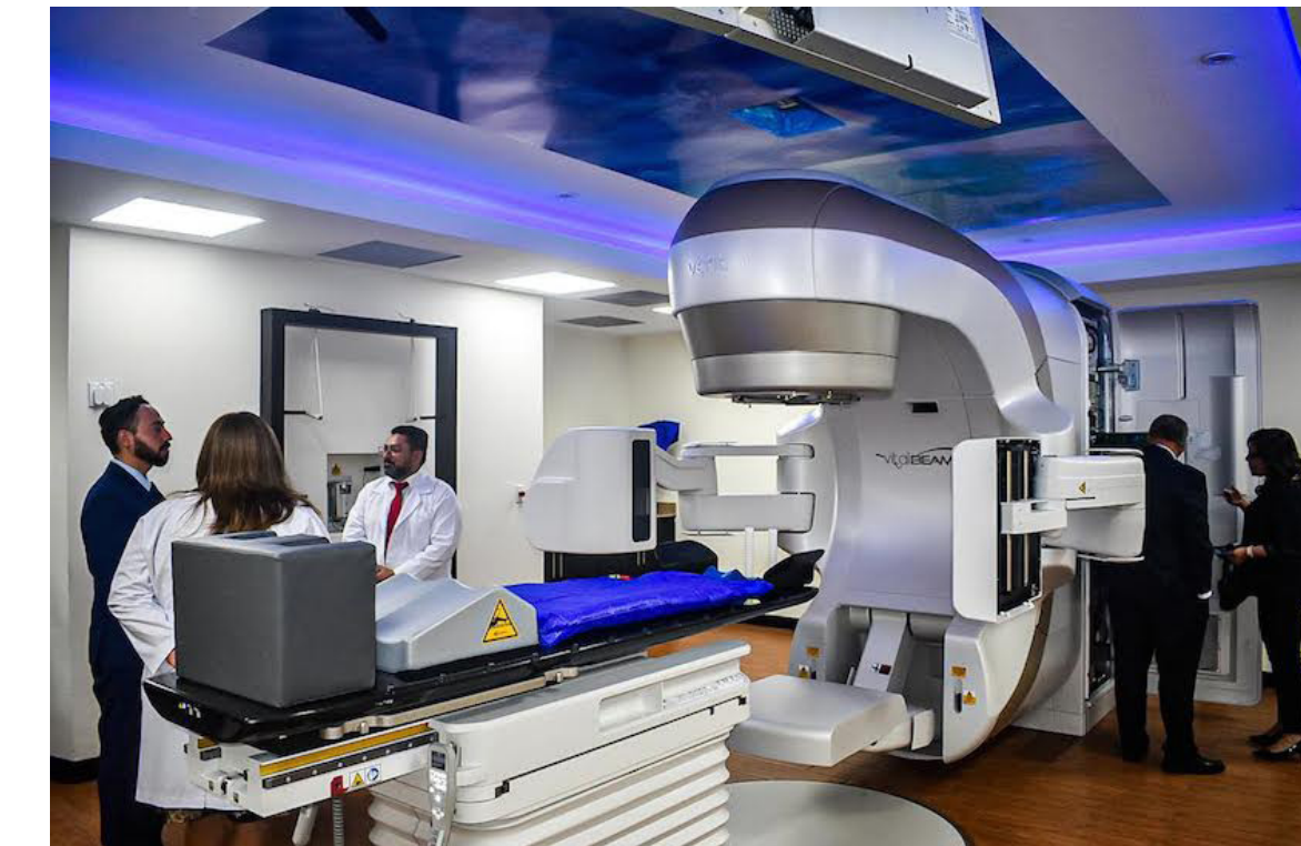
Este es el equipo que presenta el Centro Salvadoreño de Radioterapia para tratar a las personas con cáncer.