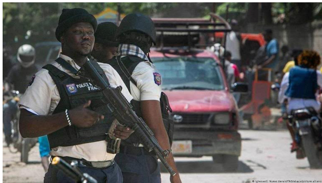
La situación de terror e incertidumbre en Haití, demanda una actuación más efectiva de la fuerza policial en pos de la seguridad ciudadana.

El diario Le Nouvelliste explicó que algunos centros privados están desbordados,