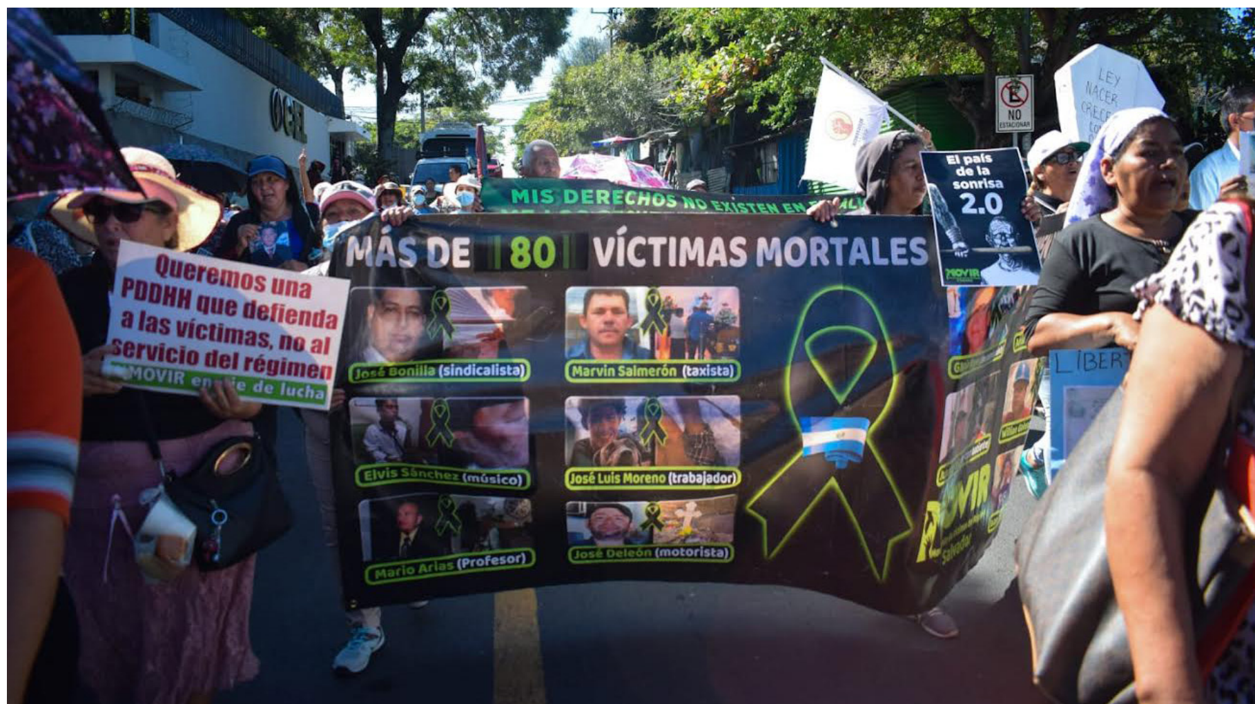
EL MOVIMIENTO DE VÍCTIMAS DEL RÉGIMEN (MOVIR) Y CONTRALORÍA CIUDADANA PRESENTAN PROPUESTAS A LA ASAMBLEA LEGISLATIVA PARA LA IMPLEMENTACIÓN DE MEDIDAS SUSTITUTIVAS, DIRIGIDAS A PERSONAS INOCENTES, PRIVADAS DE LIBERTAD BAJO EL RÉGIMEN DE EXCEPCIÓN, QUE PADECEN ENFERMEDADES CRÓNICAS COMO HIPERTENSIÓN, CÁNCER, EPILEPSIA, VIH, DISPLASIA SEVERA, ENTRE OTRAS. LA INICIATIVA BUSCA LIBERAR A AQUELLOS DETENIDOS QUE NO RECIBEN ATENCIÓN MÉDICA ADECUADA DENTRO DE LOS CENTROS PENALES, PARA QUE PUEDAN SER ATENDIDOS POR PROFESIONALES EXTERNOS.