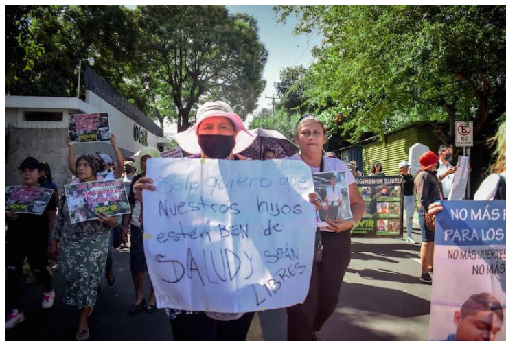
Integrantes de MOVIR denuncian las muertes de personas causadas por la falta de atención médica en centros penales.

El diputado de ARENA, Francisco Lira, concluyó que no buscan la liberación de los pandilleros; sino, de los inocentes, pues se ha montado todo un aparato de propaganda para decir que, si la oposición gana las elecciones, se liberarán a los pandilleros ya que no tendrían los votos suficientes para “continuar con la guerra”.