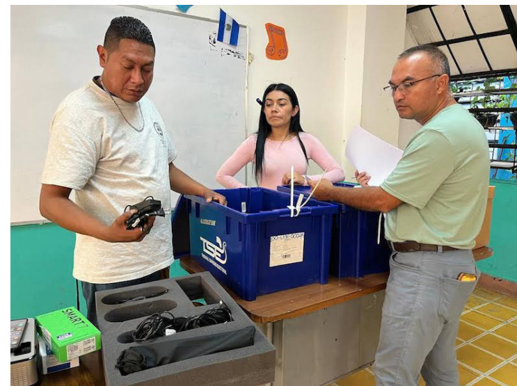
En el simulacro de transmisión de resultados preliminares se puso a prueba el aparato logístico-operativo, que también comprendió el despliegue del recurso humano.

La Dirección de Organización Electoral (DOE) del TSE finalizó el llenado de 4,534 paquetes electorales, de 11 departamentos del país, correspondientes a la elección de presidente