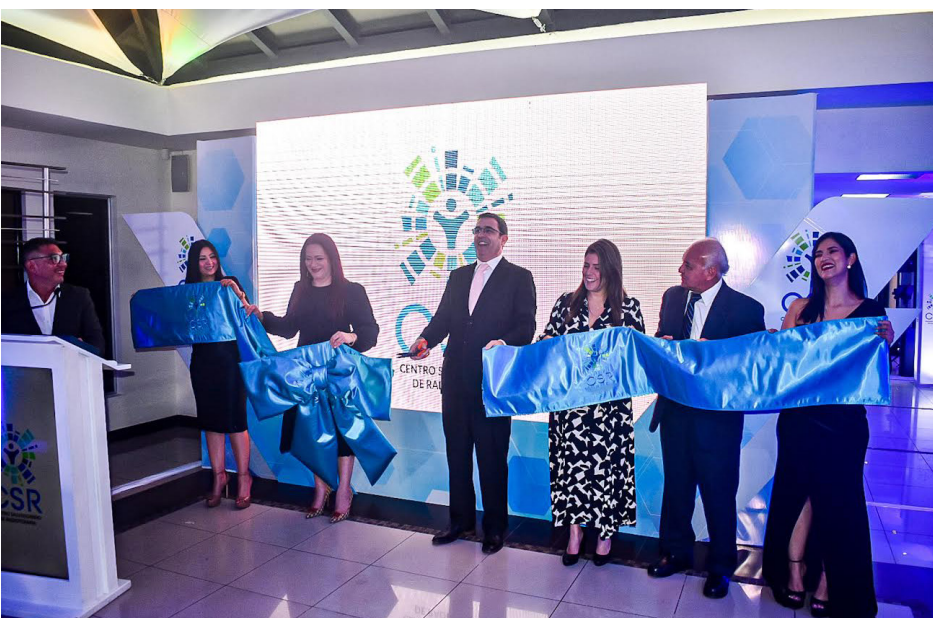
Momento en que las autoridades del CSR cortan la cinta para dar paso al inicio de funciones del acelerador lineal para salvar vidas de los salvadoreños.

Hoy el pueblo salvadoreño tiene a su disposición este equipo para la cura de los tratamientos con el cáncer; esperamos ayudar a la mayor cantidad posible de personas en la lucha con esta en-