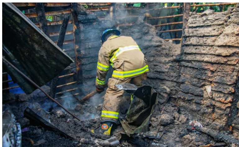
Bomberos controló un incendio estructural en una vivienda del sector de la línea férrea, kilómetro 23 de la carretera Panamericana, caserío El Tamarrindo, San Pedro Perulapán, Cuscatlán.

Otro incendio ocurrió en una acumulación de leña dentro de una vivienda en la colonia Jardines de Las Pavas, pasaje 4, Cojutepeque, Cuscatlán; Bomberos llevó a cabo maniobras efectivas para detener la