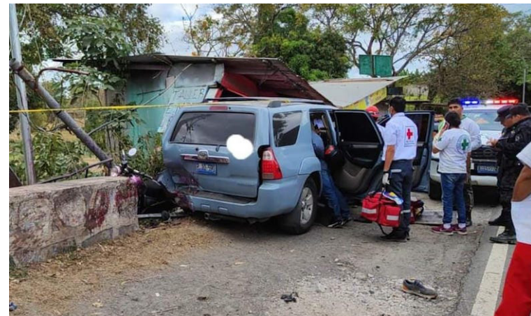
El conductor de una camioneta perdió el control ocasionando la muerte de una mujer, en el kilómetro 47 de la carretera Panamericana, cantón Izcanales, Santo Domingo, San Vicente.

Durante el fin de semana, el Viceministerio de Transporte (VMT) en coordinación con la División de Tránsito Terrestre de la Policía Nacional Civil (PNC) instalaron dispositivos