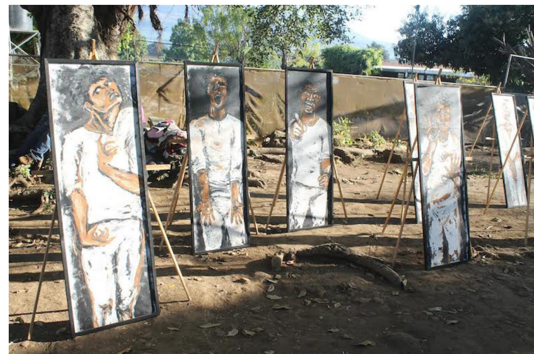
Fueron más de 30 mil asesinados durante la represión impulsada por el gobierno de facto de Maximiliano Hernández Martínez, que bajo el argumento de presencia Comunista en el país, en 1932 ordenó la masacre de poblaciones enteras del occidente y centro del territorio.