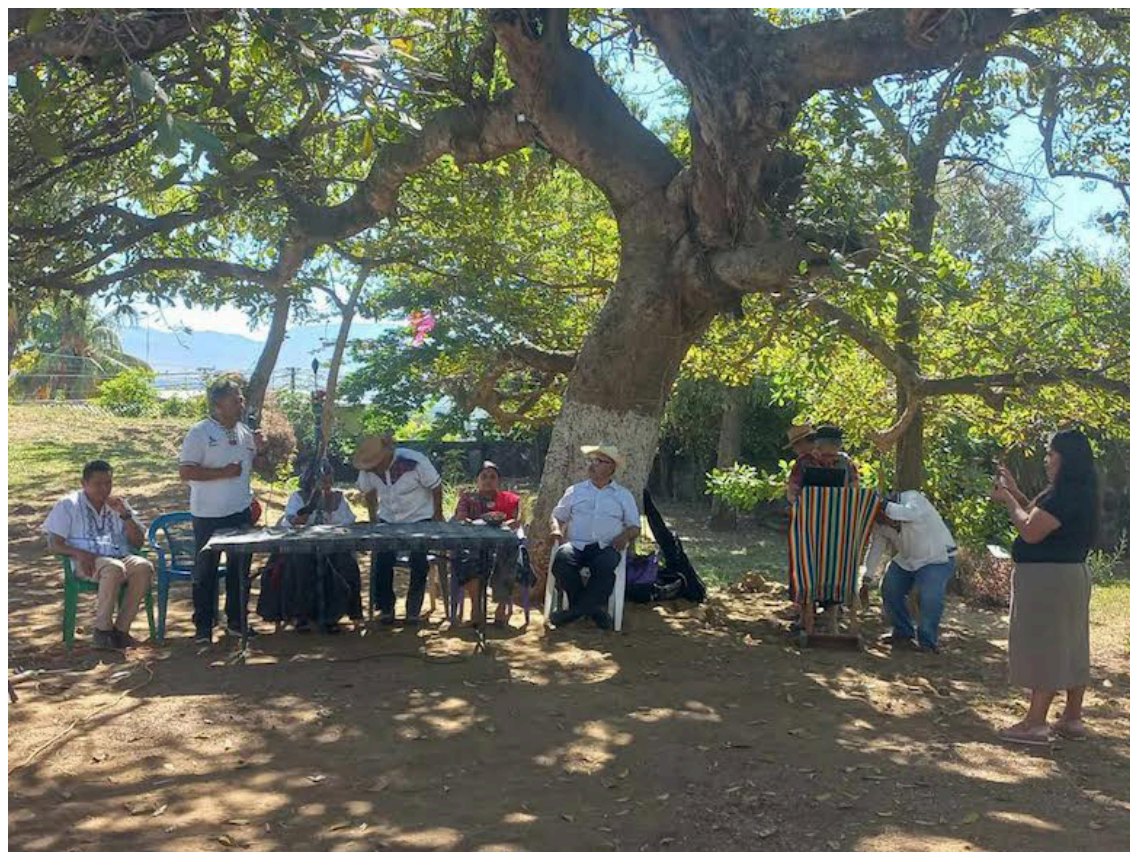
Este fin de semana, distintas organizaciones que trabajan en la defensa de los derechos de poblaciones indígenas, como el Consejo Ancestral de los Comunes de los Territorios Indígenas (CACTI), celebraron la tradicional ceremonia conmemorativa.

“Hace más de 20 años no se podía hablar del 32’ en