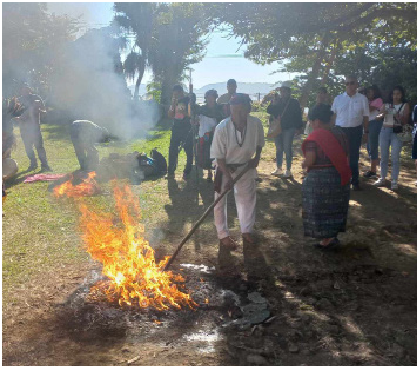
EL CONSEJO ANCESTRAL DE LOS COMUNES DE LOS TERRITORIOS INDÍGENAS (CACTI), CONMEMORA EL 92 ANIVERSARIO DE LA MASACRE INDÍGENA DE 1932, QUE DEJÓ MILES DE VÍCTIMAS INOCENTES. EN LA ACTIVIDAD SE REALIZA LA TRADICIONAL CEREMONIA DE CONMEMORACIÓN EN EL LLANITO, IZALCO, FOROS CON ACADÉMICOS, DEFENSORES DE DERECHOS HUMANOS, Y REPRESENTANTES DE POBLACIONES ORIGINARIAS, ENTRE OTROS.