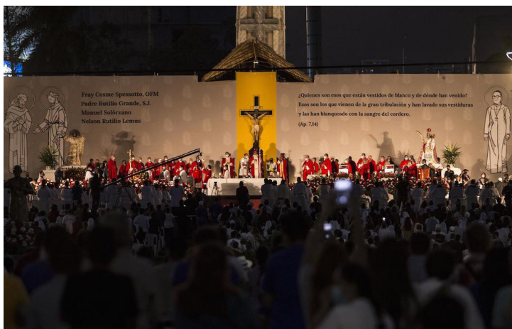
Hace un año fue la beatificación de los cuatro mártires, el 22 de enero de 2022, en la Plaza Divino Salvador del Mundo. Los beatos que fueron asesinados por odio a la fe, ahora son la gloria de la iglesia, un signo de inspiración de fe y liberación.