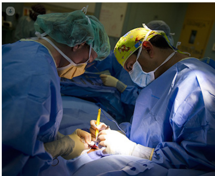
La Sala señala que la demandante alega que lleva dos años solicitando al ISSS que le realicen los estudios y la cirugía de trasplante que necesita, pero que las autoridades médicas han hecho caso omiso a sus requerimientos.

Entre las autoridades acusadas de dichas omisiones se encuentran la directora general y el Consejo Directivo del ISSS, el director y jefe de Trasplante Renal del Hospital Médico Quirúrgico de dicha institución. La Sala determinó que existe mérito para investigar una posible