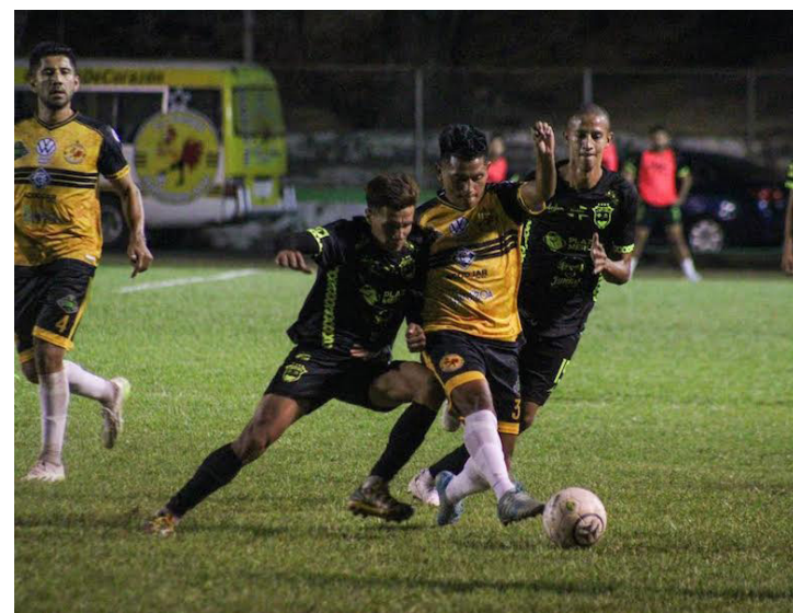
Los gallos vencen al cuadro colinero 0 a 1 en la segunda jornada del torneo clausura 2023 y continúan en la lucha por el descenso.