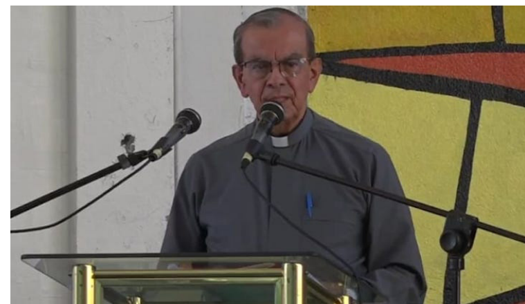
El cardenal Gregorio Rosa Chávez expresa que en el país, se avecina un futuro donde predomine un partido único o hegemónico, camino a una dictadura.

Rosa Chávez enfatizó que se quitó el Monumento a la Reconciliación de una manera brutal y con aplausos de mucha gente, lo cual fue una falta de respeto, porque en dicho monumento estaba la estatua de un soldado y una guerrillera abrazados, indicando que es posible reconciliarse.