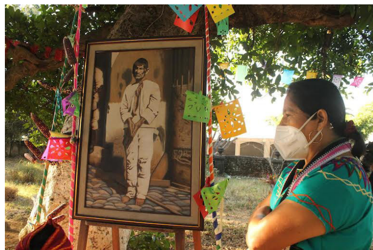
Los problemas sociales que sufre el país y principalmente las poblaciones indígenas son la pobreza, marginación, exclusión, entre otros FOTO DIARIO CO LATINO/IVÁN ESCOBAR.

"Al pueblo indígena, lastimosamente, nos tienen divididos. Eso se da y está vigente hoy en día, es algo a lo que nos tenemos que enfrentar diariamente, el objetivo es que no tengamos una sola voz como pueblo", considera Cortez Vázquez.