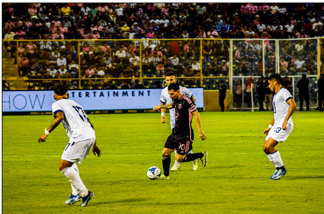
El campeón del mundo, Lionel Messi es marcado por tres jugadores de la Selecta.

miento, el nacional Darwin Ceren lo intentó desde la frontal, con un disparo que iba directo a la red; sin embargo, este quedó en las manos del arquero de las garzas, para dejar el marcador 0-0.