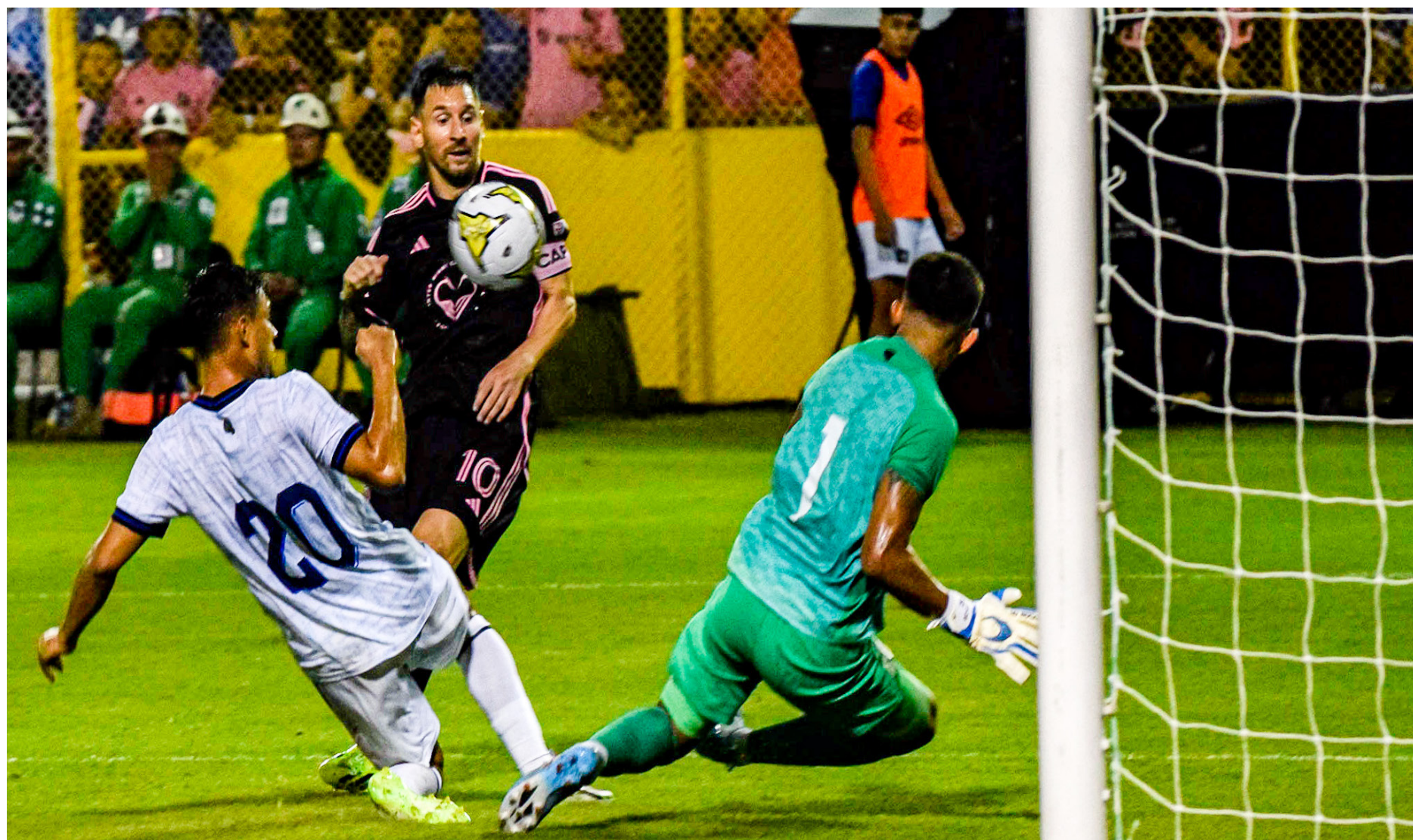
LIONEL MESSI, DEL INTER DE MIAMI, INTENTA ENCAJAR EL GOL EN LA PORTERÍA DE MARIO GONZÁLEZ, DE LA SELECTA, UNA DE LAS FIGURAS MÁS IMPORTANTES DEL PRIMER TIEMPO, EN EL ENCUENTRO AMISTOSO INTERNACIONAL ENTRE LA SELECCIÓN DE EL SALVADOR Y EL CLUB DE LA MAJOR LEAGUE SOCCER (MLS). EL MARCADOR SE QUEDÓ EN 0 A 0..