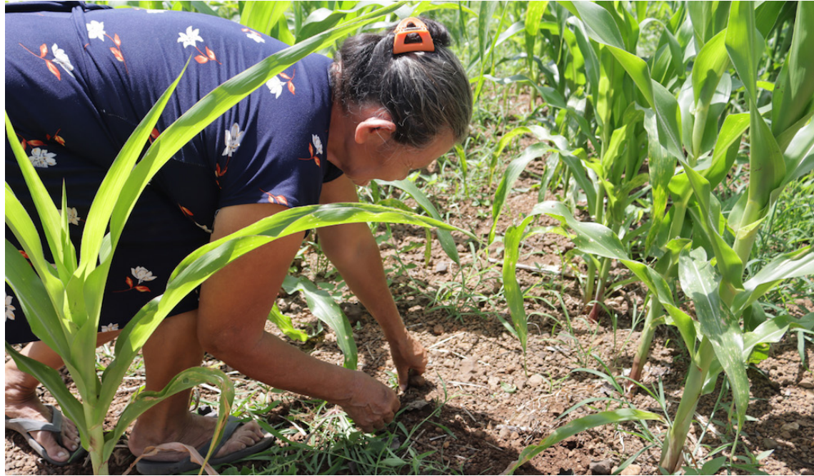
Las causas de estos procesos de despojo son por interés económico, por el lucro y la acumulación de bienes tan valiosos como es la tierra, y acumulación de Capital.

El estudio reseña que en 1846 se introdujo el cultivo de café, junto a una regulación para estimular su producción. En 1881, el presidente Rafael Zaldívar sancionó la “Ley de Extinción de Comunidades”, que afectó a más del 154 % de la tierra productiva del país. Y en 1882 sancionó una “Ley de Extinción de Ejidos”, que descalificó las tierras comu-