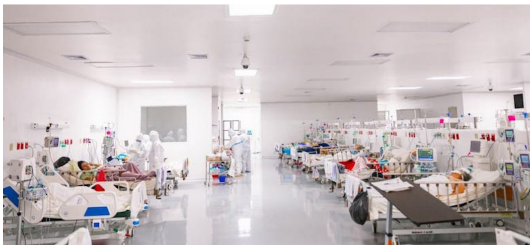
El Ministerio de Salud indica que a diario atienden aproximadamente 3,000 enfermedades respiratorias, de las cuales solo el 0.3% de los pacientes requieren ingreso hospitalario.

El titular de Salud dijo que los adultos mayores y personas