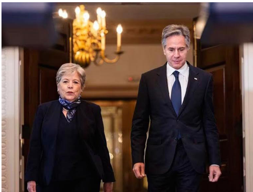
La canciller mexicana, Alicia Bárcena, y el secretario de Estado, Antony Blinken, encabezarán las delegaciones donde ambos países retoman conversaciones sobre crisis migratoria.

que más de dos millones de migrantes entraron a México el último año, la mayoría buscando llegar a Estados Unidos.