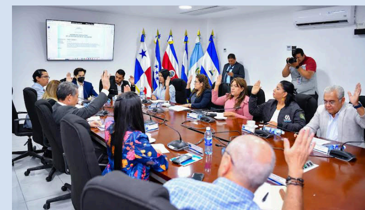
Comisión de Economía aprueba ampliar el periodo de inspecciones del MINEC para que tomen muestras, verifiquen pesos y documentación con el fin de que el producto sea de mejor calidad y a un precio justo.

Al sancionar las ilegalidades en los precios y distribución de estos productos se protegerá, según los legisladores, el bolsillo de todos los salvadoreños.