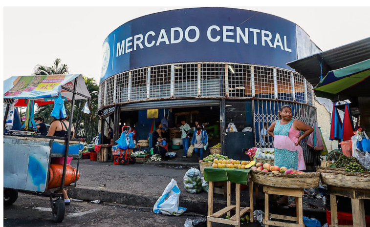
La capacidad adquisitiva de los salvadoreños se ve continuamente impactada, principalmente en los productos de la canasta básica.

Hay que añadir que al menos tres de los grupos alimentarios de la Canasta Rural tuvieron una variación de al menos $0.01 durante los 12 meses. El prime-