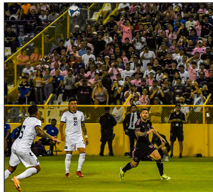
El jugador más esperado del Inter de Miami, Lionel Messi, juega en el estadio Cuscatlán. Un hecho histórico.

Finalizaron los 90+3', y así, concluyó también uno de los partidos que quedará grabado en la memoria de muchos, cargado de emociones desde el momento en que Messi llegó a El Salvador, hasta el momento en que se despidió saludando a los aficionados salvadoreños, quienes demostraron ser devotos de un jugador que ha revolucionado la historia del deporte y lo hará hasta el día que decida poner fin a su carrera.