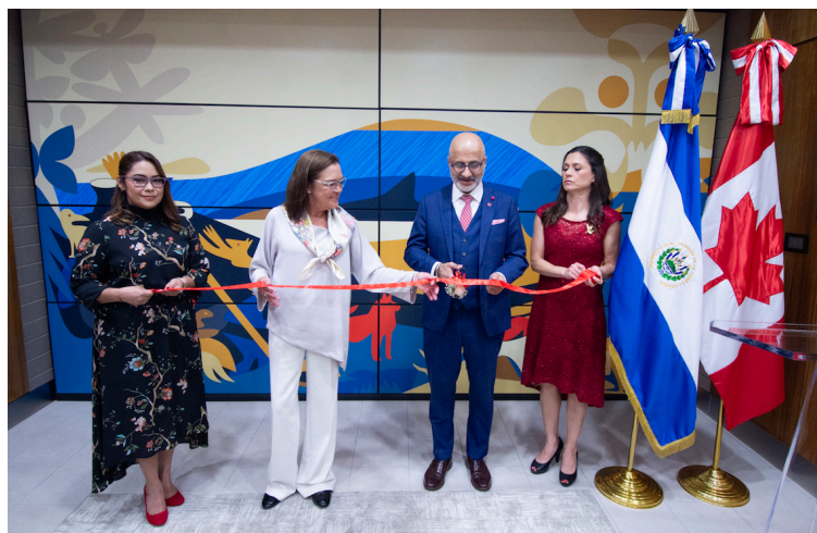
La embajada de Canadá inaugura las oficinas en El Salvador, con lo cual, fortalece los lazos de cooperación que inició en 1961.

Con la inauguración de las nuevas oficinas en el país, la Embajada de Canadá fortalece los lazos diplomáticos con El Salvador, que destina el 95 % de su cooperación a la promoción de los derechos de las niñas, adolescentes y mujeres en condiciones de vulnerabilidad, lo que representa anualmente más de $15 millones.