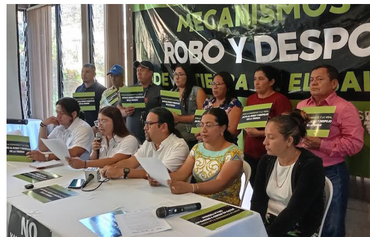
Las organizaciones ECOS El Salvador, ACUA, Foro del Agua y las Cooperativas por la Defensa de la Tierra, presentan un estudio sobre los diferentes procesos de concentración de la tierra que vive El Salvador.

“Lastimosamente, la campesina y el campesino han sufrido por siglos, y esas mismas familias siempre se han lucrado del trabajo de la población rural y les han quitado sus tierras. En la actualidad el descaro ha llegado a tal nivel que les mienten a los y las campesinas induciendo a cometer errores con deudas, hipotecas y contratos de