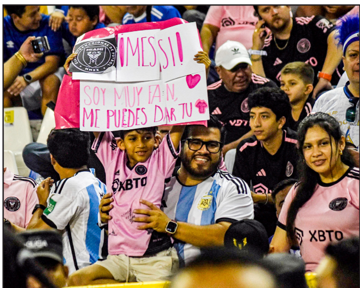
Los salvadoreños muestran pancartas con apoyos hacia Messi.