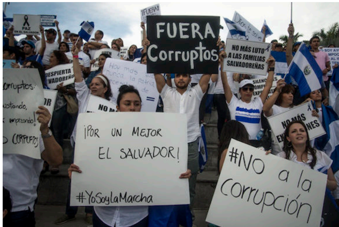
Organizaciones sociales sin fines de lucro (OSFL), demandan del Estado salvadoreño la correcta aplicación de las recomendaciones del Grupo de Acción Financiera de Latinoamérica (GAFILAT), que previene el lavado de dinero, el financiamiento del terrorismo y la proliferación de armas de destrucción masiva.

Asimismo, advirtieron la “discusión y aprobación de una Ley Especial para la Prevención, Control y Sanción