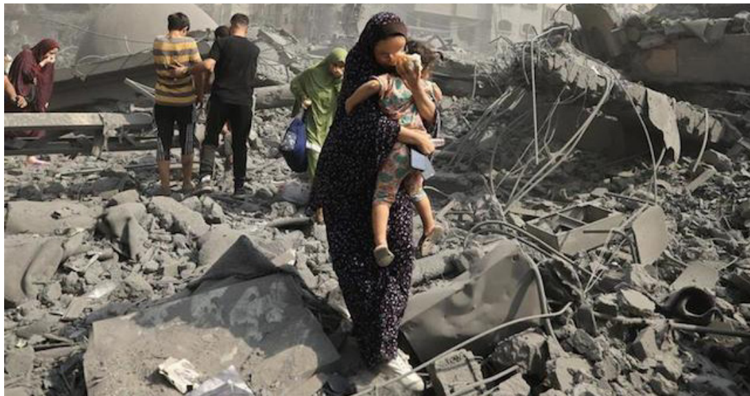
La crisis humanitaria sin precedentes que somete a la población de Gaza a una hambruna inminente es continuación de un proceso de genocidio de larga data, advirtió hoy un informe elaborado por relatores de la ONU. (Prensa Latina)