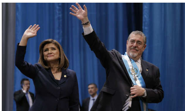
Presidente de Guatemala, Bernardo Arévalo, junto a vicepresidenta Katin Herrera.

Al ser consultado sobre la derogación del acuerdo de Ale-