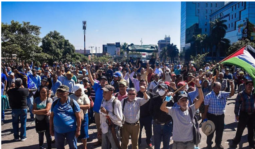
Veteranos y excombatientes aseguran que el compromiso del Estado, es cumplir todos los beneficios establecidos por la Ley.

trucción de un hospital especializado para veteranos y excombatientes. Castillo afirmó que existe un compromiso del Estado en reconocer una pensión digna para todos los lidiados de guerra, además del compromiso en cumplir todos los beneficios estipulados por la ley de veteranos de guerra.