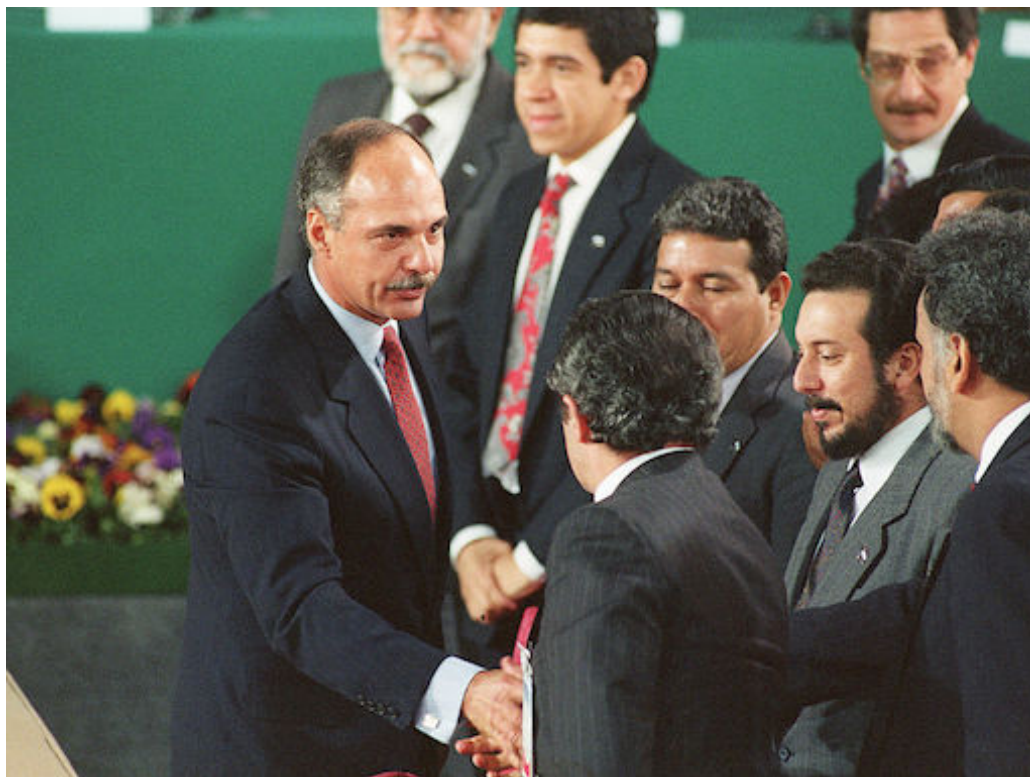
La Fundación de Estudios para la Aplicación del Derecho (FESPAD), reconoce el impacto positivo para la democracia la firma de los Acuerdos de Paz, en 1992.

En el marco de la conmemoración de la firma de los Acuerdos de Paz, la Fundación de Estudios para la Aplicación del Derecho (FESPAD) emitió un pronunciamiento público sobre el impacto positivo de esta fecha histórica para el país.