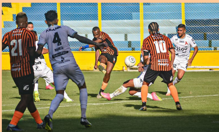
Águila con un empate como antecedente y Alianza con una derrota, protagonizarán uno de los encuentros más importantes de la fase regular del Clausura.

La segunda fecha del Clausura dará inicio este sábado 20, a las 3 de la tarde, con el encuentro entre Jocoro y Dragón, dos equipos que vienen de una