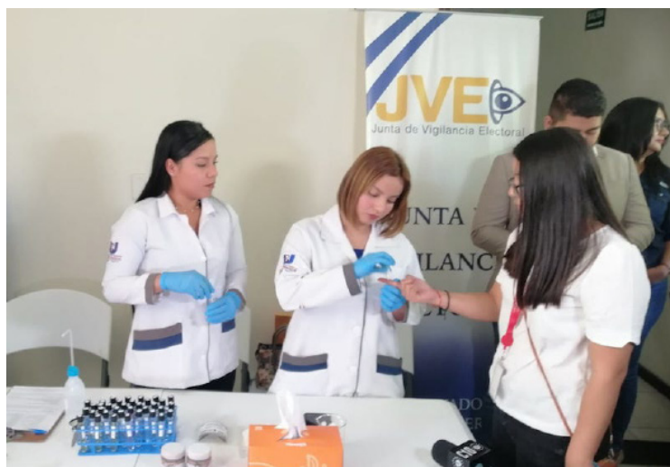
La Junta de Vigilancia Electoral (JVE) verifica con varios tipos de químicos, la tinta a utilizar en las elecciones de este año.

Dijo que la tinta a utilizar en estas elecciones no tiene diferencia a la de eventos anteriores, a los dos minutos comienza a marcar el color y según pasa el tiempo se ve más. Una vez aplicada la tinta se debe esperar dos minutos para que se impregne y genera una especie de tatuaje temporal