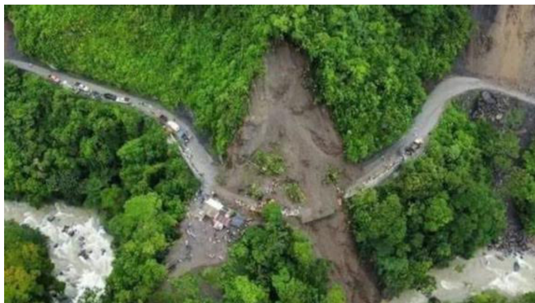
El alud arrasó además con una vivienda donde más de 50 personas, entre ellos niños y bebés, se habían refugiado ante el mal clima.