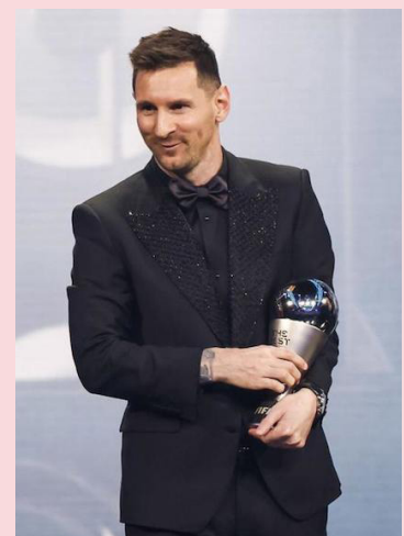
El actual campeón del mundo, Lionel Messi, gana su tercer premio The Best, como el mejor jugador de la temporada.

El centrocampista del Botafogo-SP, Guilherme Madruga, fue consagrado con el premio Puskas de la temporada gracias al magistral remate de chilena desde fuera del área; el premio Fair Play fue para la selección de Brasil y, en la categoría femenina, Aitana Bonmatí (centrocampista del F.C. Barcelo-