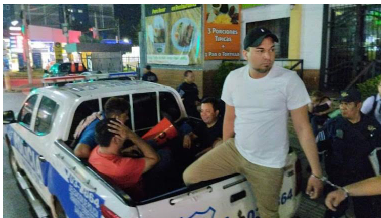
El VMT reporta un incremento del 49% en personas detenidas por conducción peligrosa, y 200% más que las multadas en los primeros días de 2023.

lir a detener conductores, sino crear un cambio de cultura, garantizar seguridad vial y reducir los indicadores de siniestralidad. Es un trabajo día a día porque lamentablemente hay personas quienes normalizan conductas de riesgo, como conducir bajo los efectos del al-