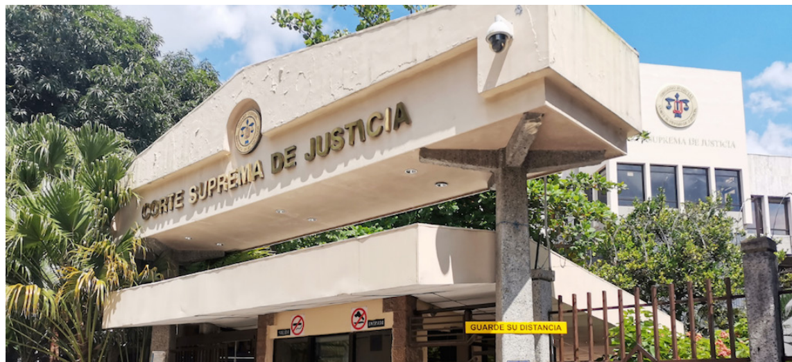
La Sala de lo Constitucional ha negado hábeas corpus a los familiares de los capturados durante el régimen de excepción.