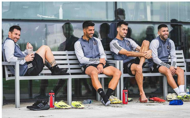
Lionel Messi, Luis Suárez, Sergio Busquets y Jordi Alba, forman parte del plantel del Inter de Miami que jugará contra la selección en el Cuscatlán este viernes.

Inició la cuenta regresiva para el esperado encuentro entre la Selecta y el Inter de Miami, este viernes 19, a las 7:00 p.m. en el estadio Cuscatlán, un encuentro “histórico” en el que estarán presentes tres campeones del mundo y una de las figuras más importantes en la historia del deporte más famoso a escala mundial, Lionel Messi.