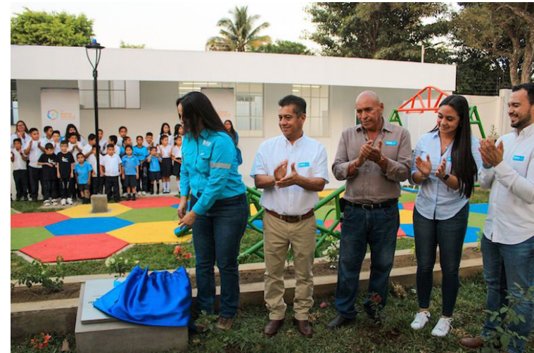
Los candidatos a diputados de Nuevas Ideas junto a la DOM inauguran un proyecto en Santa Ana.

Las elecciones están a la vuelta de la esquina; las elecciones pre-