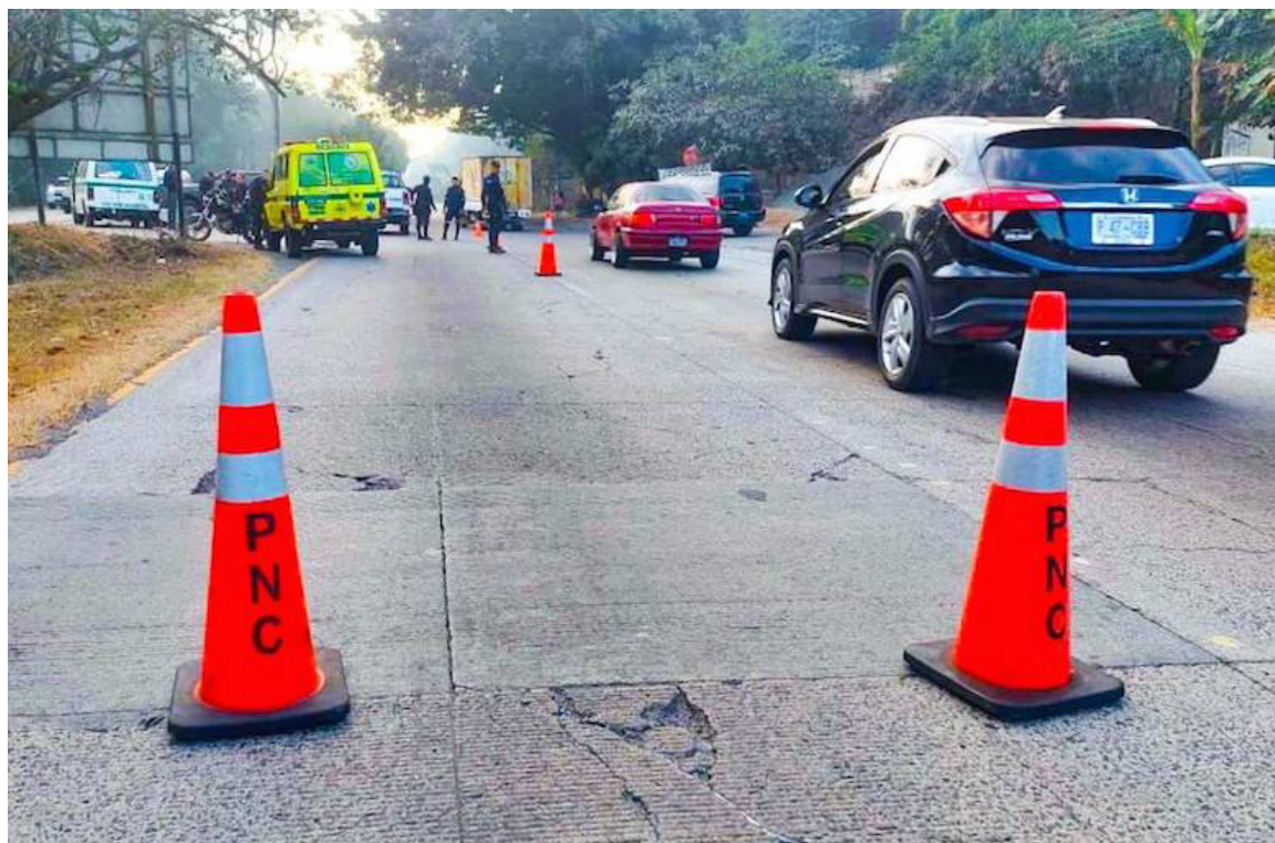
Un agente de la PNC falleció luego de ser impactado por un vehículo, cuando se conducía en su motocicleta en el kilómetro 34 de la carretera que de Santa Ana conduce a San Salvador, cantón Zapotitán, Ciudad Arce.