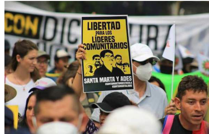
El documento presentado por la delegación es acompañado por ACAFREMIN y la Mesa Nacional Frente a la Minería Metálica de El Salvador, que han acompañado la lucha por la liberación de los líderes ambientalistas.

“Esto significa que darían 5 días más para presentar alguna observación, sería entonces el 11 de febrero que podría presentarse el dictamen de acusación fiscal o incluso una petición de sobreseimiento. Y