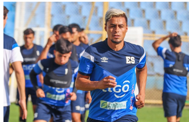
La selección nacional se enfrentará al Inter de Miami de Messi este viernes 19 de enero en el estadio Cuscatlán, en un partido para la historia.

La selección nacional tuvo esta semana su primer acercamiento con el técnico español, de 42 años de edad, Dóniga, como parte de los preparativos previo al encuentro contra el club rosa, en el cual se pudo notar el trabajo del cuerpo técnico con el equipo en el estadio