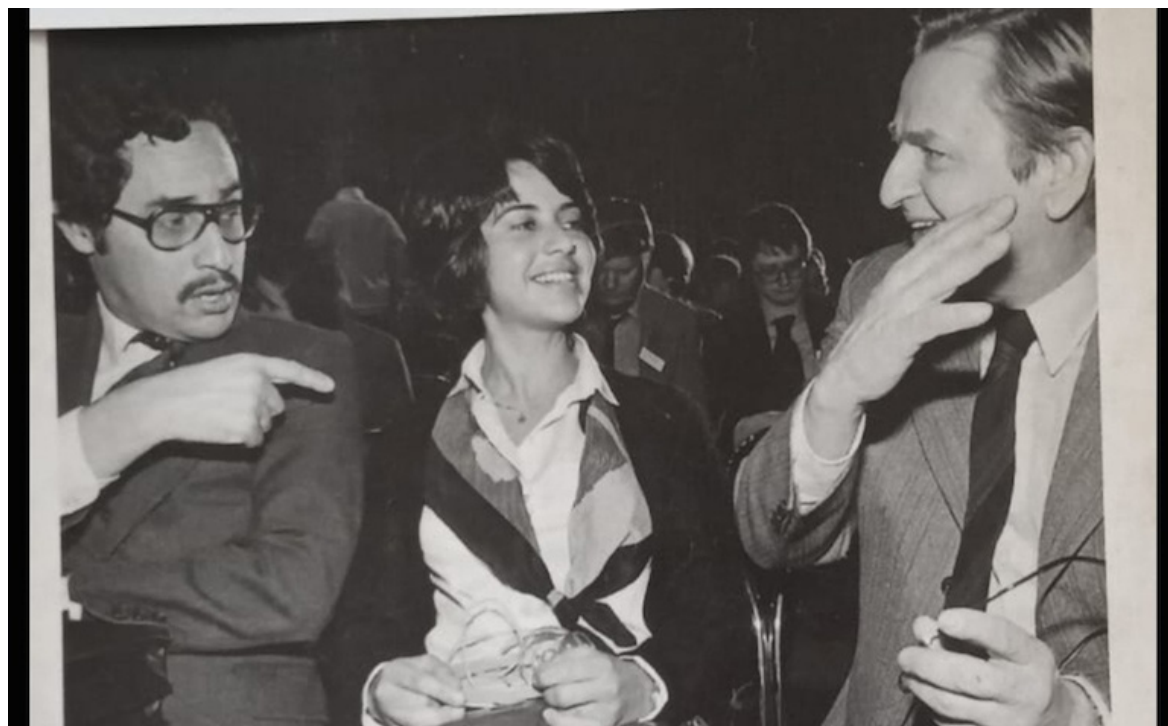
Los equipos de Primera División darán inicio al Clausura 2024 este fin de semana.