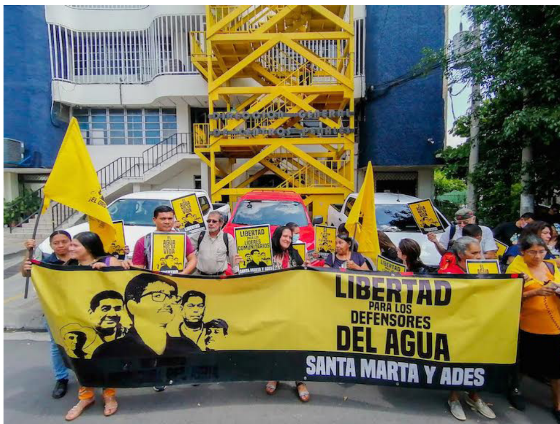
La población de la Comunidad Santa Marta y líderes de ADES, reiteran la petición de libertad de sus compañeros y declaran que el caso se trata de una persecución judicial ilegal contra sus líderes comunitarios.