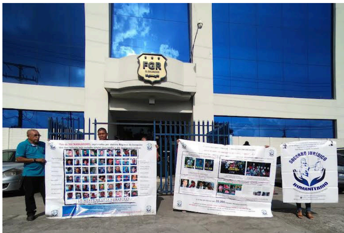
Socorro Jurídico Humanitario presenta aviso y una denuncia ante la Fiscalía General de la República (FGR) en contra de funcionarios y del Estado salvadoreño por crímenes de lesa humanidad perpetrados contra de personas inocentes privadas de libertad en centros penales.

Ingrid Escobar añadió que el Estado salvadoreño comete crímenes de lesa humanidad en centros penales como Mariona, Izalco, Apanteos, Quezaltepeque y la Granja de Zacatecoluca, así como en bartolinas. “No ha habido en ninguno de estos 21 meses de régimen de excepción un solo fallecido procesado en el CECOT (Centro de Confina-