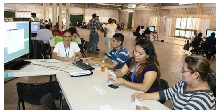
El TSE notifica que está habilitado el sitio web donde la población puede verificar si forman parte de los 102 mil salvadoreños seleccionados, para integrar JRV en las próximas elecciones.

El magistrado Wellman destacó el funcionamiento del voto remoto por internet, hasta la fecha ya emitieron el sufragio más de 60 mil salvadoreños residentes en el exterior con dirección del extranjero en su DUI, lo cual significa más del 8% del total de 741,094 salvadoreños habilitados para ejercer su derecho al sufragio bajo esa