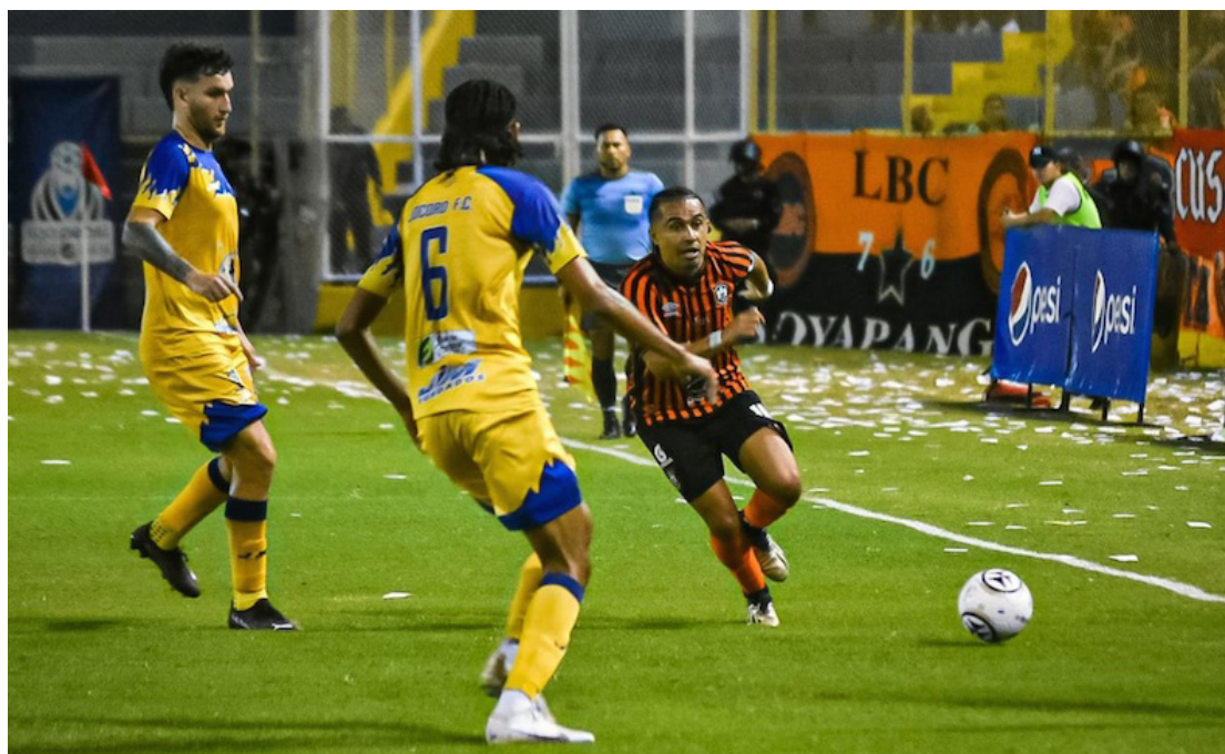
Los equipos de Primera División darán inicio al Clausura 2024 este fin de semana.

El segundo encuentro de la noche será el derbi santaneco, con el choque entre los tigres y los jaguares, en el estadio Óscar Quiteño, lugar donde "el rey de copas" buscará debutar con un buen resultado, pero, Isidro Metapán también está dispuesto a dar pelea para sacar un buen resultado. Los precios