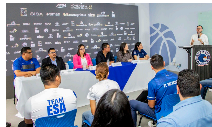
La Fundación Educando a un Salvadoreño (FESA) detalla el XXXIV edición Homenaje a las estrellas del deporte en la cual se premiará a 71 figuras del deporte.

Finalmente, el partido entre Alianza y 11 Deportivo, que corresponde a la primera fecha, se desarrollará en el estadio Ana Mercedes Campos, en Sonsonate, a las 6:00 p.m. En primera instancia estaba programado para ser disputado en el estadio Cuscatlán el 14 de febrero, pero, se movió al mismo fin de semana.