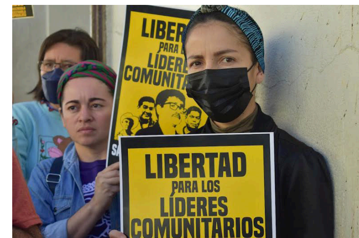
La captura de los ambientalistas ha generado la movilización social, por parte de la comunidad Santa Marta, y de las organizaciones sociales y populares de El Salvador, así como renocidas organizaciones internacionales.