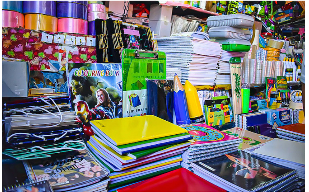
Según vendedores de útiles escolares en San Salvador, las ventas están disminuidas debido a los gastos realizados por festividades de fin de año; no obstante, anticipan un aumento significativo después de la primera quincena de enero.

El precio de los lápices y lapiceros se mantiene a $0.20 y $0.25, el del papel para forrar transparente $0.50, el paquetes