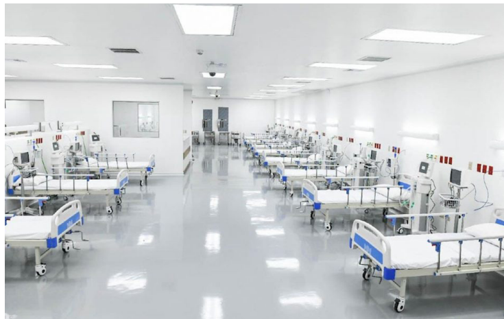
La Organización Panamericana de la Salud (OPS), recomienda a los Estados miembro a contribuir en fortalecer la calidad de la atención de la salud pública.

Sobre la atención sanitaria de calidad, el organismo de salud considera diversas acciones, no obstante, afirmó que existe un creciente reconocimiento que