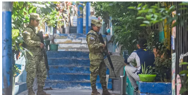
Efectivos militares brindan seguridad ciudadana, trabajo de la Policía Nacional Civil.

“Si bien son innegables los cambios y los resultados que se han obtenido en cuanto a la reducción de homicidios y la percepción generalizada de un cambio en la seguridad ciudadana, al final, esto se ha convertido en el punto más importante de campaña de este gobierno y es una herramienta de promoción, cómo también para amena-