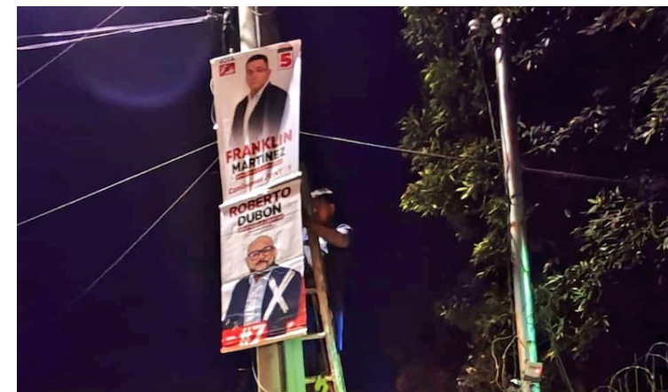
La propaganda de los partidos VAMOS y FMLN fue retirada por la alcaldía de Santa Tecla. Los empleados se transportaban en un vehículo placas N-9569.

En la televisión, bajo la autoría de Gobierno de El Salvador, se transmite un spot referente a crímenes de pandilla, con los audios de las familiares de las víctimas, pero el mismo termina con una pregunta referente a que “si se quiere que se regrese a ese pasado”. El mensaje es claro que favorece la estrategia de campaña electoral del candidato a la presidencia y de sus candidatos a diputados.