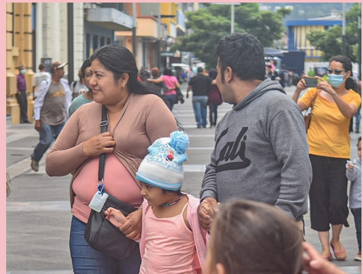
El Ministerio de Medio Ambiente pronostica para el 13 y 21 de enero, la incursión de vientos nortes y disminución de la temperatura, especialmente durante la madrugada.

Al cierre de 2023 Medio Ambiente registró un déficit de lluvia a escala nacional del 7.6%, que equivale a 145 milímetros menos del promedio nacional anual. En lo que va de enero, no se han registrado lluvias.