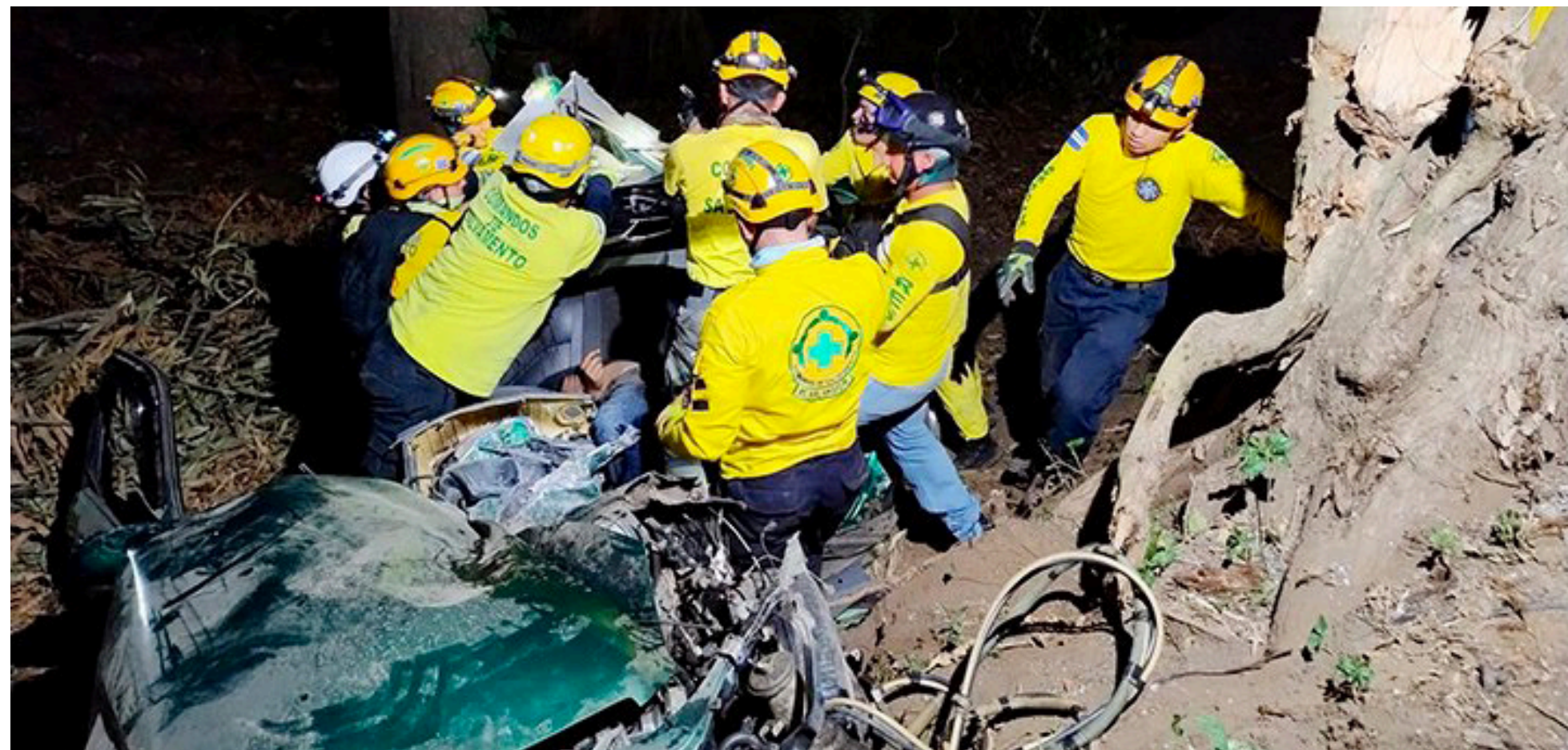
LOS ACCIDENTES VIALES HAN DEJADO POR LO MENOS 10 MUERTES, EN LO QUE VA DE 2024. SEGÚN EL FONDO SE LA ATENCIÓN A LAS VÍCTIMAS DE ACCIDENTES DE TRÁNSITO (FONAT), LAS CAUSAS DE ESTOS HECHOS ESTÁN RELACIONADA, EN SU MAYORÍA, A LA IRRESPONSABILIDAD DE LOS CONDUCTORES, QUE MANEJAN EN ESTADO DE EBRIEDAD, A ALTA VELOCIDAD, USANDO EL TELÉFONO U OTRA DISTRACCIÓN.