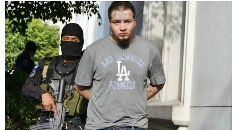
Para agilizar la extradición activa se faculta al juez a solicitar la difusión internacional de la captura del imputado prófugo y se refuerza el rol de la Fiscalía General de la República como autoridad central para tramitar las solicitudes.

En cuanto al procedimiento, se establecen plazos para la presentación de la solicitud formal tras la detención preventiva (arts. 502-L al 502-Q); se de-