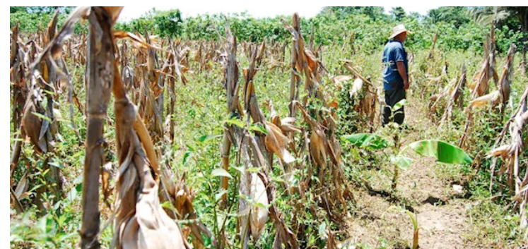
La Encuesta Nacional de Seguridad Alimentaria del Programa Mundial de Alimentos (PMA) de junio de 2023 estima que poco más de 1 millón de personas sufren de inseguridad alimentaria moderada a severa.

En ese contexto, la comunidad humanitaria busca asistir a 506.214 personas vulnerables, aproximadamente el 45% de la población en necesidad. Para alcanzar esto, el Plan de Respuesta Humanitaria (HRP) 2024 requiere de $87 millones. El número de personas en necesidad para 2024 ha aumentado ligeramente desde 2023, principalmente debido a las condiciones de sequía causadas por “El Niño” y la creciente necesidad de servicios de pro-