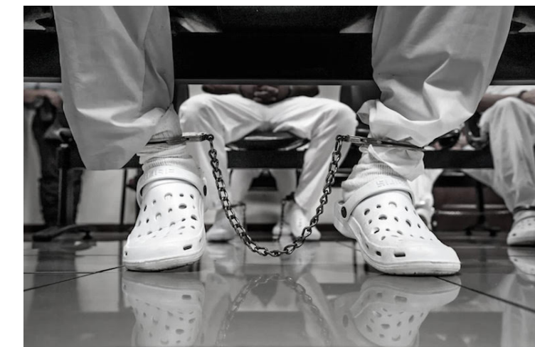
Por lo menos 10 pandilleros de la MS-13 fueron condenados por FGR hasta por 699 años.