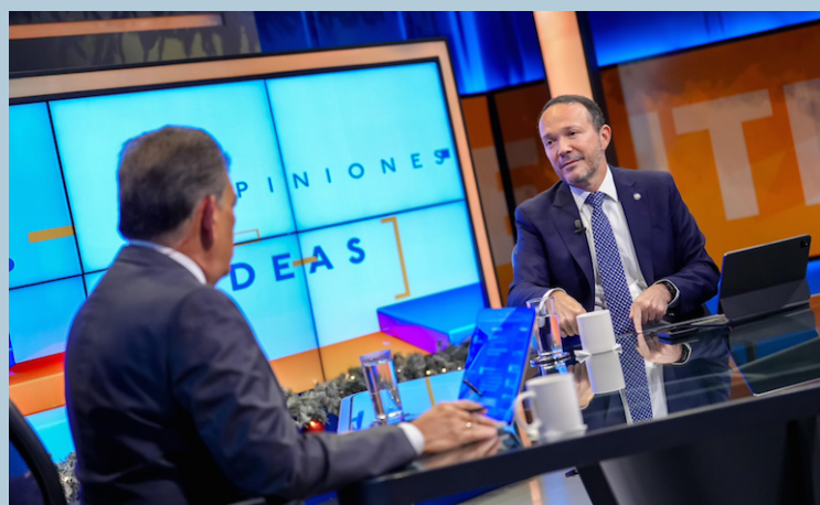
El ministro de Justicia y Seguridad Pública, Gustavo Villatoro dijo que este año presentará otra serie de reformas, no relacionadas específicamente el tema de pandilla.

nario se dieron luego que expusiera las reformas que han permitido la disminución del accionar delincencial. Dichas reformas iniciaron con la implementación del régimen de excepción el 27 de