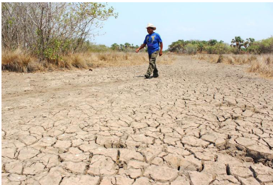
El Centro Salvadoreño señaló que el clima cambia aceleradamente y amenaza a la humanidad al no garantizar la continuidad de la vida, ya que el 2023 fue el año más caliente históricamente.

De acuerdo a la organización, “la Asamblea Legislativa parece no haber tomado nota de este problema, ya que recientemente legisló para que la Comisión Ejecutiva Hidroeléctrica del Río Lempa (CEL) realizara investigaciones para encontrar petróleo con fines a explo-