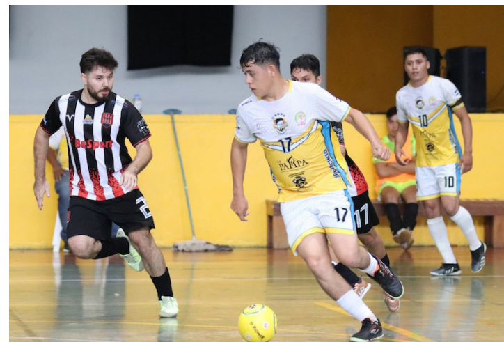
Los partidos de la Liga Mayor Fútbol Sala del país serán transmitidos por la aplicación Aloud Sport desde este 6 de enero.

enero, los equipos retomarán la primera vuelta del torneo y disputarán los siguientes duelos: Cosmos vs San Salvador, Cuscatlán vs Canarios, Soyapango