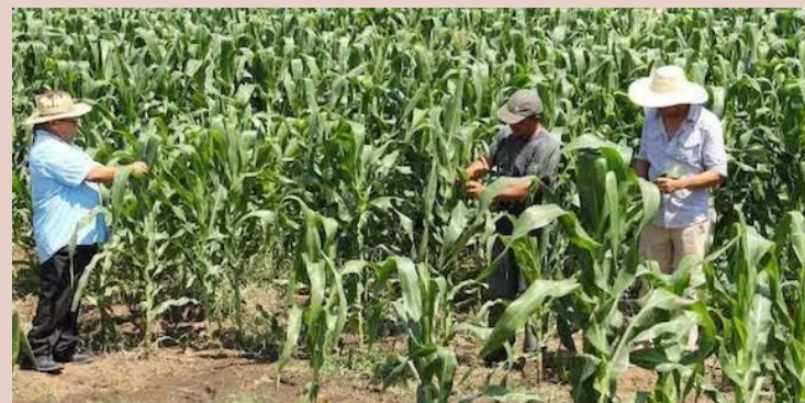
CAMPO presenta proyecciones claves para el ciclo agrícola 2023-2024 en El Salvador y pide al gobierno revitalizar la agricultura y garantizar la seguridad alimentaria.