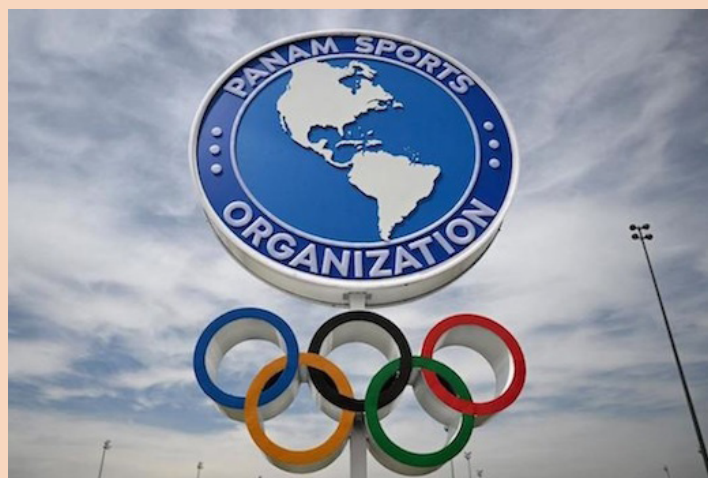
A Colombia le es retirada la sede de los Juegos Panamericanos 2027, debido al incumplimiento del contrato económico, en el cual no se cubrió la primera cuota con la organización del evento deportivo.

De acuerdo a medios internacionales, el Gobierno perdió la sede porque no cumplió con