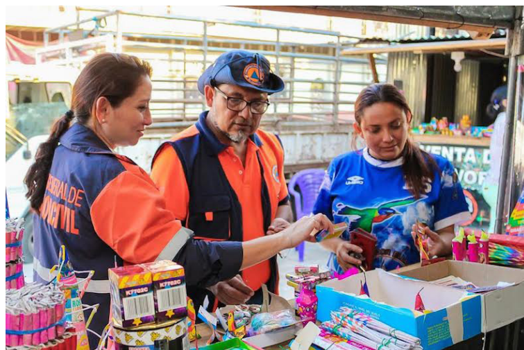
De acuerdo al director del Cuerpo de Bomberos, Baltazar Solano, el 65% de las personas lesionadas con pólvora son adultos.

De acuerdo a los datos emitidos por las diferentes autoridades, ocho personas menos resultaron lesionadas a causa del uso de pirotecnia en 2023. Según las estadísticas, entre el 6 y el 31 de diciembre, que se contrastan con 2022, la cifra fue de 222, y en esta ocasión se registraron 214.