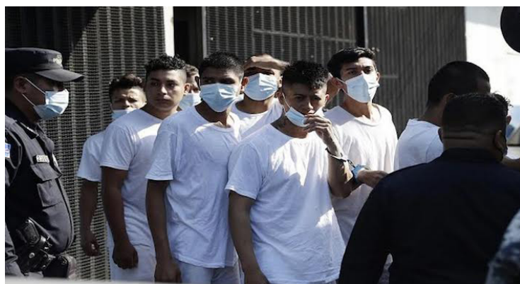
Ya han transcurrido 21 meses, desde la vigencia del Régimen de Excepción de Garantías Constitucionales.

El Gabinete de Seguridad de la Presidencia de la República el año 2023 cerró con 194 homicidios confirmados, dato que define una contracción del 59.8% respecto a los 483 homi-