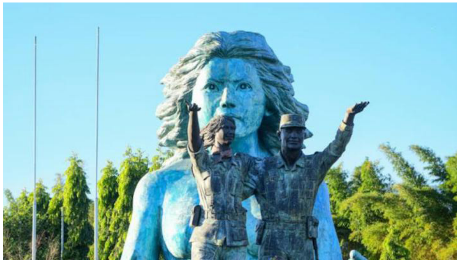
Monumento a la Reconciliación Nacional, inaugurado en 2017, con motivo del 25 aniversario de la firma de los Acuerdos de Paz.

Gabriela Sandoval @Gabriela_Sxndo Colaboradora