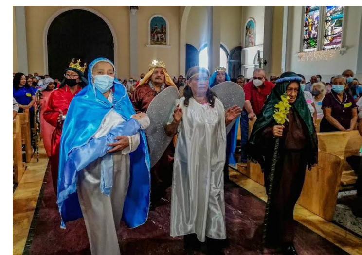
FUSATE presenta la programación de eventos en reconocimiento a las personas de la tercera edad, todo como parte de las actividades del Mes de la Persona Adulta Mayor.

Solano también recordó que en 2023 hubo 12 casos más de incendios en vehículos al registrar 50 en su totalidad en contraste a los 38 que hubo en el 2023.