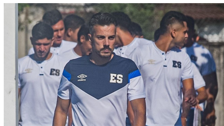
Revelan que el ex técnico de la selección nacional, Rubén de la Barrera, tenía pláticas con otros clubes desde noviembre.