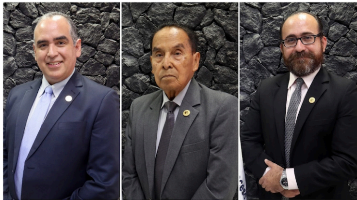
Ricardo Gómez, Andrés Gregori Rodríguez y Gerardo Guerrero, comisionados del Instituto de Acceso a la Información Pública (IAIP) han sido incluidos en la Lista Engel por bloquear información pública.

El Departamento de Estado de los Estados Unidos informó que tres comisionados del Instituto de Acceso a la Información Pública han sido añadidos a la Lista Engel “por socavar los procesos o instituciones democráticas al bloquear a propósito e injustamente el acceso a la información pública”.