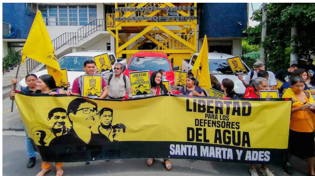
Organizaciones junto a Aliados Internacionales y diferentes asociaciones, de académicos y abogados para firmar una “Carta Abierta” al Fiscal General de la República, para que deje libres a los cinco ambientalistas de Cabañas.