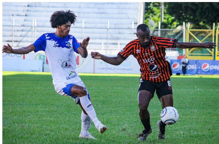
Águila y Jocoro protagonizarán una final inédita en la historia del fútbol salvadoreño, para darle un nuevo campeón al deporte rey de los salvadoreños.

Águila fue un equipo que se mantuvo entre las primeras posiciones de la fase regular, y finalizó como líder del torneo con 44 unidades en total, dos menos de diferencia de FAS, que alcanzó la segunda posición, pero fue eliminado en cuartos de final por Dragón. El equipo de Corti alcanzó 13 victorias, empató