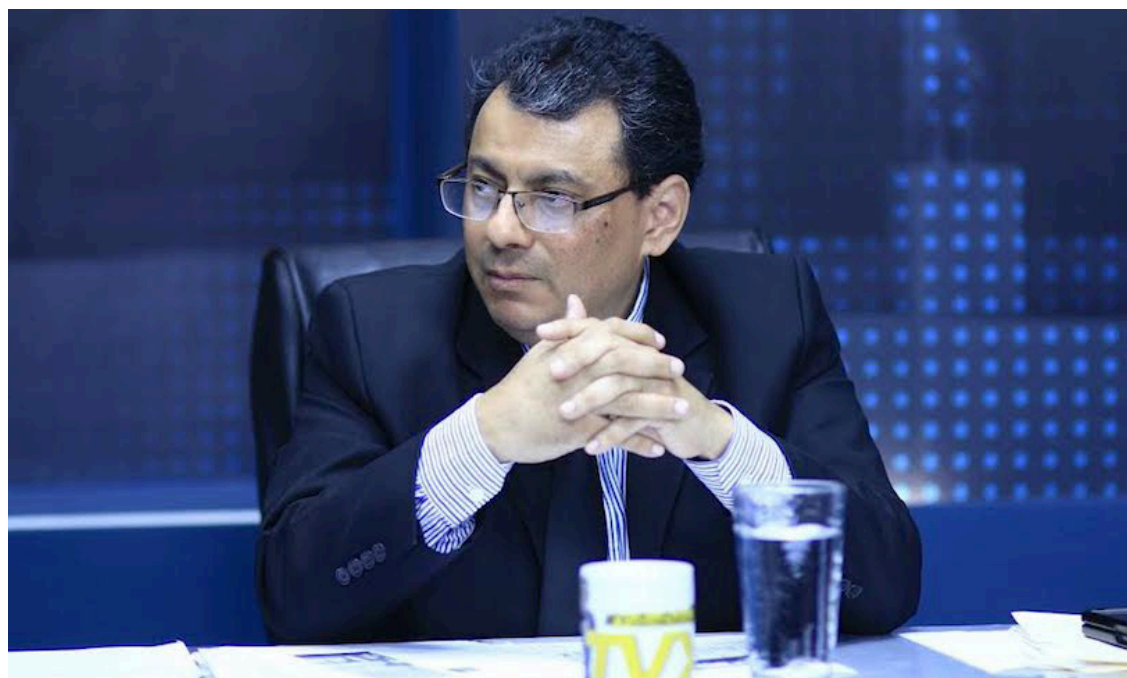
El magistrado del TSE, Julio Olivo, dice que de no existir esa disposición penal hubiese votado en contra de la inscripción a la presidencia de Nayib Bukele.

Por primera vez se probó transmitir actas, en el extranjero serán 81 centros de votación, Estados Unidos tiene concentrado casi 80% de los lugares donde los salvadoreños acudirán a emitir el su-