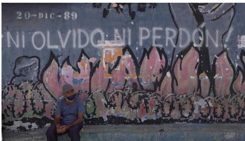
Un residente descansa frente a un mural alusivo a la invasión de Estados Unidos a Panamá de 1989 en el barrio de El Chorrillo, uno de los principales puntos destruidos durante la invasión, en la Ciudad de Panamá, la capital panameña, el 25 de marzo de 2022.