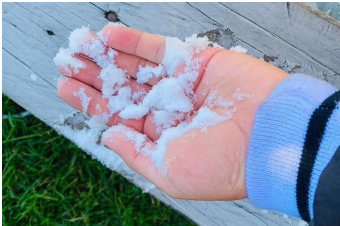
Las bajas temperaturas en el país provocaron escarcha de hielo en la cima de El Pital, que en un momento alcanzó los 0° C. .