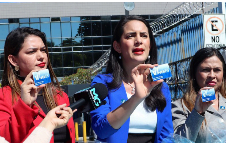
VAMOS propone un programa anual para subsidiar los alimentos para familias en pobreza extrema.