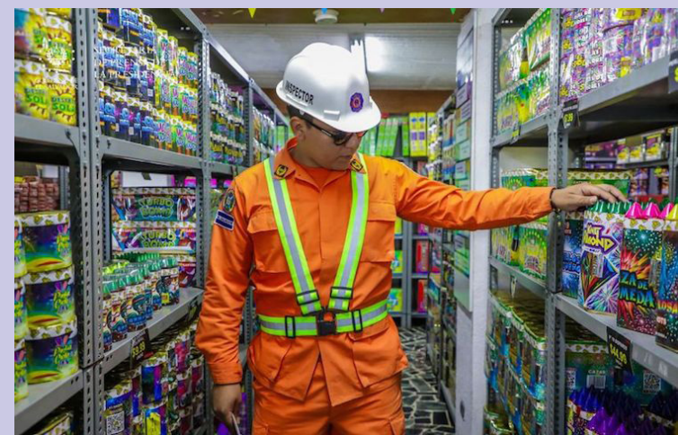
Protección Civil mantiene una inspección en las salas de venta de productos pirotécnicos, donde se revisa la documentación, la existencia de extintores, rutas de evacuación y sistemas de alerta en caso de incendios.

La pólvora era elaborada y manipulada sin un procedimiento de seguridad, poniendo en riesgo a los habitantes de la zona, al no poseer los permisos correspondientes.