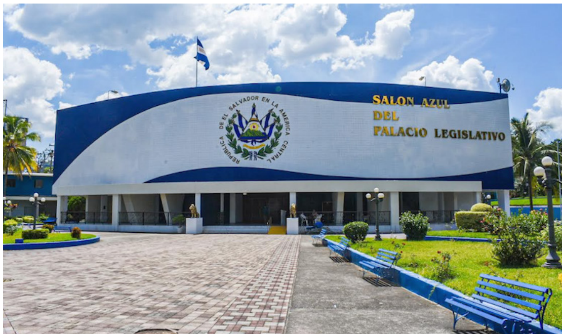
Asamblea Legislativa tendrá un presupuesto de $54.1 millones para el próximo año.

Estas dos iniciativas deben aprobarse este miércoles en la sesión plenaria ordinaria, previo a la votación del Presupuesto General de la Nación.