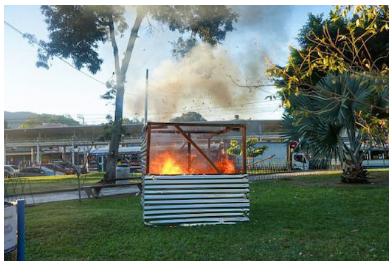
La alcaldía capitalina desarrolló en el parque Centenario, un simulacro de incendio estructural, con múltiples víctimas lesionadas y puestos de ventas afectados. FOTO DIARIO CO LATINO/@ALCALDIA_SS.

En la capital han habilitado ocho puntos de ventas en los seis distritos, que funcionarán desde el 11 de diciembre de este año hasta el 3 de enero de 2024; entre ellos está, Redondel Ba-