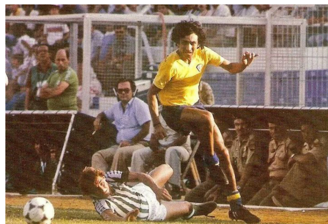
El Instituto Nacional de los Deportes de El Salvador (INDES) mantiene pláticas directas con el Cádiz Club de Fútbol para el amistoso entre el CD FAS y el equipo español.

“El Mágico” González, cómo fue apodado el salvadoreño por