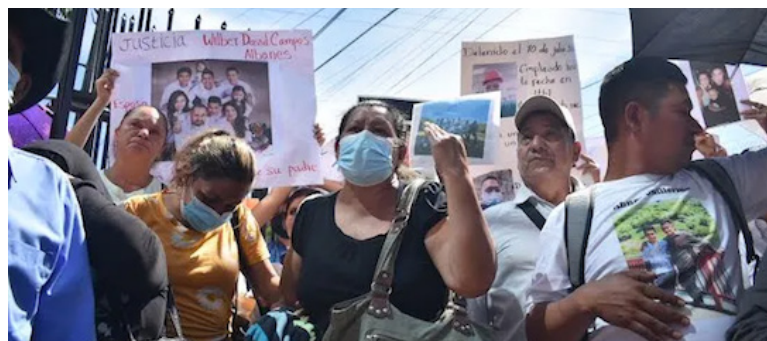
El régimen de excepción ha dejado a miles de personas inocentes capturadas.

Anabel Bellosó, diputada del Frente Farabundo Martí para la Liberación Nacional (FMLN), in-