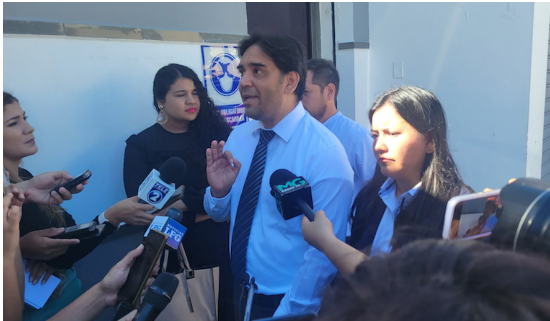
APES sostiene que la Ley de Reparación Moral es explícita cuando se trata del ejercicio periodístico: no es procedente. Por ello, consideran que se está sentando un precedente “muy peligroso” para la libertad de prensa».