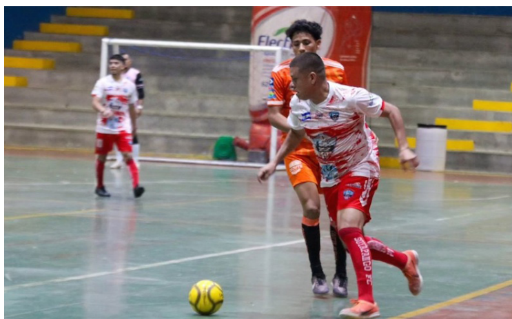
El torneo de Fútbol Sala, en la Primera División, lleva a cabo la primera jornada del torneo tras su regreso.

Este jueves dio inicio la liga de Fútbol Sala con el desarrollo de la primera jornada del torneo y con ello volvieron las emociones del futsal, que regresa luego del parón que vivió el deporte. Soyapango FC y Be Sport Club fueron los más destacados al cerrar el primer encuentro con goleada a Cojutepeque y a CD San Salvador, respectivamente. El equipo soyapaneco no tuvo piedad del combinado de cojute, y sentenció la primera victoria con goleada de 11-3, partido efectuado en el Multigimnasio Don Bosco. Los visitantes no tuvieron mayor oportunidad para buscar el resultado y en esa ocasión iniciaron la primera