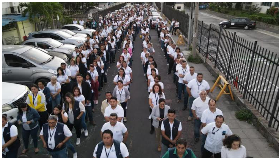
Ministerio de Trabajo desplegará a partir de este 12 de diciembre, a más de 700 inspectores para garantizar la entrega de aguinaldos a los trabajadores.

Semanas atrás, la Asamblea Legislativa aprobó disposiciones especiales y transitorias para exonerar de renta a los aguinaldos inferiores a $1500.