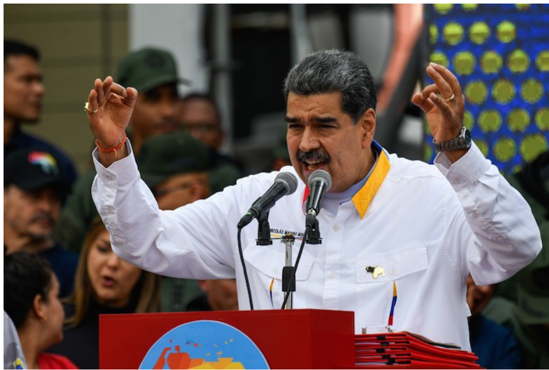
Imagen del 8 de diciembre de 2023 del presidente venezolano, Nicolás Maduro

mó su asistencia a través de una misiva difundida este lunes en su cuenta de X y dirigida al primer ministro de San Vicente y las Granadinas, Ralph Gonsal-