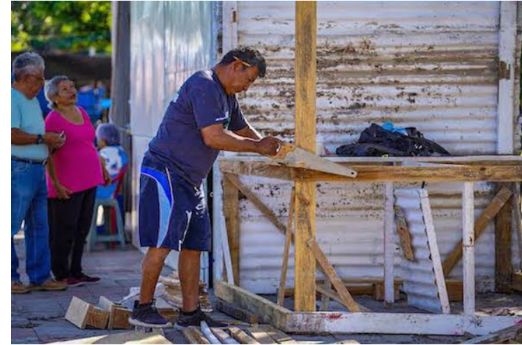
Vendedores de pólvora instalan sus puestos en el parque Centenario, uno de los ocho lugares autorizados por la comuna capitalina para el comercio de pirotécnicos.

La comuna autorizó 175 puestos para la venta de pirotécnicos, y ha instruido en materia de prevención de siniestros a cerca de 350 comerciantes, quienes también se capacitaron en temas sobre la correcta manipulación de estos productos, por parte de la Policía Nacional Civil (PNC), a fin que la población tenga la confianza de comprar pólvora en los puntos de