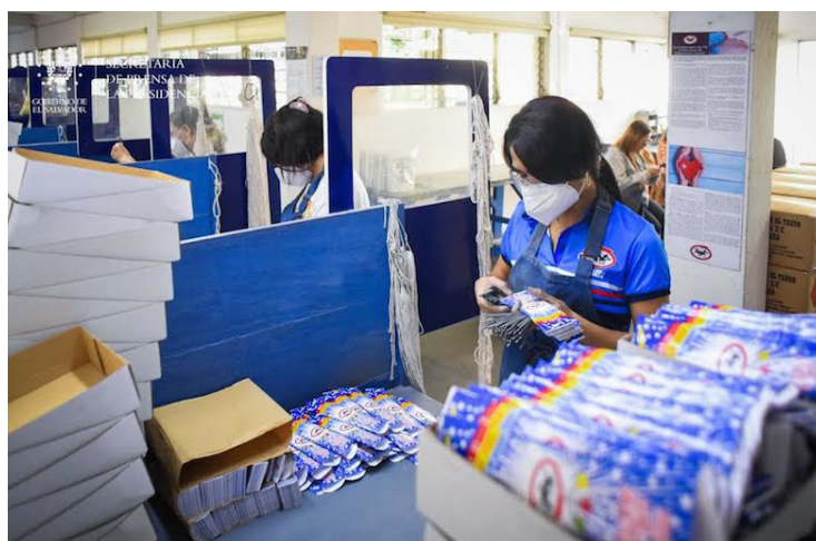
Se verifican las coheterías y salas de venta de pólvora, que cuentan con sistema de detección de incendios, señales de emergencia y documentos en regla.