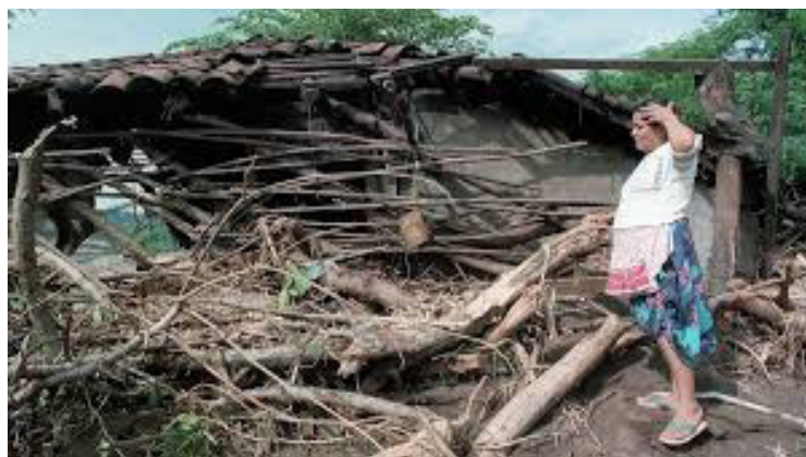
Integrantes de la MPGR, presentan el documento “Reseña actual de El Salvador en Materia de Riesgo Post Mitch+25, experiencias y conocimientos sobre la prevención frente a los desastres climáticos que afectan al país.

En esa línea, Cortez consideró que El Salvador debe tomar una “decisión contundente y de manera ur-