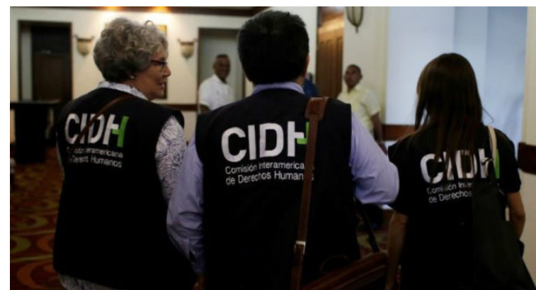
La democracia, el Estado de Derecho y los derechos humanos son interdependientes y se constituyen en elementos esenciales para alcanzar la paz, estabilidad y desarrollo en la región, afirma la CIDH en el marco del Día de los Derechos Humanos.

“Asimismo, requiere un juicio ante una autoridad competente, independiente e imparcial garantizando en todo momento el derecho de defensa. En este espíritu, la Comisión Interamericana celebra el día, instando a los Estados a redoblar sus esfuerzos en la consoli-