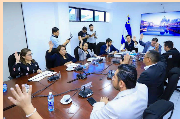
La Comisión de Hacienda emite dictamen favorable para incorporar $296 millones a diferentes instituciones del Estado.