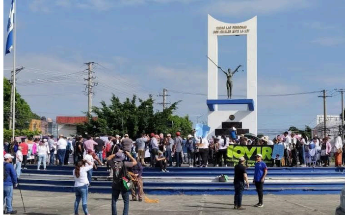
MOVIR pide la liberación de sus familiares detenidos injustamente en el régimen de excepción. Sin embargo, la PNC obstaculizó la libertad de movimiento.