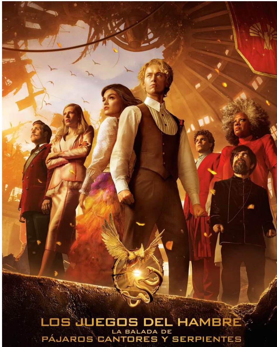
LOS JUEGOS DEL HAMBRE LA BALADA DE PÁJAROS CANTORES Y SERPIENTES