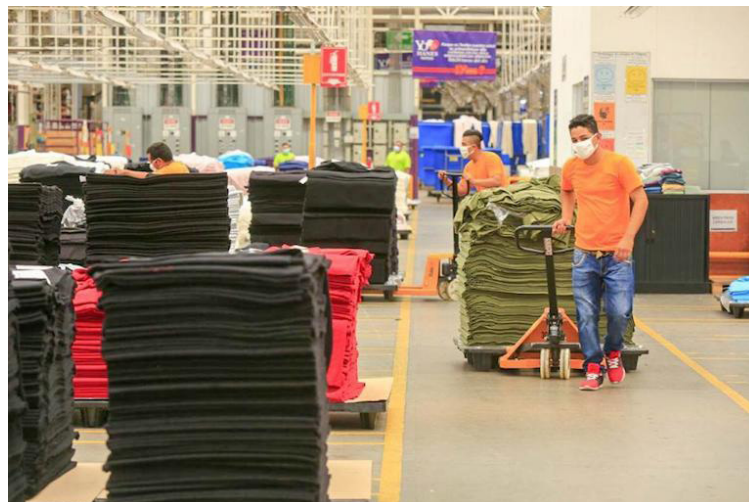
Al menos 1,500 trabajadores se verán afectados debido al cierre de una planta de una fábrica de ropa deportiva.

HanesBrands por una década ha sido la compañía que más ha