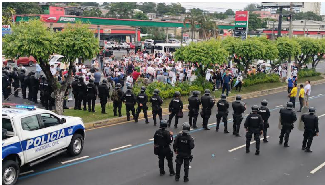
Un pelotón de agentes de la UMO impide el paso de los familiares de víctimas del régimen de excepción.

a la gala final de Miss Universo, un evento que el coordinador de MOVIR cataloga como «un show» para evitar los temas más sensibles del país, como la violación a los derechos humanos en El Salvador.