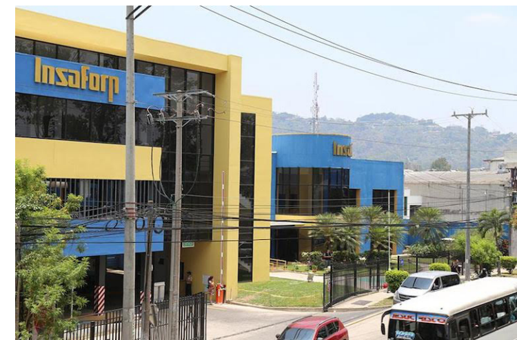
INSAFORP será disuelto y los trabajadores se encuentran en una incertidumbre debido a que no podrán negociar con sus Contratos colectivos.