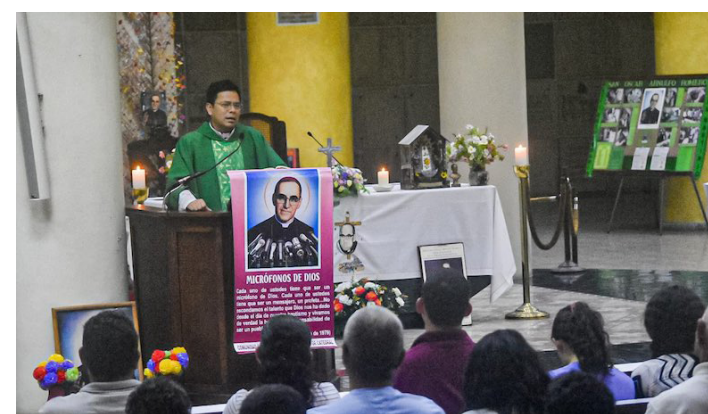
Padre Hernández dice Monseñor Romero es conocido en todas partes del mundo.