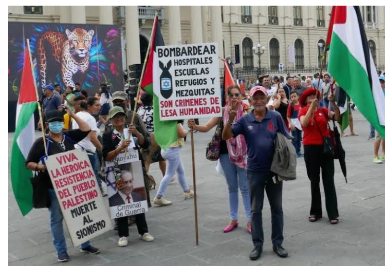
El pasado fin de semana se ondearon banderas palestinas, en el Centro de San Salvador.

pueblo, a las 4 p.m. en la Plaza Palestina, en la Colonia San Benito de San Salvador, paralela a Calle El Mirador.