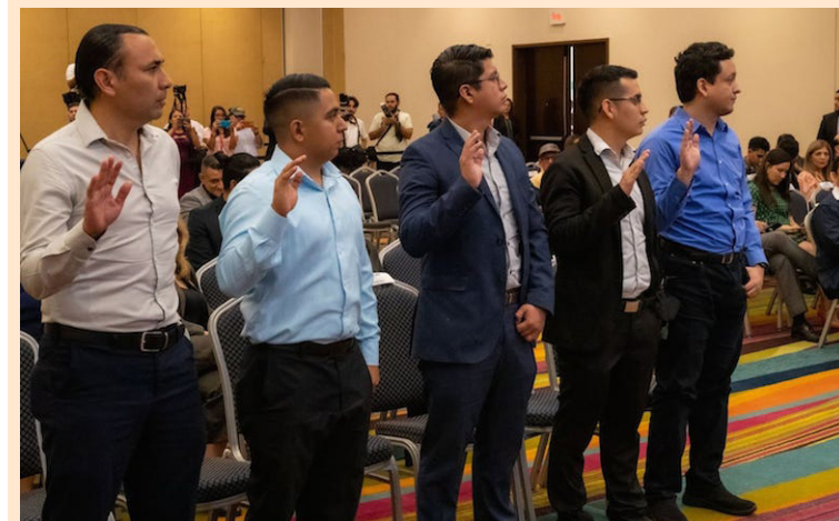
Los integrantes de la Junta Electoral del Voto en el Extranjero (JELVEX), fueron juramentados y recibieron sus credenciales, para verificar el correcto funcionamiento de los equipos informáticos del voto electrónico.

De acuerdo a las estadísticas del RNPN, hay un total de 906,462 DUIs aptos para votar desde el exterior, de estos, 739,925 poseen dirección en el extranjero y 166,537 con dirección nacional.