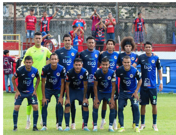
El FAS se convierte en el segundo equipo clasificado a los cuartos de final del Apertura 2023, al vencer a Firpo 0-2 en Usulután.

unidades, FAS (37), Alianza (30), Firpo (30), Jocoro (28), Once Deportivo (23), Municipal Limeño (22), Platense (10) y Santa Tecla (9).