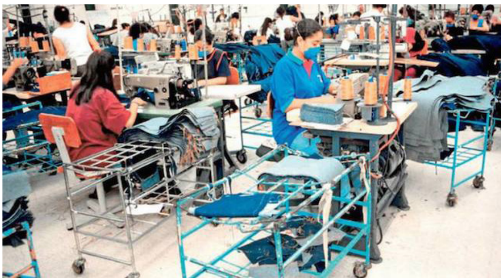
La Asociación Mujeres Transformando, presenta el Informe Mujeres en la Maquila Textil: Cuerpos, Vidas y Resistencias”, que aborda la temática de la defensa y vigencia de los derechos humanos y laborales de las mujeres en el sector textil.

“Porque al ser cuerpos maquiladores, implica que no van a tener ni el tiempo ni energía ni capacidad o