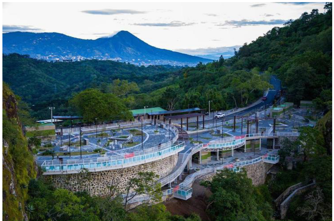
El evento Miss Universo ha mejorado destinos turísticos como la Puerta del Diablo, afirma la Ministra de Turismo Morena Valdez.

La ministra agregó que “ha sido admirable lo que se ha conseguido, las jóvenes representantes han logrado también postear y dar una imagen del país de todo lo que se ha hecho”. Ya que las 87 representantes de diferentes países han conocido los diferentes destinos turísticos del país y lo han difundido en sus redes sociales, por lo que han logrado mostrar a El