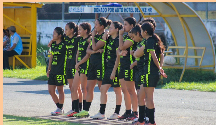
Jugadoras de Santa Tecla se niegan a disputar el partido ante Platense, por la fecha 10 del Apertura, debido a la deuda salarial de la junta directiva.

Hay que recordar que Santa Tecla es el actual campeón del torneo Apertura 2022, ganador en aquel entonces del torneo con un cuadro sólido de jugadoras, que según comunicó el equipo dejaron el club por la irregularidad salarial que han tenido.