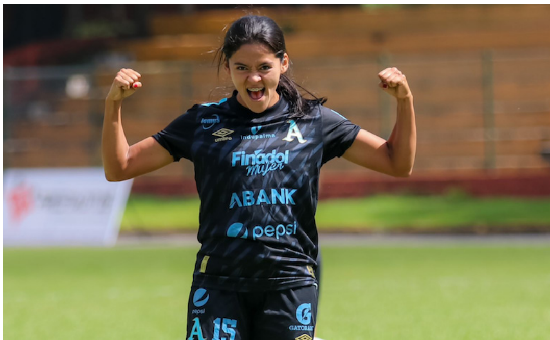
Con garra, la Liga Femenina se dirige a los cuartos de final del Apertura 2023, donde los equipos darán pelea por un puesto en las semifinales.