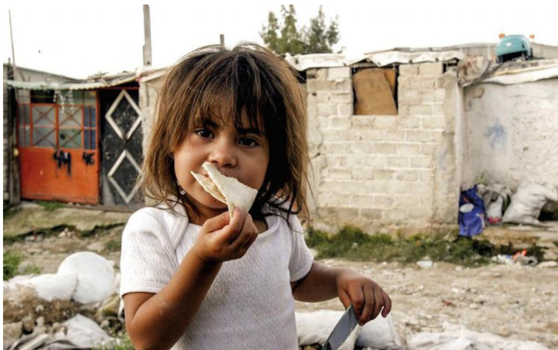
El reciente informe de Naciones Unidas (ONU), señala que 43, 2 millones de personas sufren hambre en América Latina y el Caribe para este año 2023. Y que la inseguridad alimentaria continúa en aumento.

Mientras, en el Caribe, el informe advierte que en esta subregión el escenario es diferente, en donde 7,2 millones de personas experimentaron hambre en 2022, con una prevalencia de 16,3%, en compa-