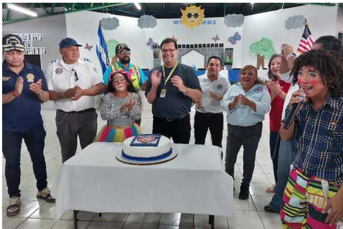
Los compromisos con los cuales nació, hace 12 años, la Asociación de Voluntarios Veteranos de El Salvador se mantienen y ahora tratar de ayudar a sus socios.

Los integrantes de la Asociación estaban felices y emocionados, “nosotros comenzamos con esto, las primeras pláticas en 2010, pero en 2011 nos comenzamos a formar haciendo nuestro primer evento, que fue el 10 de