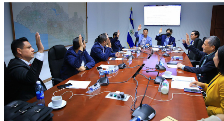
Los diputados votan a favor de la Ley del Instituto Nacional de Capacitación y Formación, INCAF, con el que se busca preparar técnica y profesionalmente a salvadoreños.

sar Reyes, recordó que la actual administración de INSAFORP ha logrado una capacitación y formación de un promedio de 200 mil salvadoreños por año, “algo que no se garantiza al disolver esta institución y mermar los recursos destinados”.