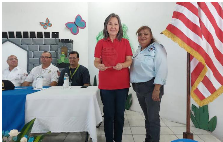
En la celebración se contó con la visita de una delegación de la Academia Mundial de Bomberos, (Worldwide Academy Firefighter Inc. WAF) y hubo bailes tradicionales.