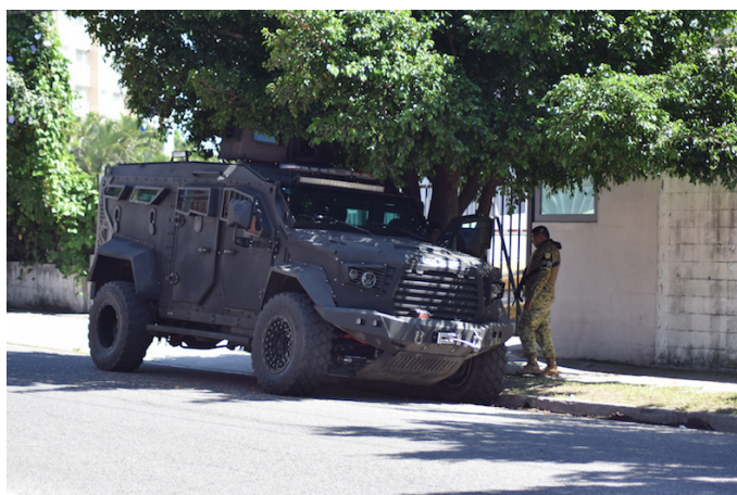
Maquinaria blindada de la Fuerza Armada de El Salvador ubicada en las afueras del Hotel Real Intercontinental presta vigilancia, previo al certamen de Miss Universo.

La presencia de carros blindados pertenecientes a las fuerzas armadas destaca mayormente en los alrededores, junto con pocos elementos de la PNC, pero abundantes soldados. Sin embargo, la presencia de la