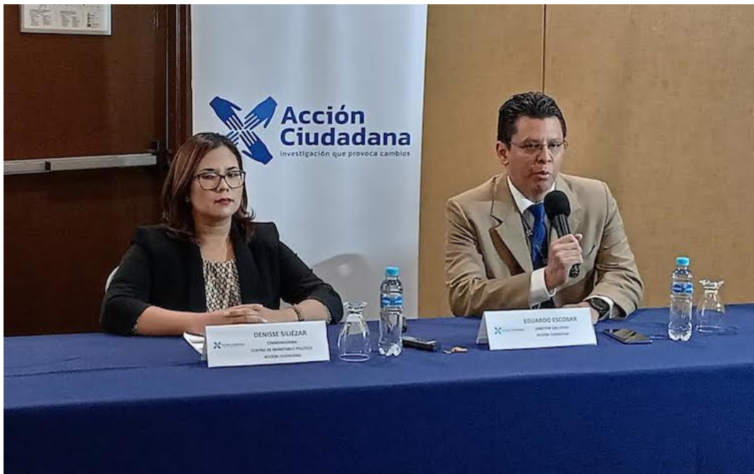
Acción Ciudadana, presenta su Tercer Monitoreo de: Propaganda Elecciones 2024, que cubre los meses de agosto, septiembre y octubre, sobre el proceso electoral que realiza el Centro de Monitoreo Político de la A.C.