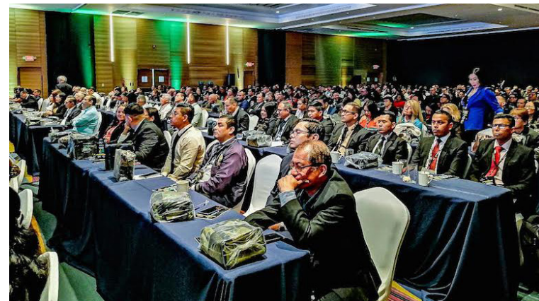
Más de 500 líderes cooperativistas se reúnen en la XV Conferencia Internacional para escuchar las ponencias de líderes internacionales sobre temas de digitalización de servicios.

Córdova aseguró que en las conferencias se adentran en la resiliencia digital, la inteligencia ar-