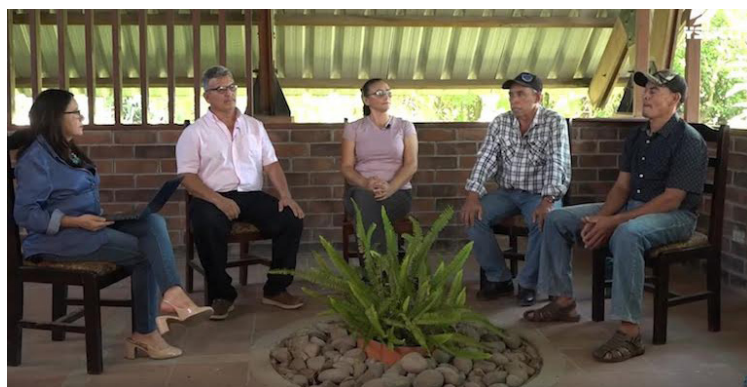
Representantes de las comunidades cercanas al penal de Tecoluca, San Vicente, afirman que los ríos de la zona son contaminados por los desechos del Centro de Confinamiento del Terrorismo (CECOT).

“Hay una gran carga hídrica alrededor de estas comunidades y comienzan a hacer la contaminación en los ríos, de tal manera