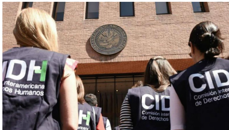
La Comisión Interamericana de Derechos Humanos (CIDH) publica informe del “Cierre del Espacio Cívico de Nicaragua” por lo que llama a su pronto restablecimiento y garantizar derechos humanos de la población.