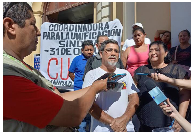
La CUS- 31 2023, entrega una carta al arzobispo de San Salvador, José Luis Escobar Alas, para que se pronuncie por los derechos humanos y laborales de la clase trabajadora en el país.