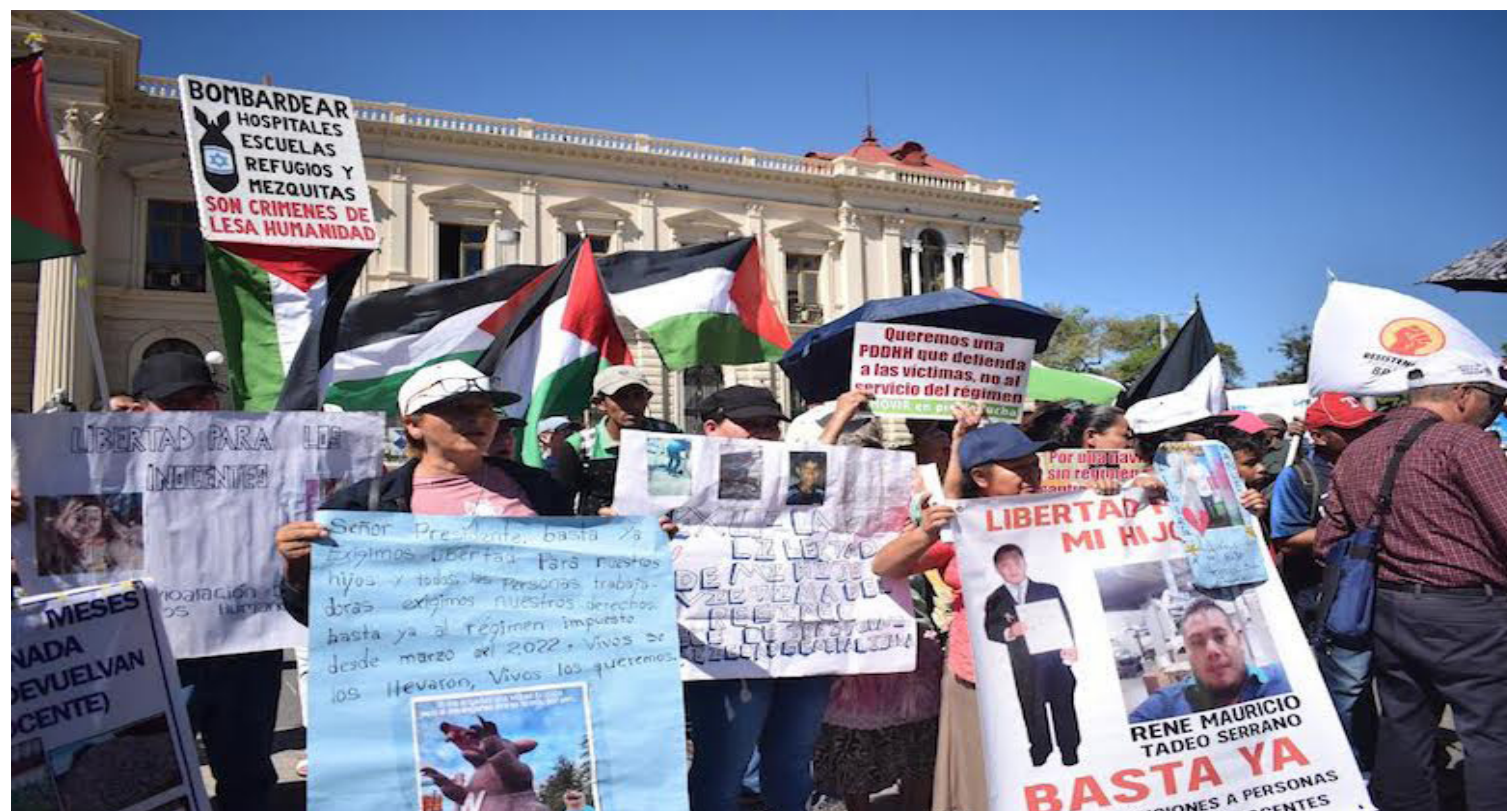
Integrantes de MOVIR manifiestan que existen detenciones de personas que no presentan antecedentes penales, ni vinculación con grupos delictivos; sin embargo, fueron detenidas y llevadas a juicios por ello.

Y en el marco de la Declaración Universal de Derechos Humanos, decretado por la Asamblea General de las Naciones Unidas el 10 de diciembre de 1948 en la ciudad de París, Francia, que marcó un compromiso de las naciones a proteger y respetar los derechos fundamentales de la humanidad, el Movimiento de Víctimas del Régimen El Salvador (MOVIR), reafirmó su acuerdo colectivo a su “lucha justa” por los inocentes capturados en el marco del régimen de excepción de El Salvador.