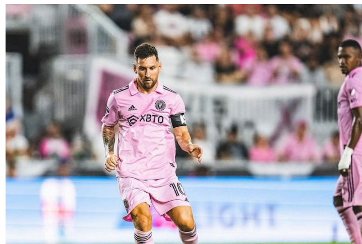
Boletos para el área de platea para el encuentro del Inter de Miami contra la Selecta quedan "sold out" a tres días de que se habilitó la preventa.

Y en la línea de ataque estarán: Jonathan Esquivel (Isidro