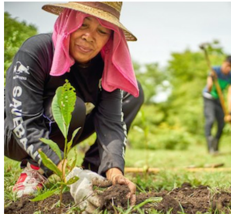
En el Conversatorio “Defensoras Ambientales y su Lucha por la Seguridad Alimentaria”, convocada por la Organización de Mujeres Salvadoreñas, señalan que las mujeres rurales aportan a la seguridad alimentaria y la defensa del medio ambiente.

Vaquerano también informó de la Campaña Mujeres Defensoras del Clima y Medio Ambiente, desde donde se está tratando de evitar el uso de plástico desechable, “porque hay miles de toneladas de plástico en los océanos y los ríos de plástico de un sólo uso y en este cuaderno que les hemos entregado