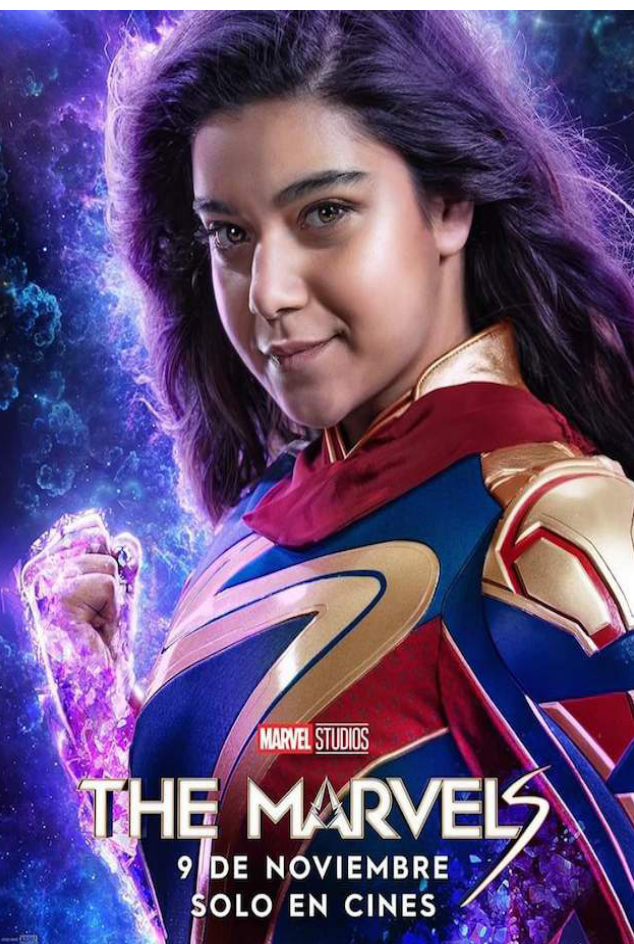
MARVEL STUDIOS THE MARVELS 9 DE NOVIEMBRE SOLO EN CINES