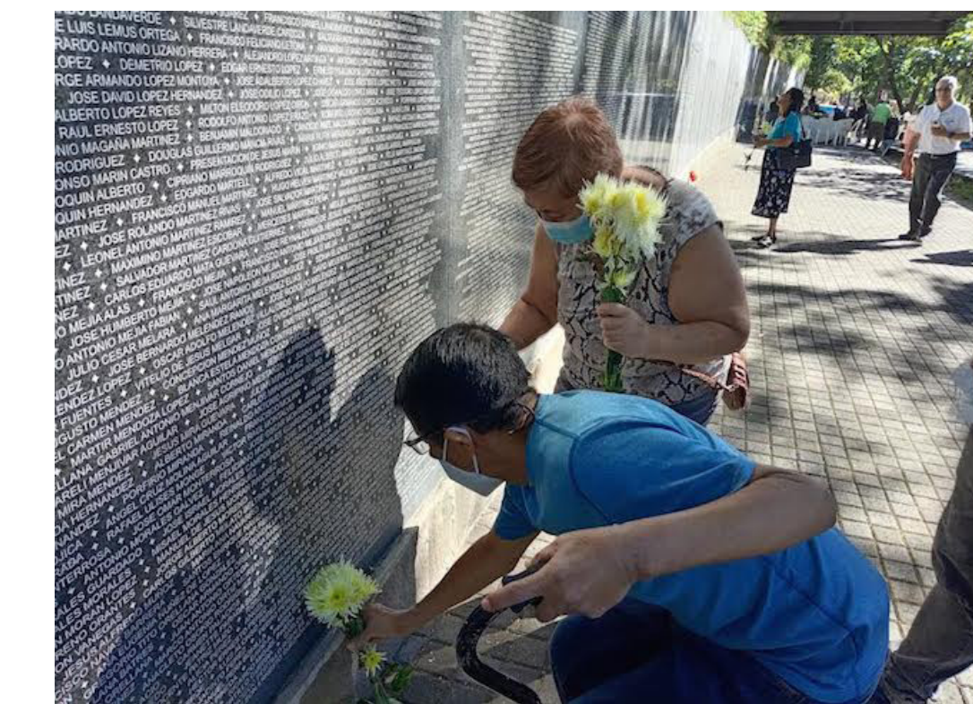
En el Monumento a la Memoria y la Verdad, la Comisión de Trabajo en Derechos Humanos Pro-Memoria Histórica de El Salvador, conmemora el 75o Aniversario de la Declaración Universal de Derechos Humanos.

“Sabemos como deben operar las detenciones en el país, que pueden ser mediante orden judicial o en flagrancia, no hay otra forma, pero aquí se han aplicado detenciones arbitrarias, han hecho diligencias irregulares y puesto pruebas falsas en procesos realizados por militares”, acotó. “Tenemos muchos casos