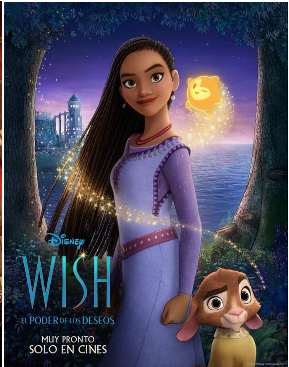
Disney WISH EL PODER DE LOS DESEOS MUY PRONTO SOLO EN CINES