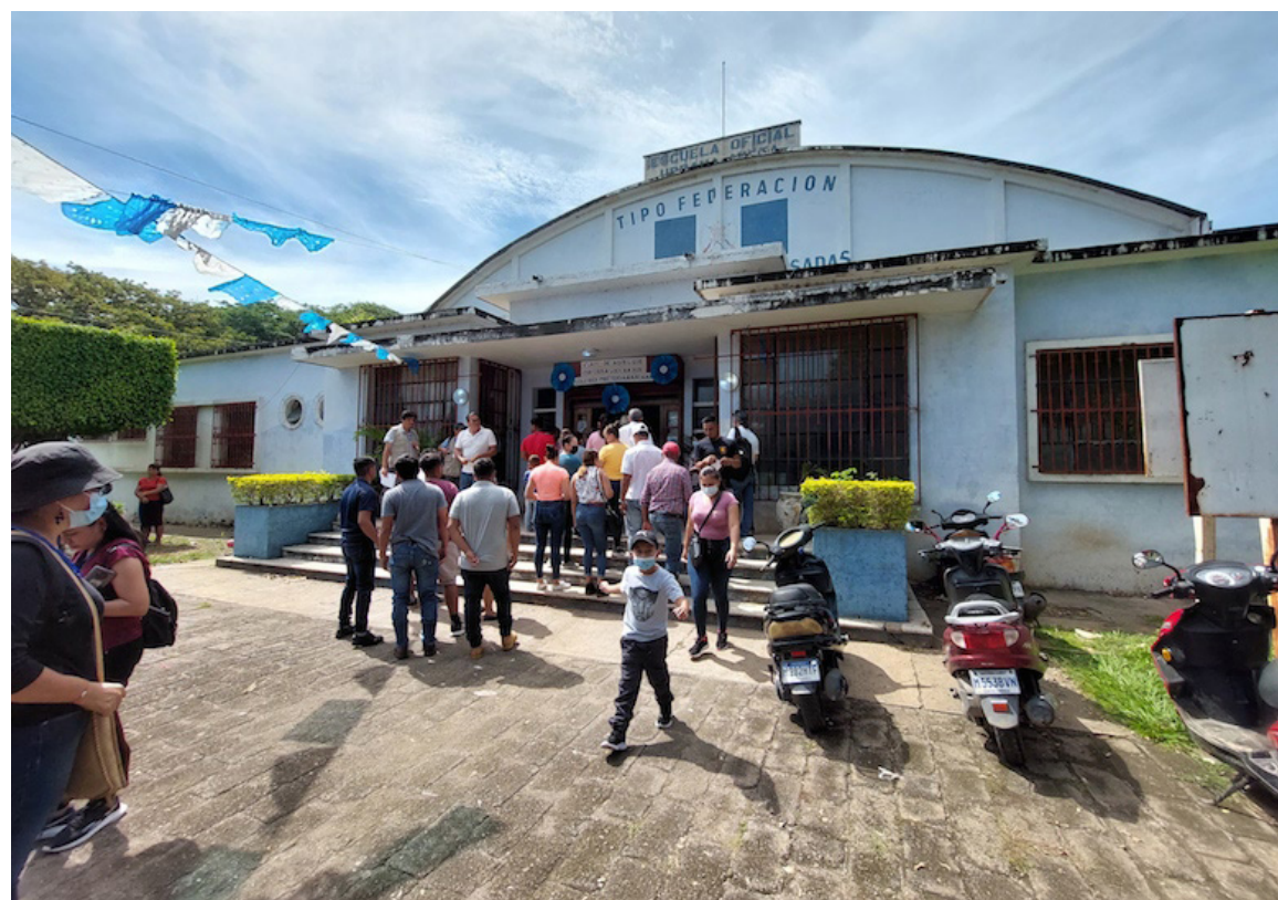
Pobladores de Asunción Mita, j Guatemala, junto a organizaciones sociales se unen para denunciar el intento de revertir los resultados de la Consulta Municipal para el cierre del proyecto minero “Cerro Blanco”.

“A la sociedad civil salvadoreña y la Comunidad Internacional pedimos que se solidaricen se pronuncien y tomen acciones a favor del pueblo de Guatemala en la lucha contra la corrupción y por la restauración de la democracia, los derechos humanos y el bien común”, solicitan las organizaciones firmantes del comunicado.