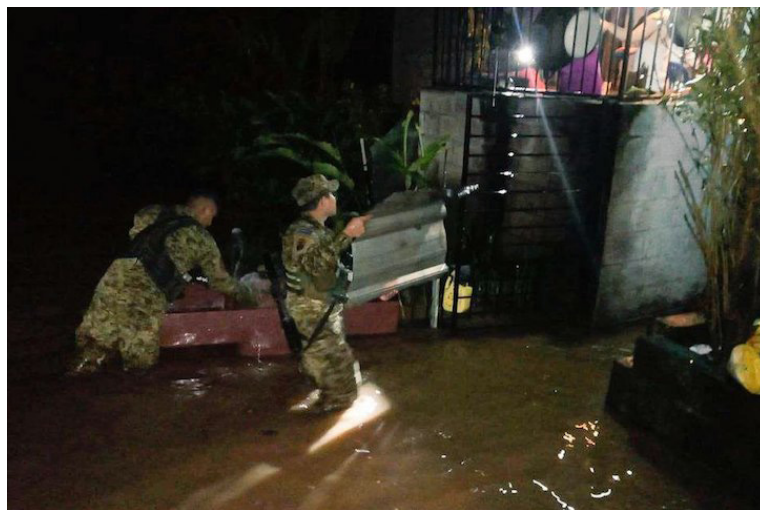
Varias familias del barrio San Martín, en San Francisco Gotera, Morazán, fueron evacuadas, luego que el río San Francisco se desbordó e inundó las viviendas cercanas.

Asimismo, varias familias del barrio San Martín, en San Francisco Gotera, Morazán, fueron evacuadas, luego que el río San Francisco se desbordó e inundó las viviendas cercanas; en el mismo lugar, una pasarela colapsó debido a la crecida del río, dejando a una comunidad incomunicada.