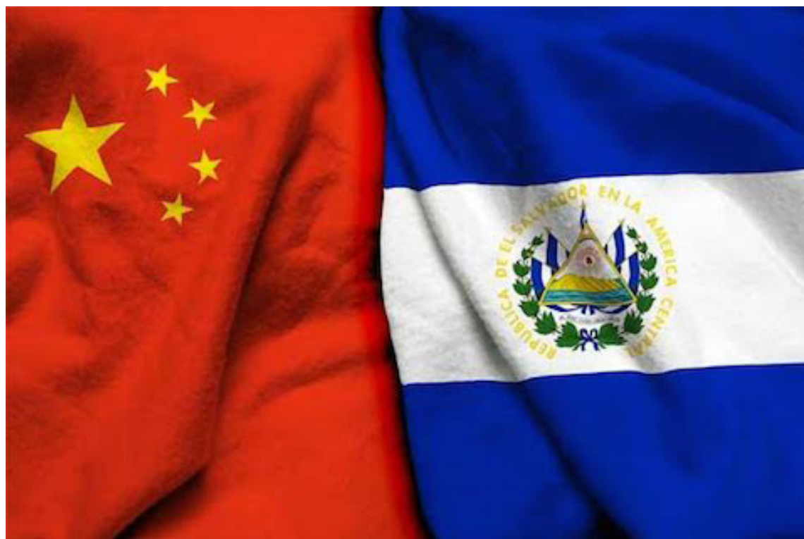
La Asamblea Legislativa aprueba la exoneración de impuestos a donativos provenientes de China Continental. El Salvador celebró la apertura de relaciones diplomáticas desde 2018.

En febrero de 2022, China donó 54 millones de dólares para