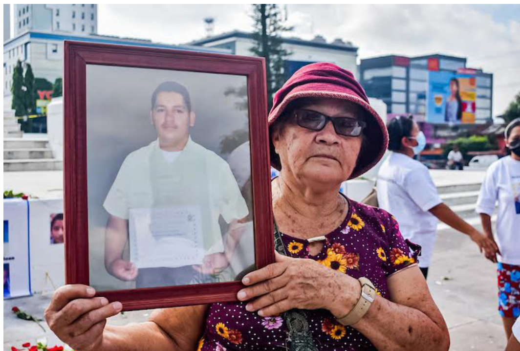
Las familias de los desaparecidos en el país son las que levantan la voz demandando de las autoridades investiguen sobre lo que ha pasado con sus familiares.