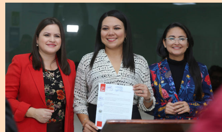
El FMLN propone eliminar impuesto de la renta al aguinaldo 2023.

Según el MTP, en todas las ocasiones donde han presentado las denuncias a la PDDH no se tiene respuesta favorable, únicamente una reunión contingencial por parte de la procuradora adjunta para los Derechos Económicos, Sociales y Culturales, el 13 de abril 2023, en la cual se expuso que se daría inicio a la procuración respectiva del caso; desde esa fecha no hay ninguna respuesta.