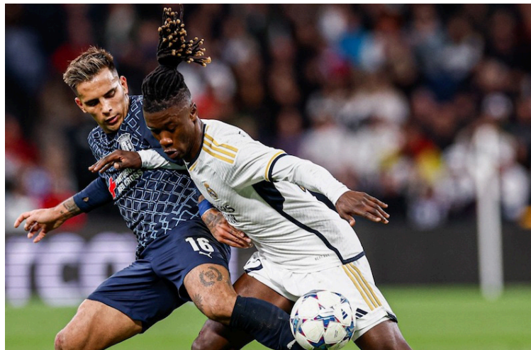
Camavinga, del Real Madrid, pelea un balón contra Rodrigo Salazar, del Braga de Portugal, en la jornada 4 de la Champions League.

En los marcadores: Napoli 1-1 Union Berlín, Real Sociedad 3-1 Benfica, Bayern 2-1 Galatasaray, Arsenal 2-0 Sevilla, PSV 1-0 Lens, Real Madrid 3-0 Braga, Copenhague 4-3 Manchester United y Salzburg 0-1 Inter.