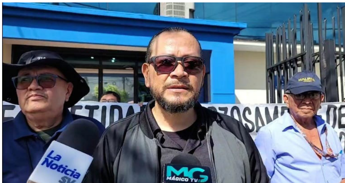
El Movimiento de los Trabajadores de la Policía señala que desde el 1 de abril de 2022 han sido despedidos 2,300 personas mayores de 60 años de la policía.