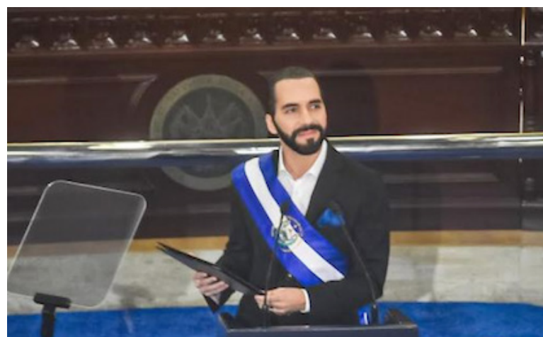
Nayib Bukele mandará a la Asamblea Legislativa una solicitud de permiso para ausentarse en el cargo.

“Seguramente este es un proceso que vamos a hacer en la última semana, en la última plenaria de este mes, él puede enviar a los designados que él crea conveniente y nosotros vamos a elegir