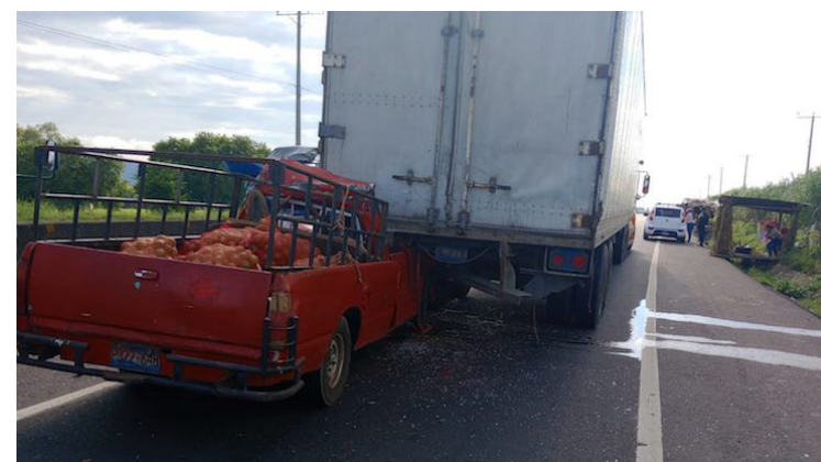
El conductor de un pick up murió al chocar contra la parte trasera de una rastra, en el cantón Las Higueras, Izalco, carretera hacia Sonsonate.

Reyes dijo que el VMT mantiene contantemente la campaña “Cero Tragedias”, para concientizar a la población sobre conducir de manera responsable, don-