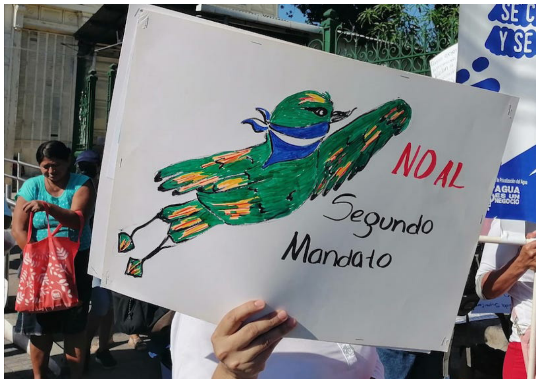
La plataforma SUMAR insta a la ciudadanía a rechazar la candidatura inconstitucional del actual mandatario, quien está obligado a respetar la Constitución.