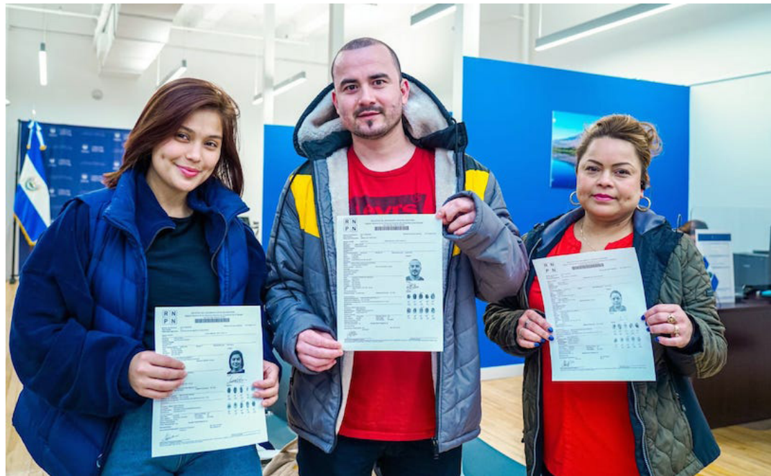
Este 5 de noviembre venció el plazo para tramitar o renovar el documento y ser incorporado en el Registro Electoral en el exterior.

Para tramitar o renovar el DUI en el exterior no era necesario pedir cita en ninguno de los consulados o embajadas, solo ser mayor de 18 años, pagar $35 o el equivalente en moneda local, presentar partida de nacimiento original (para este trámite