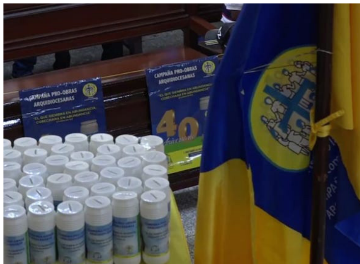
La arquidiócesis de San Salvador inaugura la campaña de las alcancías número 40 en todas las parroquias, para colaborar al sostenimiento de las obras pastorales.

En la arquidiócesis de San Salvador desde 1984 la Campaña Pro- Obras Arquidiocesanas o campaña de las alcancías “Cristiano la iglesia es comunión”, surgió como un medio para canalizar el fruto de la corresponsabilidad de los miembros