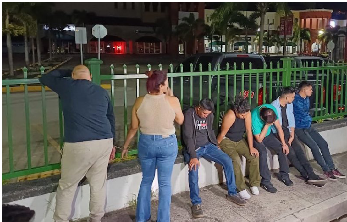
Este fin de semana 29 personas fueron detenidas por conducir bajo los efectos de bebidas embriagantes.