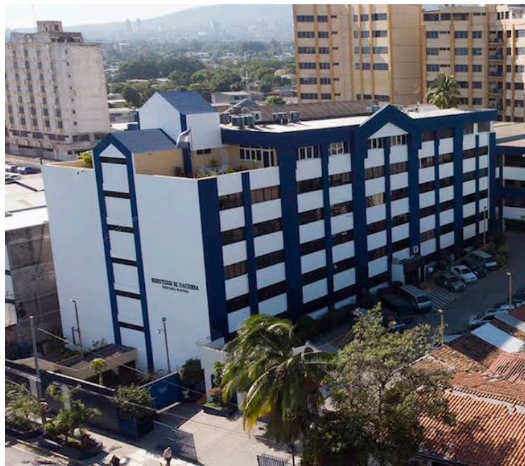
Los montos sustraídos en las áreas de Educación y Salud representan el 4.2% y 0.6% respectivamente de sus presupuestos totales vigentes.

También, de la Procuraduría General sustraen $1 millón, del Ramo de Gobernación sustraen $1,662,655, y del Ramo de Justicia y Seguridad Pública sustraen $14,066,601. Del presupuesto del Ramo de Educación se sustraen $60,475,621. Del presupuesto de Salud se le sustraen $7,400,000, del Ramos de Trabajo sustraen $1,290,000, del Ramo de Cultura sustraen $1,953,603, del Ramo de Vivienda sustraen $952,955, del Ramo de Desarrollo Local sustraen $10,908,705, del Ramo de Agricultura se sustraen $3,197,935, del Ramo de Medio Ambiente sustraen $357,050, del Ramo de Turismo se sustraen $2 millones.