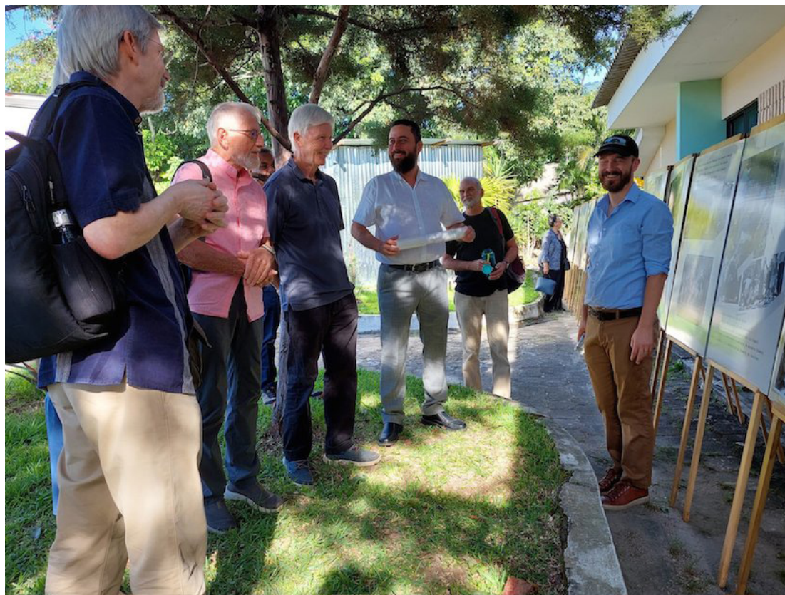
Diversas organizaciones de familiares de víctimas, víctimas sobrevivientes y amigos, se reunieron para celebrar los 40 años de existencia de Tutela Legal “María Julia Hernández”.

tual, Díaz indicó que era un “ambiente grave”, que exigía muchos retos y tareas a realizar en la participación de manera unificada y así exigir a las instancias internacionales a pronunciarse sobre el estado de los derechos humanos en el país.