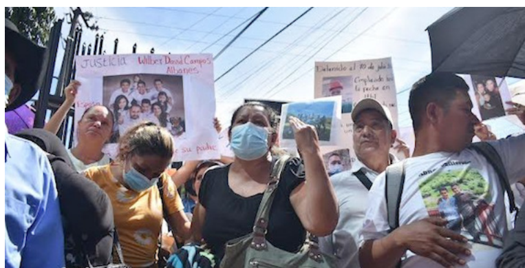
Centenares de personas se han pronunciado en las calles para exigir que sus detenidos injustamente por el régimen de excepción salgan en libertad.

Estudios para la Aplicación del Derecho (FESPAD), el Servicio Social Pasionista (SSPAS) y Azul Originario (AZO) corresponde a las víctimas atendidas entre marzo de 2022 a septiembre de 2023.