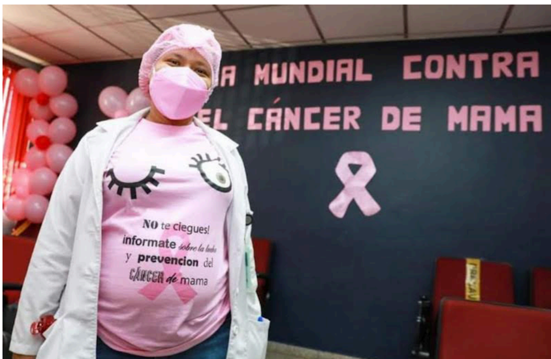
Cada 19 de octubre se recuerda el Día Internacional de la Lucha contra el Cáncer de Mama, para crear conciencia y promover que cada vez más mujeres accedan a controles, diagnósticos y tratamientos oportunos y efectivos.