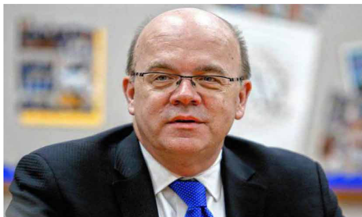
James Patrick McGovern representante del segundo distrito congresional de Massachusetts, señala que en El Salvador existe “un grave deterioro de los derechos humanos.

“En 2017 el pueblo salvadoreño eligió como presidente a Nayib Bukele. En agosto de ese año me reuní con él y me hizo muchas promesas, a mí y a la presidenta (de la Cámara de Representantes) Nancy Pelosi, sobre el respeto a los derechos humanos y al estado de derecho. Pero, desde entonces, hemos visto un deseo de concentrar el poder y atacar a las insti-