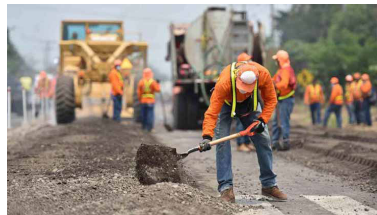
El MOPT podrá firmar contratos para la estabilización de precios del petróleo en El Salvador. Es una reforma a la Ley FOVIAL, aprobada con 64 en la Asamblea Legislativa.

Según cifras de la Dirección General de Energía, Hidrocarbu-