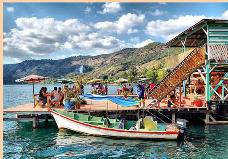
El gasto diario por visitante es de 167 dólares durante una estadía que fluctúa entre dos y tres semanas.

El turismo en El Salvador está cerca de cumplir sus metas de ingresos y visitantes para el año 2023, indicó este domingo en un comunicado.