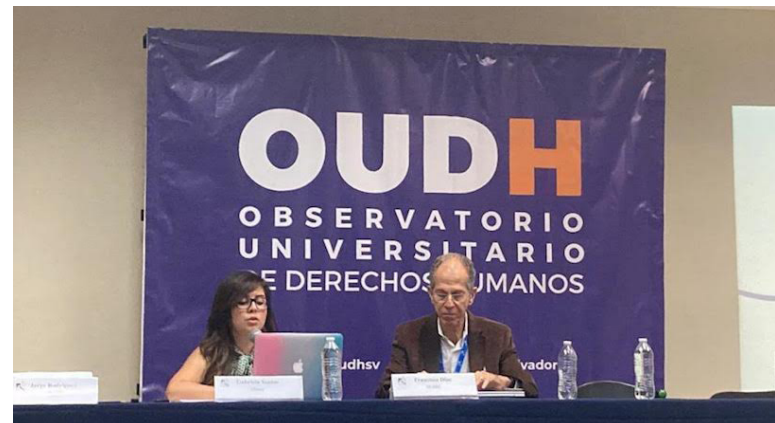
La investigación tuvo como objetivo examinar las condiciones de derechos de acceso a la justicia de la población salvadoreña en el marco de la aplicación del régimen de excepción.

Por otra parte, el Idhuca informó que entre el 27 de marzo de 2022 y el 31 de mayo de 2023 recibieron 904 casos de violaciones a los derechos humanos, 866 de los casos constituyen presuntos hechos de detenciones arbitrarias y vulnera-