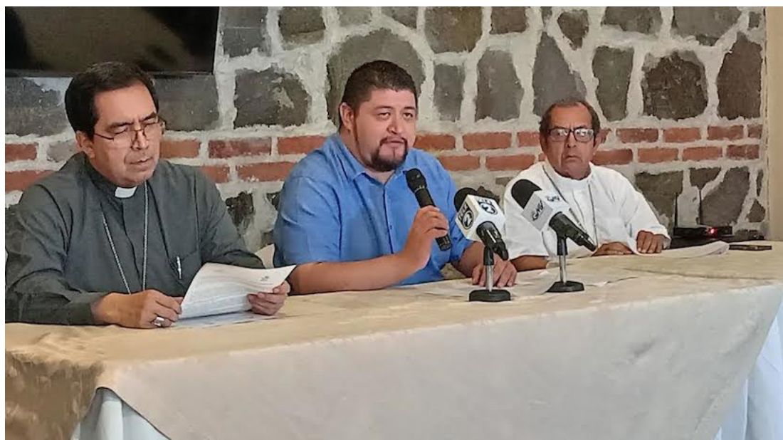
El Colectivo Socio Ambiental “Cuidemos la Casa de Todos” y la Red Eclesial Ecológica Mesoamericana, demandan a la actual legislatura (2021-2024), la ratificaciones constitucionales de los derechos humanos al agua y la alimentación adecuada, antes de finalizar su período.