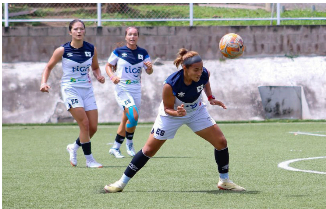
La selección femenina desarrolla el último microciclo previo al DUELO ante Honduras en las eliminatorias rumbo a Copa Oro

“Tras eso vamos. No vamos solo por puntuar, vamos por los seis puntos, en nombre de Dios se puedan obtener. El último resultado ante Honduras fue negativo, un 1-0 en contra”,