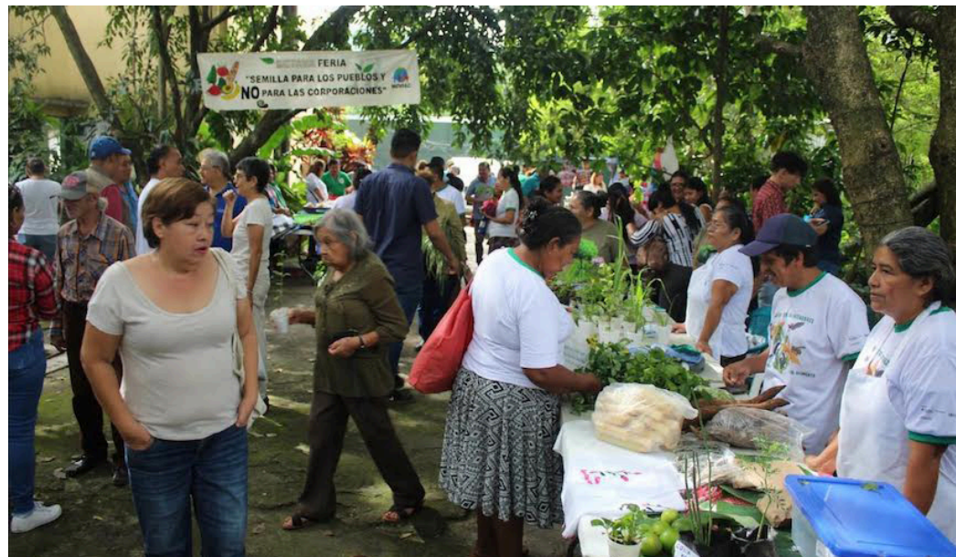
El CESTA y MOVIAc consideran necesario promover los santuarios e intercambio de semillas nativas y criollas, ya que juegan un papel determinante en la crisis alimentaria y es posible obtener productos de buena calidad.

“La semilla de maíz híbrida que están facilitando es malísima, la tusa no logra llenar el olote y se pudre, hay muchas quejas de las personas, aparte de eso se da bastante retardado, para entonces la familia ya ha sembrado o han he-