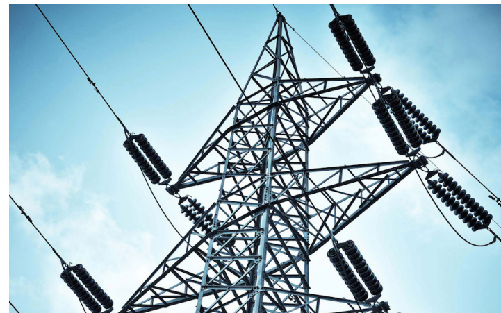
El alza en los precios de la energía eléctrica estarán vigentes desde este 15 de octubre y hasta el próximo 14 de enero.

Hay que destacar que el gobierno habría desembolsado 30 millones en el trimestre pasado,