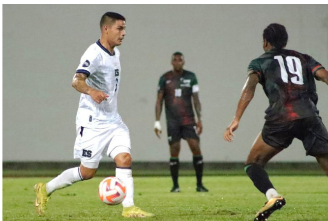
El Salvador finalizará su participación en la Liga de Naciones de CONCACAF (LNC) ante Martinica, en el estadio Mágico Gonzales, tras quedar eliminado en la jornada 3.