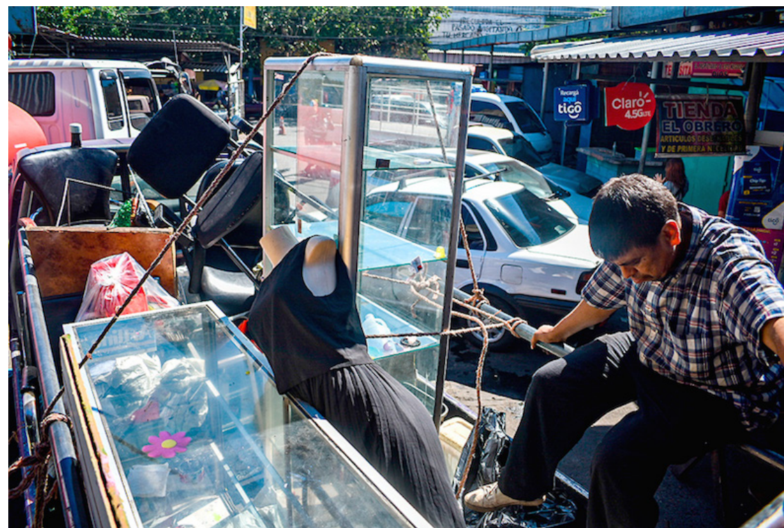
Los desalojos en el centro de la capital dejaron limpias las calles, pero también dejaron más pobres a centenares de familias.

El sociólogo, con una actitud altanera y desafiante, dejó en claro que el desalojo se llevaría a cabo sin importar la voluntad de los comerciantes. Durante la reunión, se discutió qué cuerdas serían afectadas por esta medida. En medio de la tensión, una valiente mujer alzó la voz y planteó una pregunta crucial: ¿qué alternativas les ofrecían a los comer-