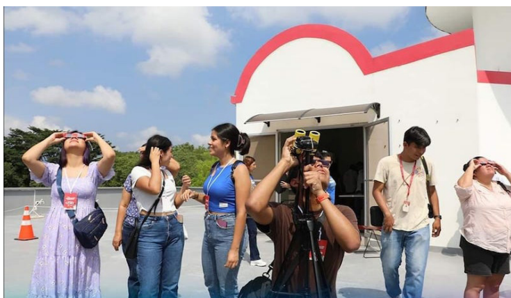
Niños, jóvenes y adultos, a través de telescopios, cámaras con filtro y gafas especiales, disfrutaron del eclipse solar anular.

Niños, jóvenes y adultos, a través de telescopios, cámaras con filtro y gafas especiales, disfrutaron del eclipse solar anular, conocido como “anillo de fuego”, que ocurre cuando la luna no llega a ocultar completamente el sol, convirtiéndose en uno de los fenómenos naturales más im-