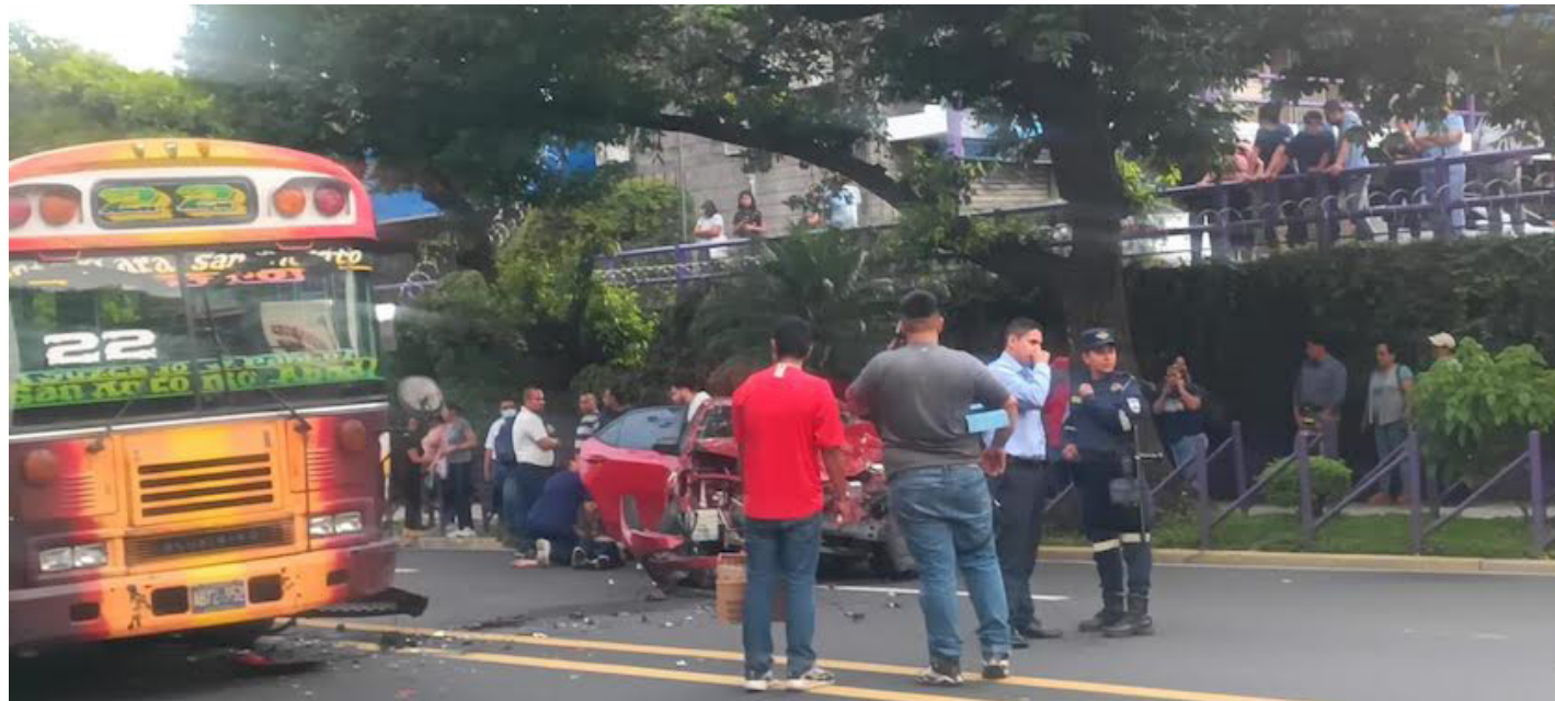
“Accidentes viales suben al 16% al 12 de octubre de 2023, según el Observatorio de Seguridad Vial del VMT. Pero las muertes viales bajan al 5.2%.

Alessia Genovés Colaboradora @DiarioCoLatino