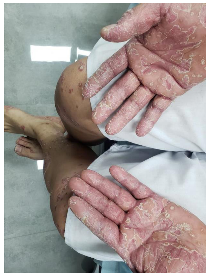
El ex diputado del FMLN y ex ministro de Trabajo, Calixto Mejía, detenido desde julio de 2021, sufre de psoriasis crónica y otras enfermedades.

El ex diputado capturado desde julio de 2021 por supuesto en-