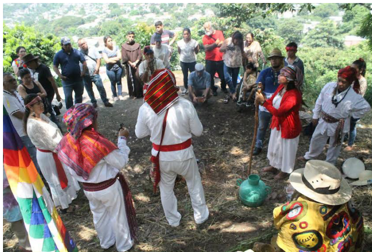
La FEPO-Sur desde el desarrollo de la semana de la Resistencia, y con apoyo de las comunidades y colonias de San Jacinto, así como las organizaciones e iglesias que integran la Caminata Ecológica, programaron la consagración de un espacio en el cerro.

La FEPO-Sur desde el desarrollo de la semana de la Resistencia, y con apoyo de las comu-