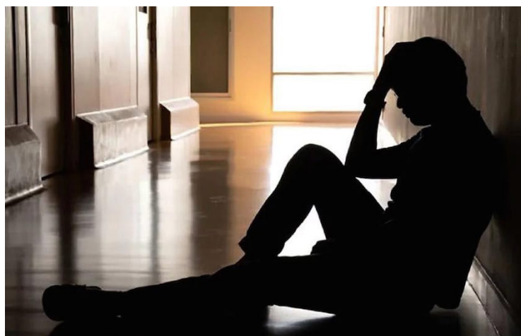
El país necesita políticas integrales de salud, e incorporar la atención psicoemocional, relegada en los planes de salud.

A criterio de SUMAR, el país necesita políticas integrales de salud, e incorporar la atención psicoemocional, históricamente relegada en los planes de salud y en las estrategias de seguridad vinculadas a la prevención de la