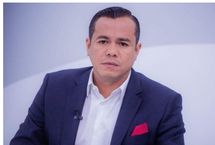
El ex ministro de Hacienda, Alejandro Zelaya, no aparece en la nómina de candidatos para la elección del presidente ejecutivo del BCIE.

El siguiente paso del proceso de selección del nuevo presidente ejecutivo del BCIE, es la entrevista a las personas propuestas por parte del director del Banco durante su período de sesiones correspondiente al mes de octubre, que ini-