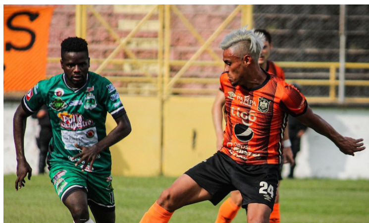
El Dragón deja escapar la victoria ante Águila en el derbi migueleño de la jornada 13 del Apertura.