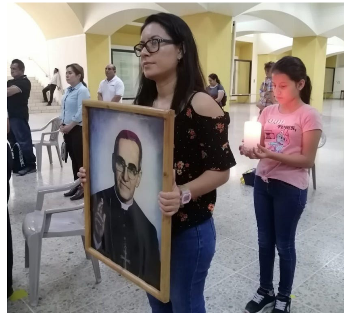
La feligresía recuerda en la Cripta de Catedral Metropolitana los cinco años de la canonización de Monseñor Romero, quien cumplió de manera ejemplar su compromiso con los más humildes y desprotegidos.

Monseñor Romero fue beatificado el 23 de mayo de 2015 en la Plaza Salvador del Mundo, y su canonización se celebró el 14