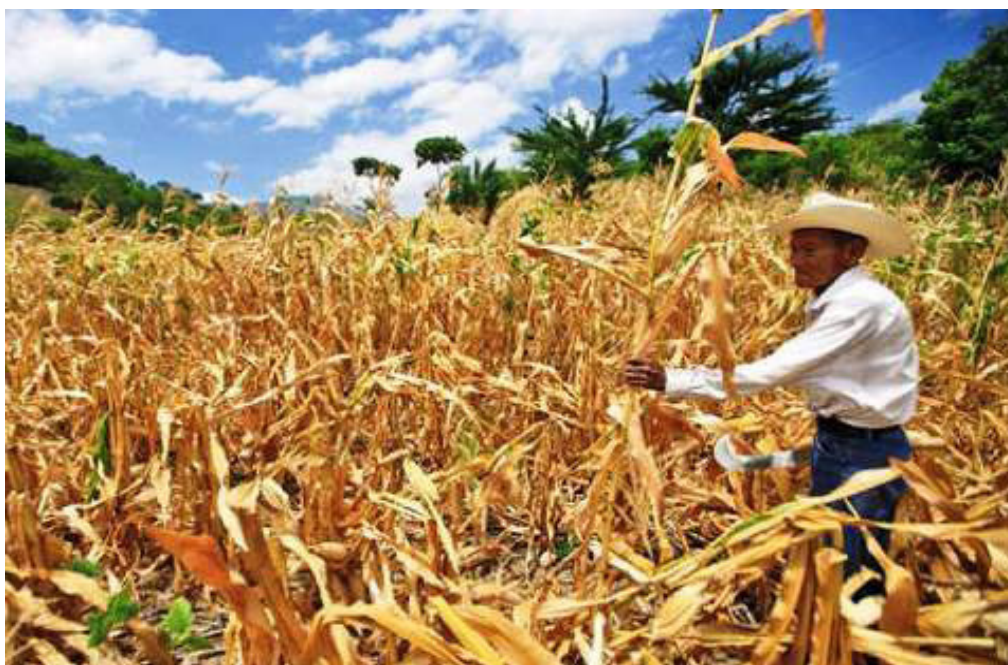
En el marco del Día Mundial de la Alimentación, OIKOS y UNES, señalan la importancia de la gestión del conocimiento intensiva y orientada a resultados que acelere la transformación necesaria en Seguridad Alimentaria.