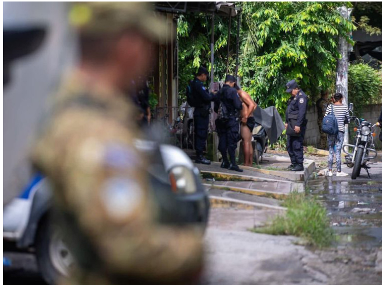
Tres cercos de seguridad han sido implementados este miércoles. Serán 4 mil agentes que operativizarán en Popotlán, Valle Verde (Apopa) y en La Campanera.

Ese diciembre y algunos meses después, la presencia de agentes de seguridad fue notoria; además, reportaron la captura de varios pandilleros que habían que-