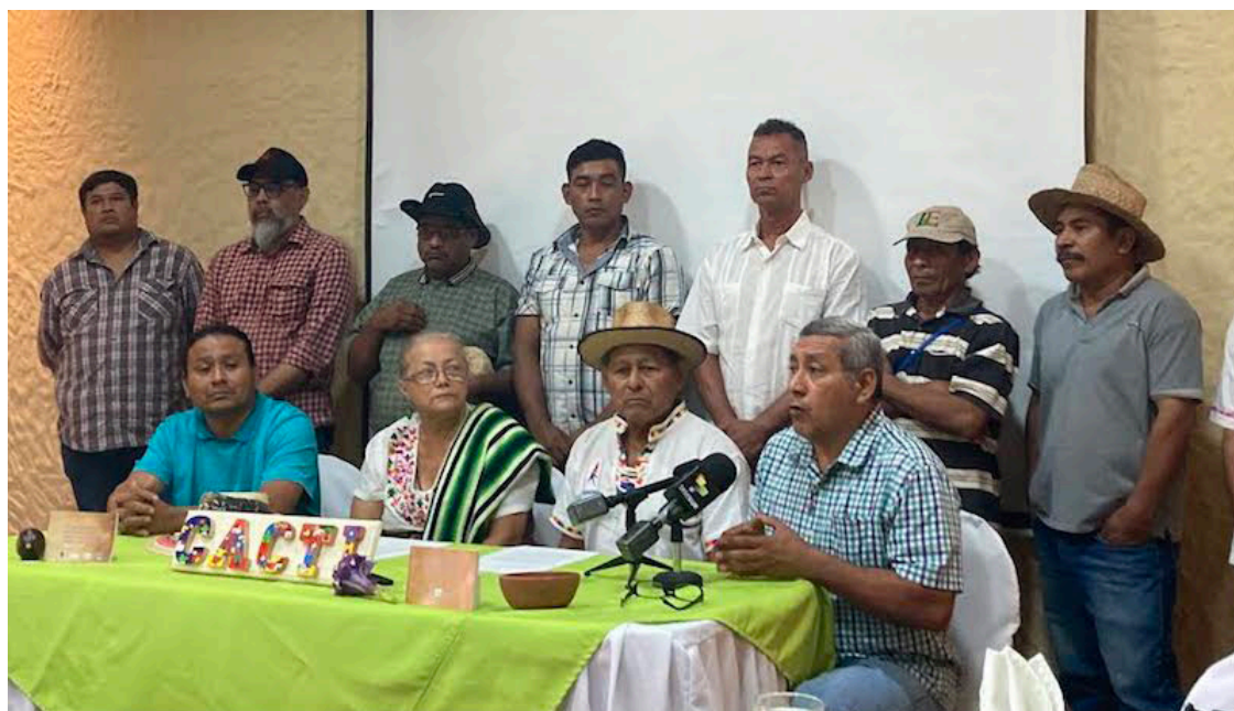
Los Pueblos Indígenas demandan y exigen debidamente que se respete en absoluta y libre determinación de los pueblos ancestrales, que implica la existencia de territorios indígenas autogobernados.

Latín consideró que si no se unifican los pueblos indígenas del país será difícil que el Estado y el gobierno atiendan su llamado.