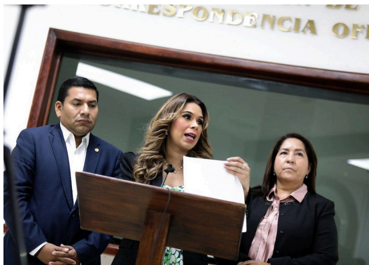
ARENA busca que la Asamblea Legislativa legisle sobre la salud mental, pero Nuevas Ideas se niega.

La fracción sostuvo que “para nadie es un secreto que en este país el tema de los suicidios es un grave problema de salud mental, en los últi-