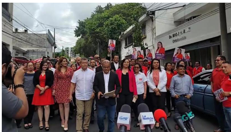
El partido Frente Farabundo Martí para la Liberación Nacional (FMLN) inscribió este miércoles oficialmente en el Tribunal Supremo Electoral (TSE) a sus últimos candidatos a diputados y diputadas para la Asamblea Legislativa de cara a las elecciones de 2024.

El secretario general del FMLN, Óscar Ortiz, dijo que es el primer partido político en inscribir las 60 candidaturas propietarias y suplentes de los 14 departamentos para la Asamblea Legislativa; el Frente cada semana presentó planillas con la documentación establecida por la ley. La próxima semana inscribirán a los candidatos a diputados para el Parlamento Cen-