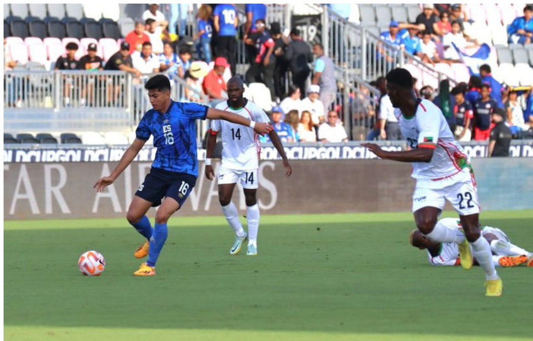
El Salvador enfrenta a Martinica en Estados Unidos en la jornada uno de la Copa Oro.