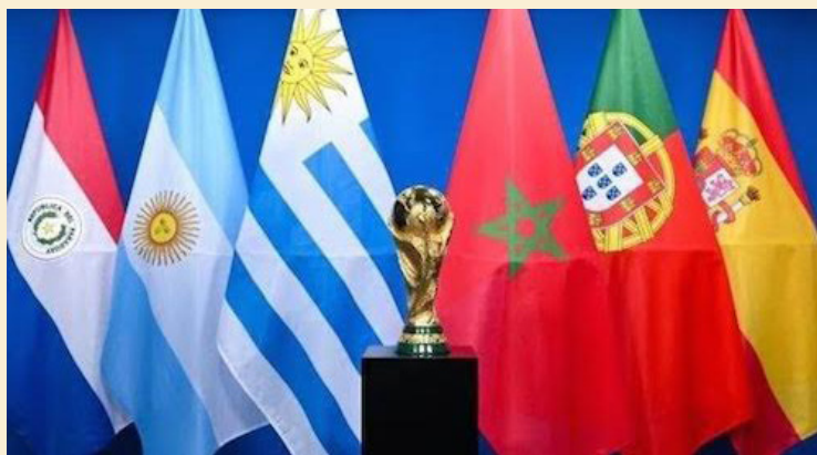
Como parte del centenario de la Copa del Mundo, la FIFA informa que la edición 2030 se inaugurará en Uruguay, Argentina y Paraguay, pero se desarrollará en España, Marruecos y Portugal.

"El Consejo de la FIFA también ha acordado de forma unánime que la única candidatura para organizar el Mundial de