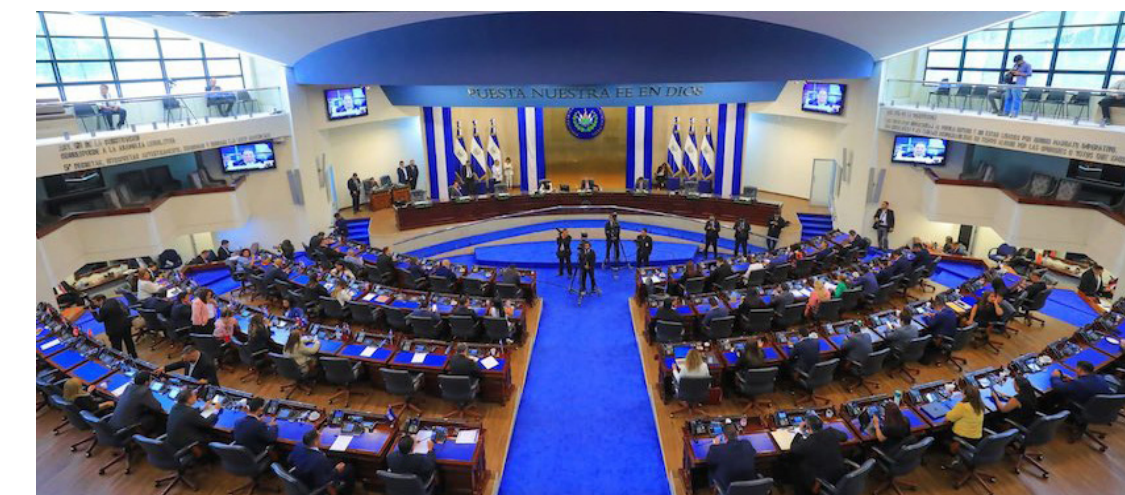
La declaratoria del Día Nacional del Juego contrasta con los cientos de menores que han sido afectados por la captura de sus padres que nada tienen que ver con pandillas.

Durante el estudio de esta iniciativa en la Comisión de Familia, los legisladores recibieron a representantes del despacho de la primera dama, del Instituto Crecer Juntos, el Consejo Nacional de la Primera Infancia, Niñez y Adoles-