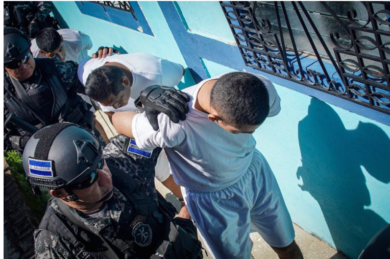
El Foro Nacional de Salud (FNS), condena de manera enérgica la violación sexual perpetrada contra una niña de 13 años, y agresión a su grupo familiar por miembros de la Fuerza Armada en el municipio de Mizata, La Libertad.

“¡No más impunidad!, reitera el mensaje oficial del Foro Nacional de Salud (FNS), al condenar de manera “pública y enérgica” la violación sexual perpetrada contra una niña de 13 años, por miembros de la Fuerza Armada en el municipio de Mizata, La Libertad.