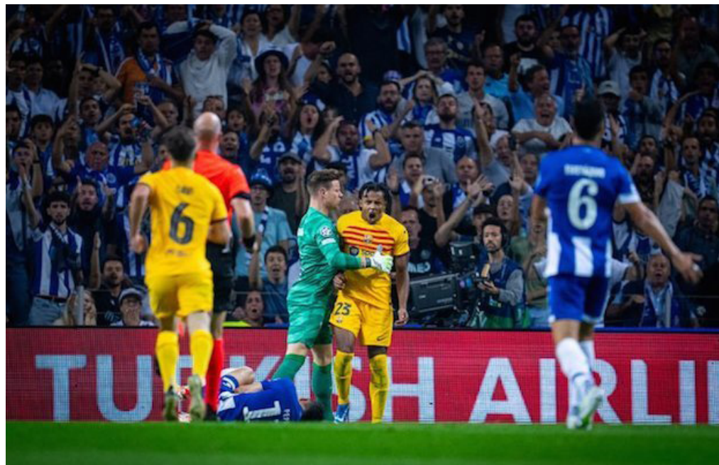
El Barcelona vence al Porto en el segundo partido de la fase de grupos de la Champions 0-1.

Madrid sumó los primeros tres puntos completos en la Champions, al ganar 3-2 ante el Feyenoord, y comparte el liderato del grupo E con el Lazio, quien le ganó al Celtic 1-2.