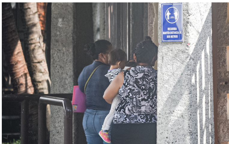
Familiares de detenidos injustamente piden a las autoridades conocer el caso de sus detenidos injustamente, ya que desde que se los han capturado no los han visto.

“Nosotros (la familia) estamos pasando un proceso muy duro porque padecemos de la presión y la azúcar y todo esto (el caso) nos afecta. Yo he visto a personas que han hecho daño y ahí andan como si nada, y al-