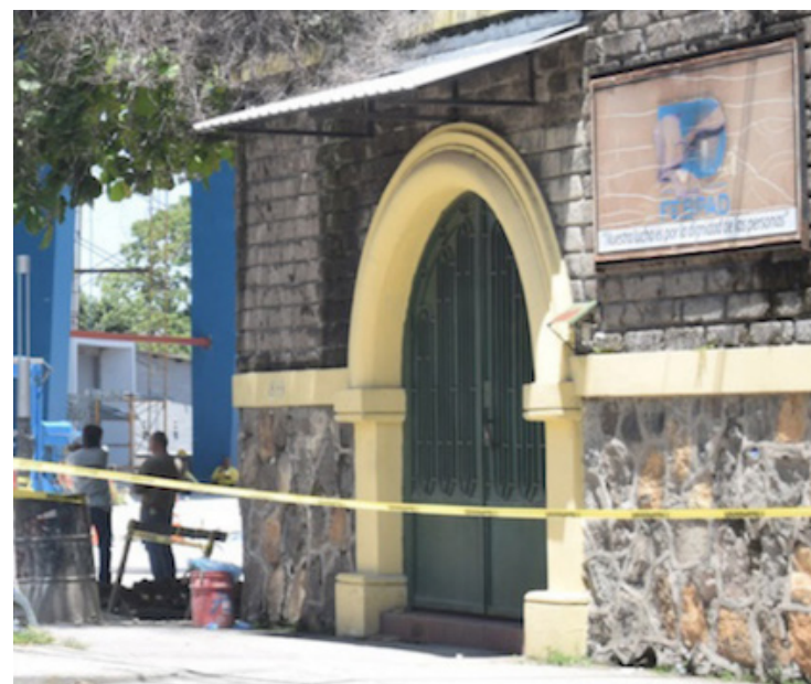
FESPAD lamenta el ataque que ha recibido la organización, por parte de cuentas anónimas conocidas como troles y que solo están desinformando.

“Reafirmamos nuestra convicción de dar continuidad a la labor histórica de FESPAD, de procurar la justa aplicación del derecho. El compromiso con el pueblo salva-