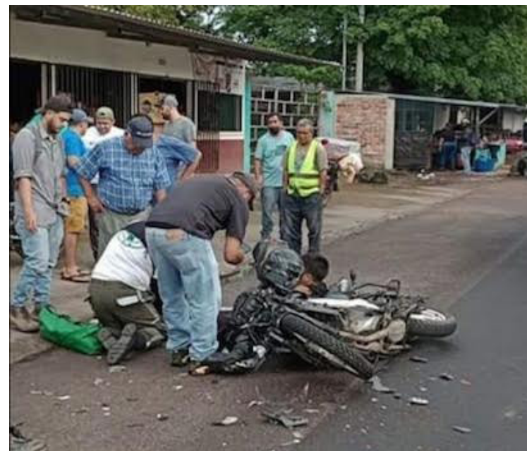
El VMT registra incremento del 12% de accidentes viales en motociclistas, a la fecha se contabilizan 2,382 percances mientras que, el año pasado en el mismo período la cifra fue de 2,127.

quier infracción y notificarle vía correo electrónico”, manifestó el director general de Tránsito, Alfredo Alvayero.