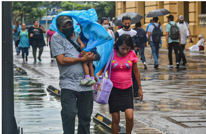
Desde el 5 hasta el 7 de octubre el MARN prevé un aumento general de la nubosidad, un cambio e incremento de las precipitaciones, con principal influencia en los sectores costeros.