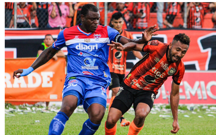
Águila finaliza con derrota de 0-2 en el cierre de la primera vuelta del Apertura de manos de Firpo.

recer el artillero de los blancos para marcar doblete a los 46', ante ello, el cuadro fogonero apareció Lester Blanco para poner el empate (76') y luego el argentino de los amarillos, Águila, marcó doblete y se quedó con los tres puntos.