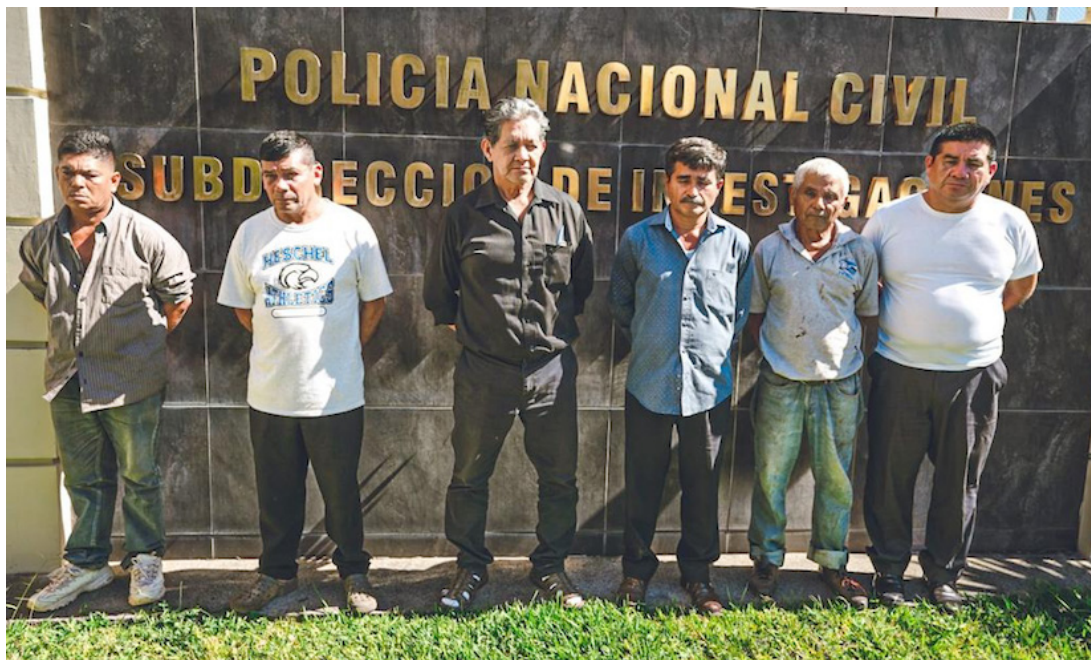
Fue el 11 de enero pasado que la FGR los capturó, desde entonces no ha habido condena debido a la falta de pruebas según organizaciones sociales.

Organizaciones sociales han pedido en más de una ocasión el sobreseimiento definitivo para los líderes ambientalistas, ya que aseguran que el ministerio público fiscal no tiene pruebas suficientes que respalden la acusación.