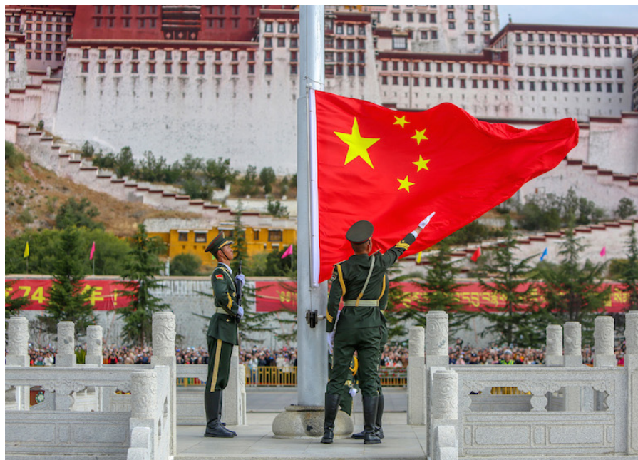
Una ceremonia de izamiento de bandera para celebrar el 74° aniversario de la fundación de la República Popular China se lleva a cabo en la plaza del Palacio de Potala, en Lhasa, capital de la región autónoma del Tíbet, en el suroeste de China, el 1 de octubre de 2023.

Lo que representó un crecimiento interanual del 71,6 por ciento, mientras que los ingresos generados ascendieron a 370 millones de yuanes (50,7 millones de dólares), lo que supone un 49,1 por ciento por ciento más