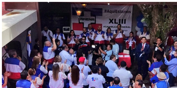
ARENA realiza su XLIII Asamblea General donde ratifica a los candidatos de las elecciones 2024.

El partido ARENA realizó su Asamblea General número 43, justo a las puertas de uno de los eventos electorales “más atípicos de la historia democrática de nuestro país”, explicó el partido tricolor en su postura oficial. En el curso de esta celebración, la institución política ratificó a todos los candidatos que participarán en estos comicios, inclu-