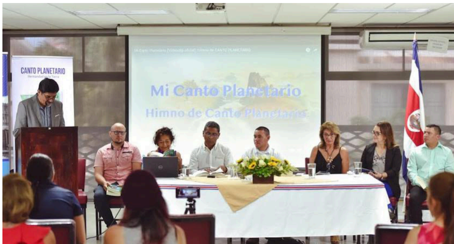
Canto Planetario es un proyecto que aspira trascender fronteras y unir personas y voluntades de diversas culturas, lenguajes y perspectivas en torno a la temática central del medio ambiente y en donde el castellano es el hilo conductor.

joven nicaragüense que constantemente está buscando mecanismos en los cuales se aborden temáticas de interés no solo en su tierra, en su región, sino trascender a los demás rincones del planeta. Es así, que hay que recordar que en 2021, consolidó otro de sus proyectos, que fue la an-