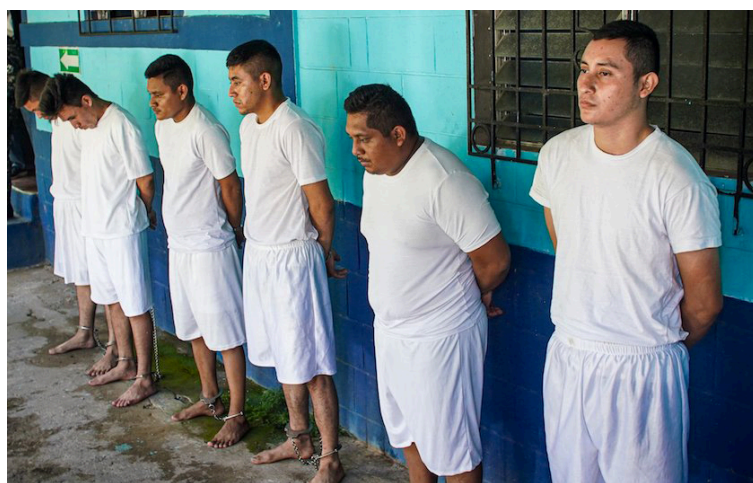
El Juzgado de Paz de Teotepeque valora las pruebas iniciales presentadas por que señalan la participación de los militares en la violación a una menor de edad y los envía a detención provisional.

La fiscal del caso recordó que estos imputados fueron presentados el 28 de septiembre, luego de que el sábado 23 del mismo mes, el sargento abusó sexualmente de una menor de 13 años de edad. El hecho sucedió a eso de las 6:30 de la tar-