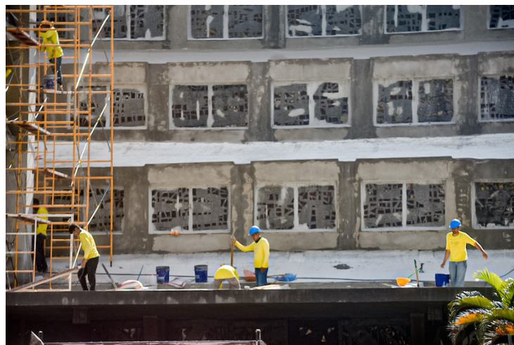
Privados de libertad se hacen pasar por trabajadores del MOP para reparar la fachada de la Iglesia El Rosario.

La iglesia El Rosario es un patrimonio cultural protegido, diseñado por Rubén Martínez Bulnes. Es una arquitectura Brutalista, un estilo arquitectónico que surgió en la década de 1950 y está ubicada frente a la Plaza Libertad en el Centro de San Salvador. El Gobierno la ha intervenido para supuestamente limpiar la estructura, impermeabilizar, restaurar la estructura