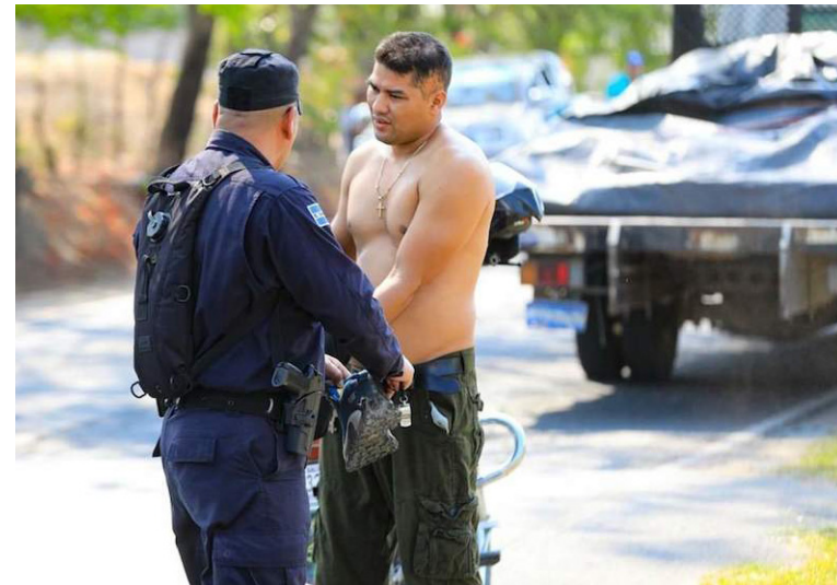
Socorro Jurídico Humanitario señala que el Régimen de Excepción no ha funcionado para hacer justicia, porque la mayoría de personas detenidas son inocentes y no líderes de pandillas.