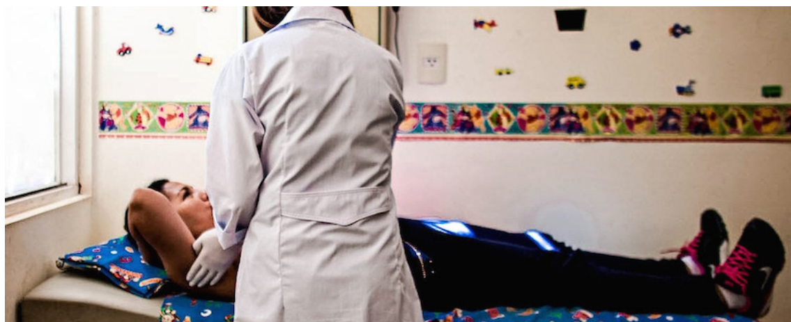
Unos minutos bastan para realizarse pruebas en la prevención del cáncer cérvico uterino y de mamas, ante cualquier cambio en su organismo se debe acudir al médico

“En las comunidades, cuando realizamos la campaña de citologías, las mismas mujeres generan las condiciones para su atención. Son ellas mismas quienes buscan esa casa, ese espacio adecuado para hacer los exámenes. Muchas veces, el gobierno local, como el de Chirilagua, desde la Unidad de Género, ha promovido estos espacios de acercamiento de grupos de mujeres y tener estas jor-