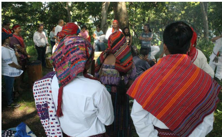
Los “Tatas” durante la ceremonia organizada por ACOPOC y FEPO-Sur, en el Lago de Ilopango, durante la ceremonia ancestral de Equinoccio.

También hicieron el llamado a turistas, así como a pobladores de la zona a cuidar el altar, que hoy está entre la gran Ceiba y los conacastes en la cumbre de la isla, como símbolo de resistencia y presencia de los ancestros.