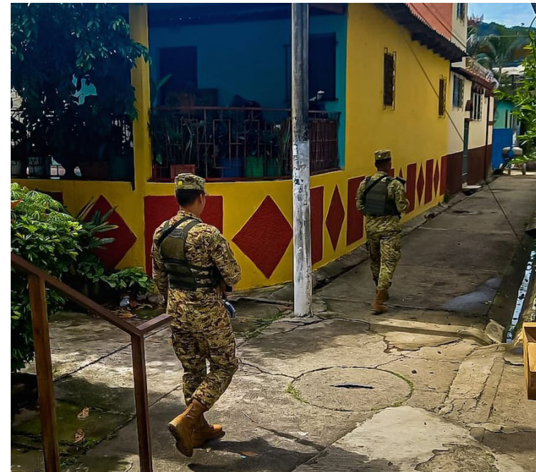
Soldados de la Fuerza Armada patrullan en los territorios.

A la fecha, solo el ministro de la Defensa René Francis Merino Monroy se ha pronunciado y dijo que a estos soldados se les tratará “como a un delincuente normal”; además, catalogó el hecho como “un caso