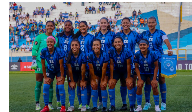
Con dos partidos con solvencia en las eliminatorias rumbo a Copa Oro W, la selección femenina de El Salvador enfrentará a Honduras en octubre.

“Tratamos de hacer las cosas lo más cercano a la excelencia posible porque es lo que se merece el fútbol, lo que merece El Salvador. Yo sí creo que si seguimos por este camino vamos a llegar a ser lo que al principio dije,