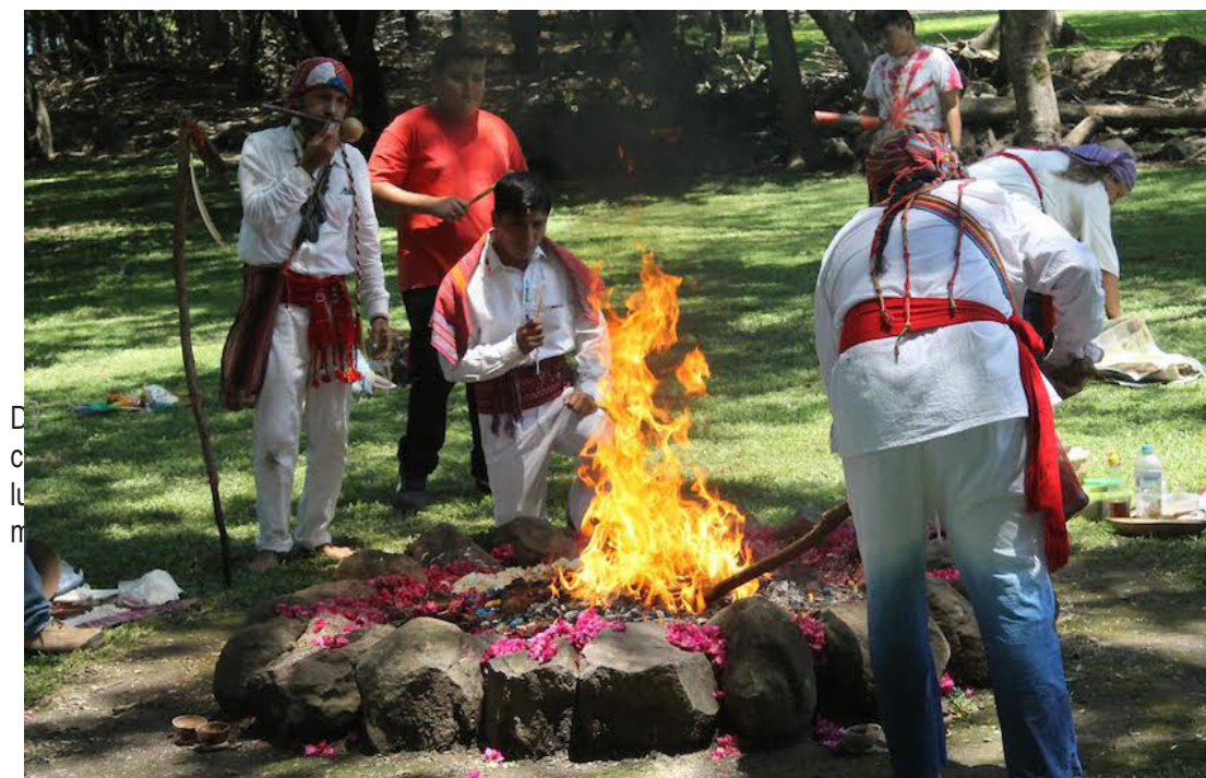
Celebración de ceremonia por el Equinoccio de Otoño, en Cihuatán, este domingo 24 de septiembre, en la Isla “La Puntona”, del Lago de Ilopango (Shilopanku).