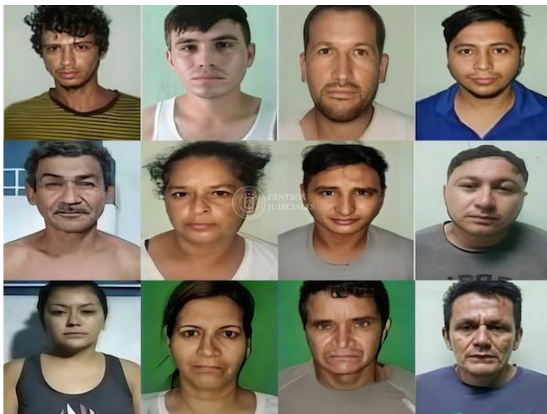
Estos son los sujetos que estarán en prisión mientras siguen con las investigaciones.