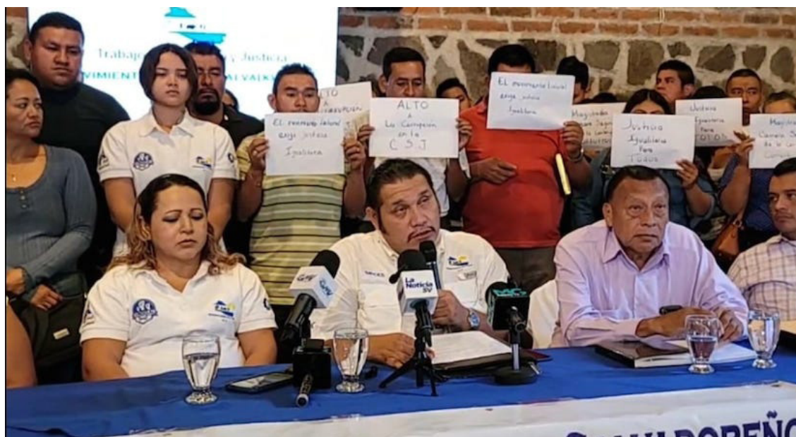
El Movimiento Laboral Salvadoreño (MLS) y la Confederación Obrera Centroamericana, denuncian atropellos y actos arbitrarios por parte de magistrados en contra de sindicatos.