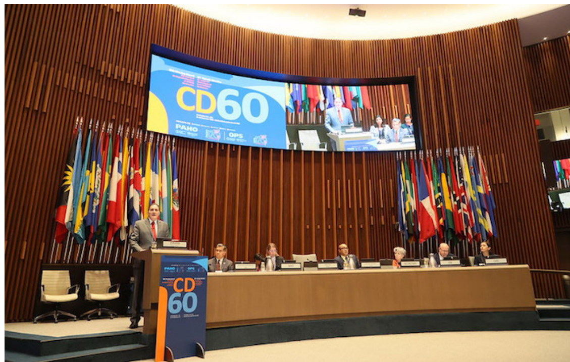
El Consejo Directivo de la Organización Panamericana de la Salud (OPS), celebra su 60o reunión con sus Estados Miembros, a los que pide la recuperación pospandémica.

“A pesar de estos retos con demasiada frecuencia las organizaciones y las conversaciones a nivel glo-