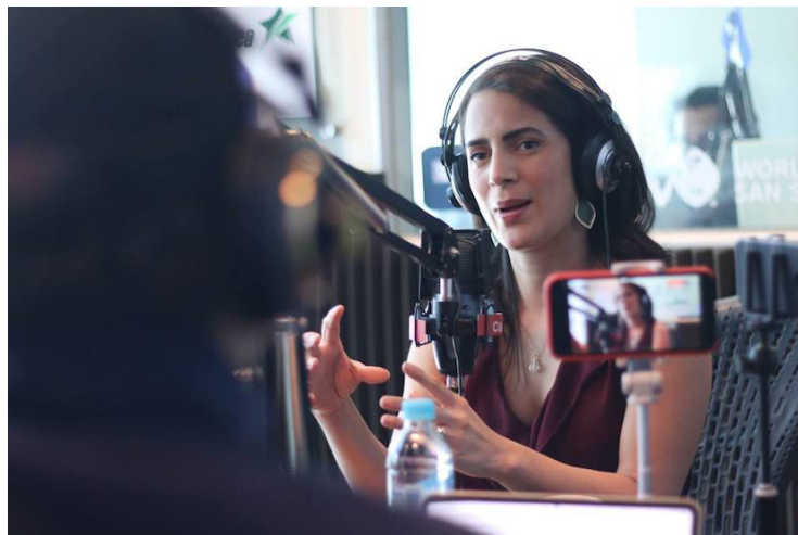
Diputada Claudia Ortiz dice que la Asamblea Legislativa es fundamental para contrarrestar el poder del Ejecutivo.

La diputada por el partido VAMOS, Claudia Ortiz, dijo en el programa radial “Somos La Tribu FM” que la elección más importante es la legislativa, ya que “todos los abusos de poder, de los fondos públicos, de los inocentes en el régimen de excepción, ha sido posible por una Asamblea que lo ha permitido”.