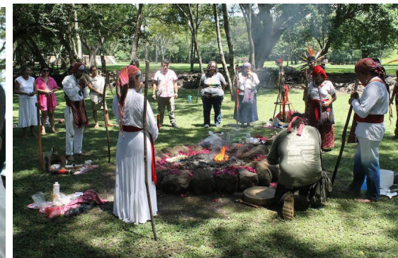
La FEPO-Sur ofrenda en el altar mayor agua de mar, como agradecimiento y petición por la unidad de las poblaciones originarias.