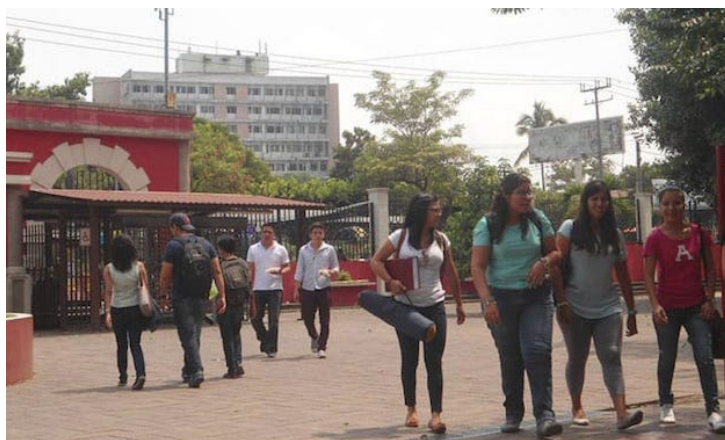
Los estudiantes que aspiran a cursar una carrera en la UES, tienen hasta el 30 de septiembre para el proceso de ingreso 2024.

El día viernes 20 de octubre todas aquellas personas que no hayan podido desarrollar su prueba tendrán la oportunidad de hacerla de forma diferida; los resultados se podrán consultar el 28 de octubre.