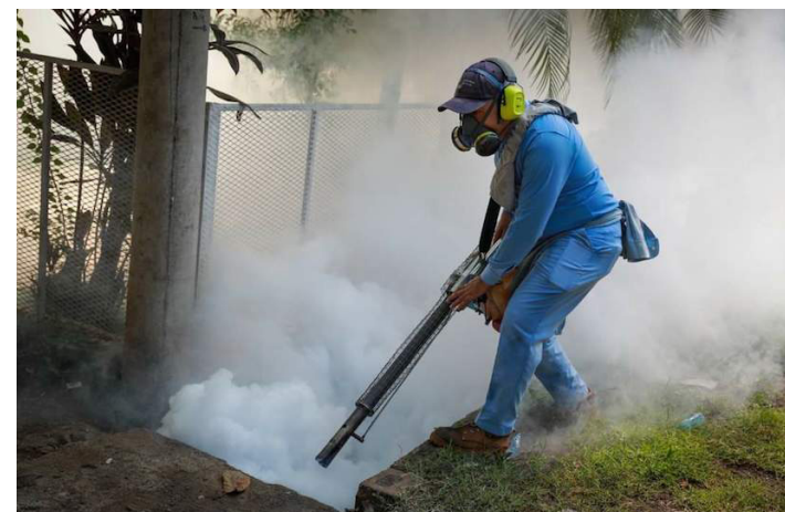
El Ministerio de Salud mantiene constantes jornadas de fumigación masivas, entrega de abate, eliminación de criaderos de zancudos, para evitar que más personas enfermen de dengue, zika o chikungunya.

las camas, sobre todo cuando hay pacientes enfermos para evitar que infecten nuevos mosquitos o en los lugares donde duermen los niños.