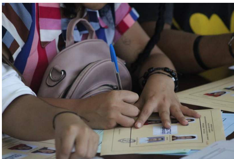
La plataforma “Visión Académica” denuncia irregularidades en el proceso electoral estudiantil y profesional no docente en la Facultad de Ciencias y Humanidades de la UES.

Durante toda la jornada electoral se encontraron en el centro