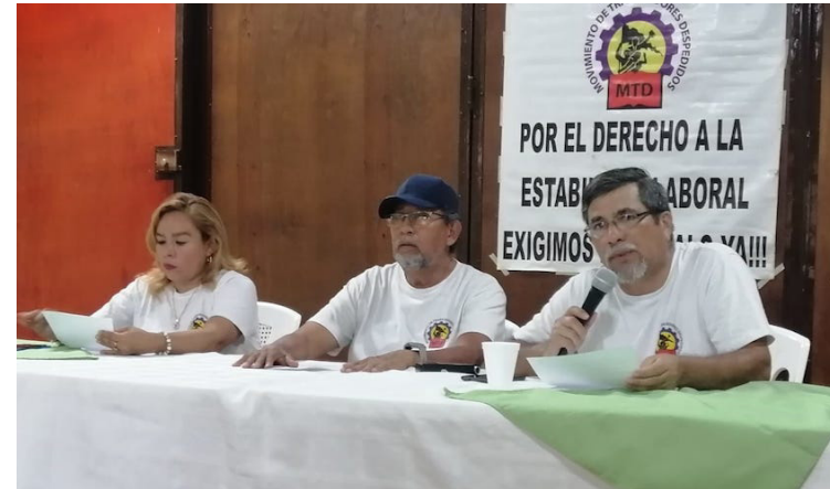
El MTD denuncia que el gobierno aprovechándose del Régimen de Excepción, ha despedido ilegalmente a 146 sindicalistas, 38 suspendidos y 16 encarcelados.

El MTD indicó que Bukele ha eliminado 18 dependencias