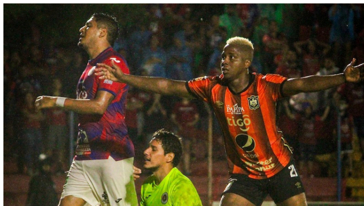
FAS y Águila empataron 2-2 en el estadio Óscar Quiteño en el clásico nacional. Los emplumados siguen líderes y los tigrillos son sextos.