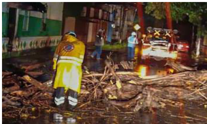
Equipos de primera respuesta removieron escombros dejados por la fuerte lluvia, que afectó diferentes sectores del municipio de San Miguel.

Otro árbol cayó en la Tercera Brigada de Infantería de la Fuerza Armada, en el kilómetro 126 de la carretera Panamericana, San Miguel. Los Equipos Tácticos Operativos de Protección Civil, junto a la Fuerza Armada, removieron un árbol caído que obstaculizaba el paso en la colonia Chaparrastique, San Miguel. Asimismo, se reportó un árbol