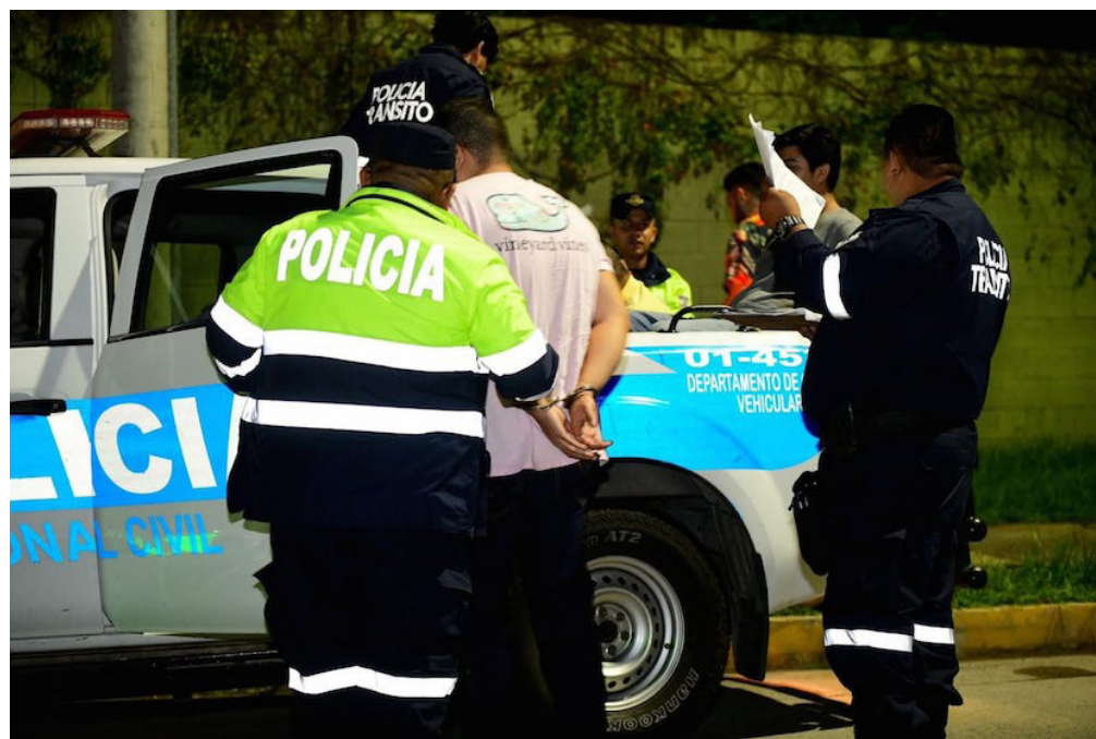
En lo que va del año se han detenido 1,179 personas por conducción peligrosa, que representa 14% más en relación al mismo periodo del año 2022.

El titular del Viceministerio de Transporte (VMT), Nelson Reyes, enfatizó que los controles vehiculares y antidopaje son parte de los mecanismos implementados para prevenir accidentes de tránsito y personas fallecidas por esta causa, en lo que va del año se han detenido 1,175 personas por conducción peligrosa.