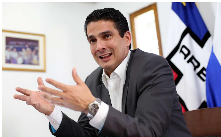
Roberto D'aubuisson es acusado de enriquecimiento ilícito por la Corte Suprema de Justicia. La Sección de Probidad le acusa de no justificar de su patrimonio $862 mil.

pietario de la Asamblea Legislativa, desde el período del 1 de mayo de 2012 al 30 de abril de 2015, y del 1 de mayo de 2015 al 30 de abril de 2021, cuando fue alcalde de Santa Tecla, en dos periodos.