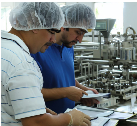
La Asamblea Legislativa aprueba Ley Especial de Precios y Servicios de la Dirección Nacional de Medicamento, en donde se establecen desde $6 mil a $60 mil los montos en pagos adicionales de auditorías.

Por lo que se establecen una serie de montos para el pago de servicios tales como los de “obtención y renovación de registro sanitario de productos farmacéuticos, modificaciones al re-