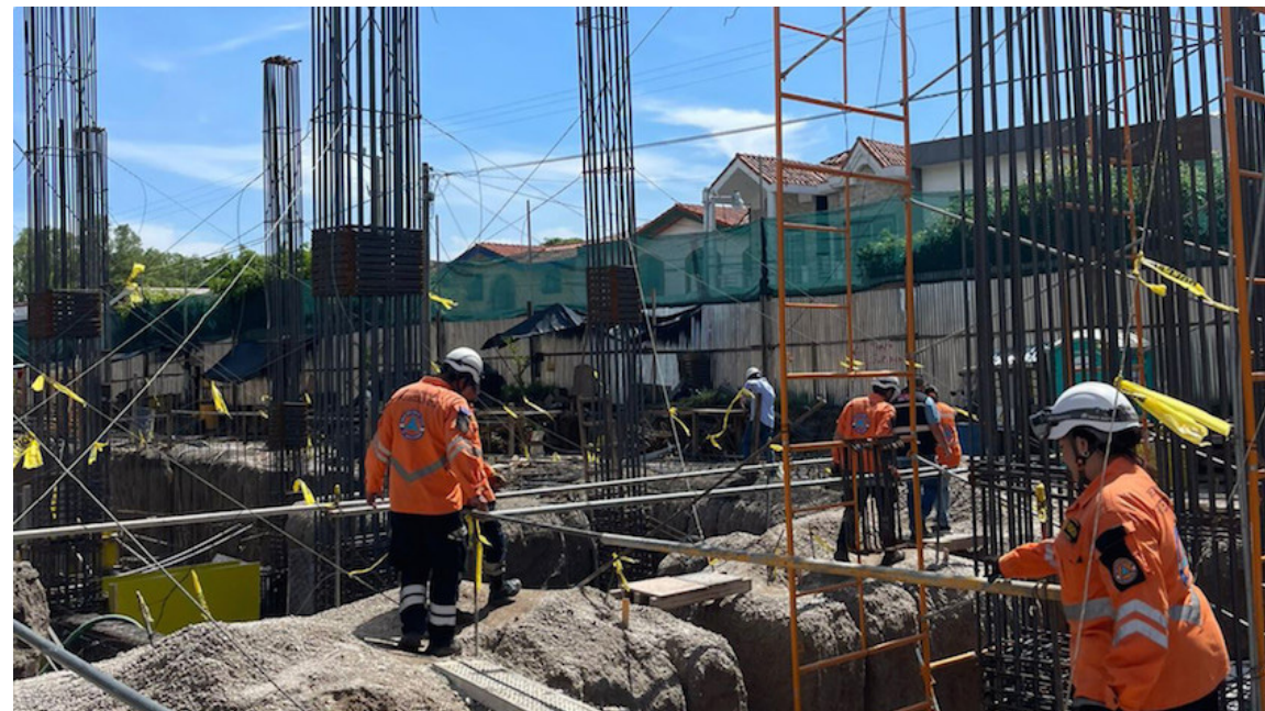
Un derrumbe en una construcción del bulevar Orden de Malta, Santa Elena, Antigua Cuscatlán, deja un fallecido y 12 lesionados.