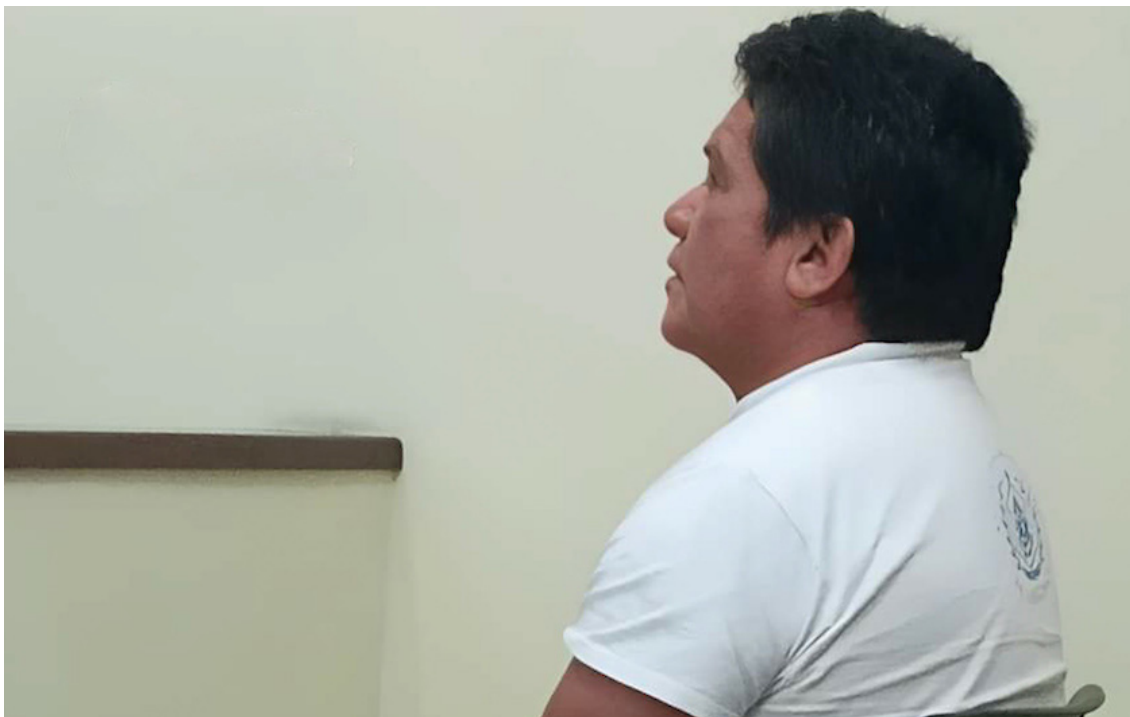
Ex militar es condenado a trabajo de utilidad debido a la tenencia ilegal de arma de fuego.