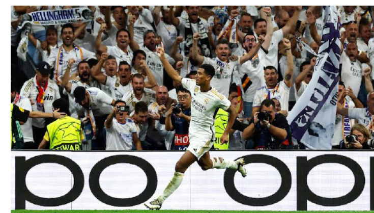
Jude Bellingham celebra el gol de Real Madrid ante el FC Union Berlín en el debut en la Champions League.