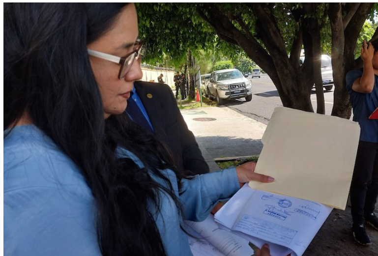
Cristosal espera que la Fiscalía inicie las investigaciones y procedimientos penales contra aquellos que se determinen como autores o cómplices en los delitos relacionados con los hechos señalados.

Luego que estos hechos fueron revelados por El Faro y El Diario de Hoy, los inmuebles se donaron al Estado en previsión de inversión pública en una sujeta planta desalinizadora de agua, la cual actualmente está en pausa. “Las investigaciones fiscales deben determinar si los funcionarios involucrados cometieron encubrimiento o si forma-