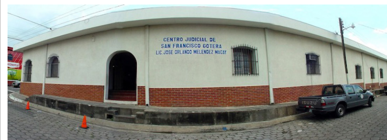
Centro Judicial de San Francisco Gotera.

De acuerdo con el dictamen que dio lugar a la reforma, estos cambios persiguen la adecuación y la reestructuración realizada en dichas jurisdicciones.