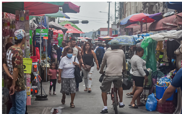
Los altos índices de suicidio, es un tema de agenda que discutirán los Ministros de salud de la regiones de las Américas, que se reunirán con la Organización Panamericana de la Salud (OPS), para discutir sobre prioridades de salud y control de las enfermedades no transmisibles en niños, adolescentes y jóvenes.

Los ministros de salud de las Américas se reunirán con las autoridades de la Organización Panamericana de la Salud (OPS) para discutir sobre las prioridades de salud y buscar acuerdos en la prevención y control de las enfermedades no transmisibles en niños, adolescentes y jóvenes, así como, reducir el suicidio, entre otros temas.