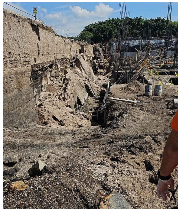
Los primeros indicios señalan que el derrumbe pudo deberse a la inestabilidad en el terreno, a causa de las fuertes lluvias en los últimos días.