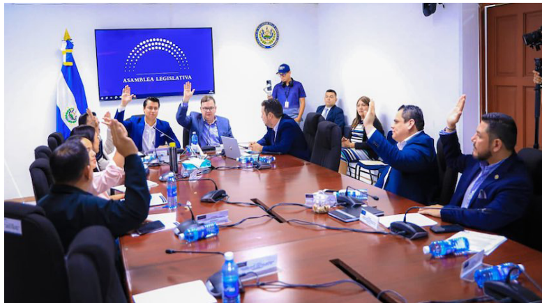
Los parlamentarios emiten dictamen favorable a la iniciativa de Ley Especial de Precios por Servicios de Medicamentos.

Esta ley incluye de manera expresa que todas las instituciones del Estado, incluyendo al Instituto Salvadoreño del Seguro Social (ISSS), estarán exentas del pago de derechos por introducción de medicamentos al país. Así como para instituciones que