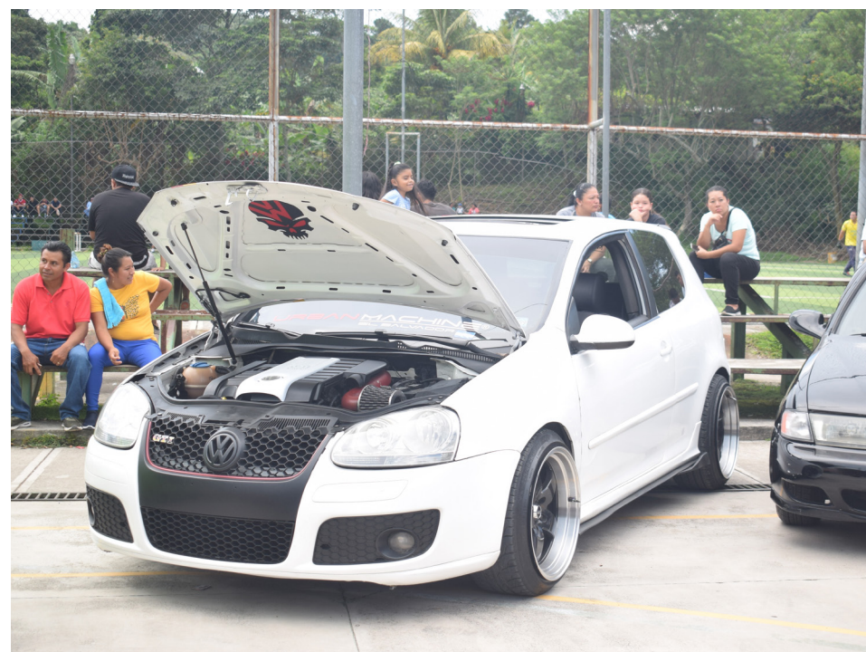
Primer Car show realizado en Complejo Deportivo de Santiago Texcuangos sobre el marco de las fiestas de San Mateo Apóstol.