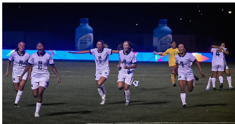
La selección femenina debutará este miércoles en las eliminatorias rumbo a Copa Oro ante Nicaragua.

Hay que recordar que El Salvador se enfrentará a Nicaragua este miércoles a las 8:00 p.m. Luego jugará como local ante Martinica el domingo 24 en el estadio Las Delicias, posterior a ello viajará a Hondu-