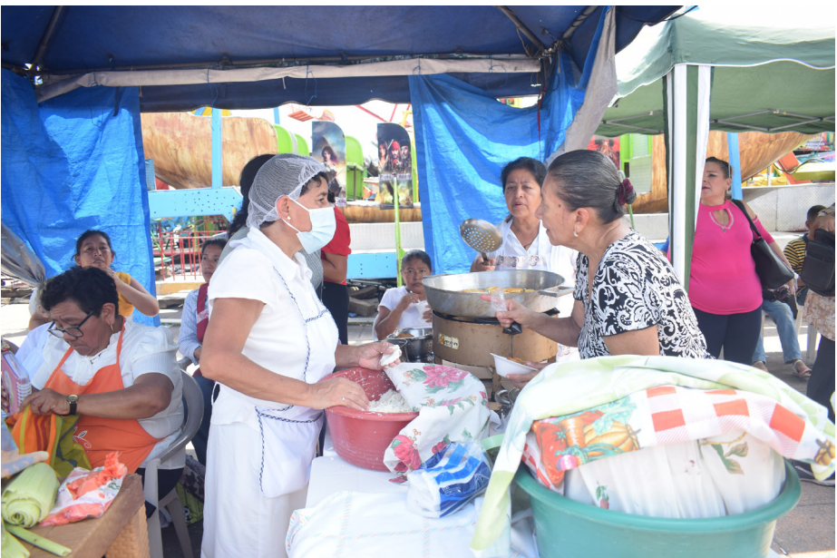
Ventas de platillos típicos derivados del maíz en la plaza pública del Municipio de Santiago Texcuangos.