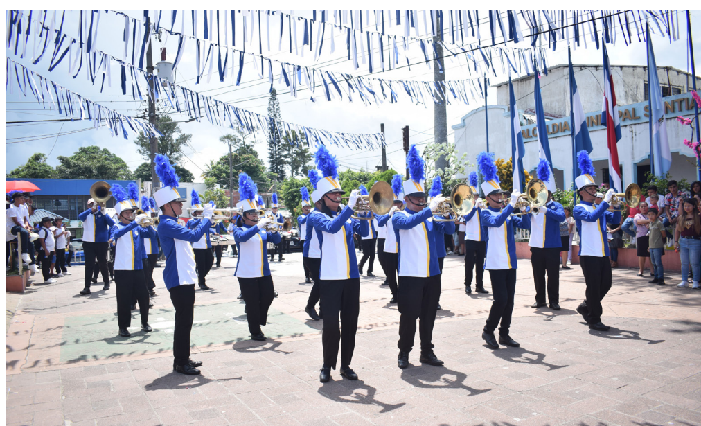
Distintas bandas participan en el tradicional Festival del Maíz que se realiza en marco a las fiestas de San Mateo Apóstol.