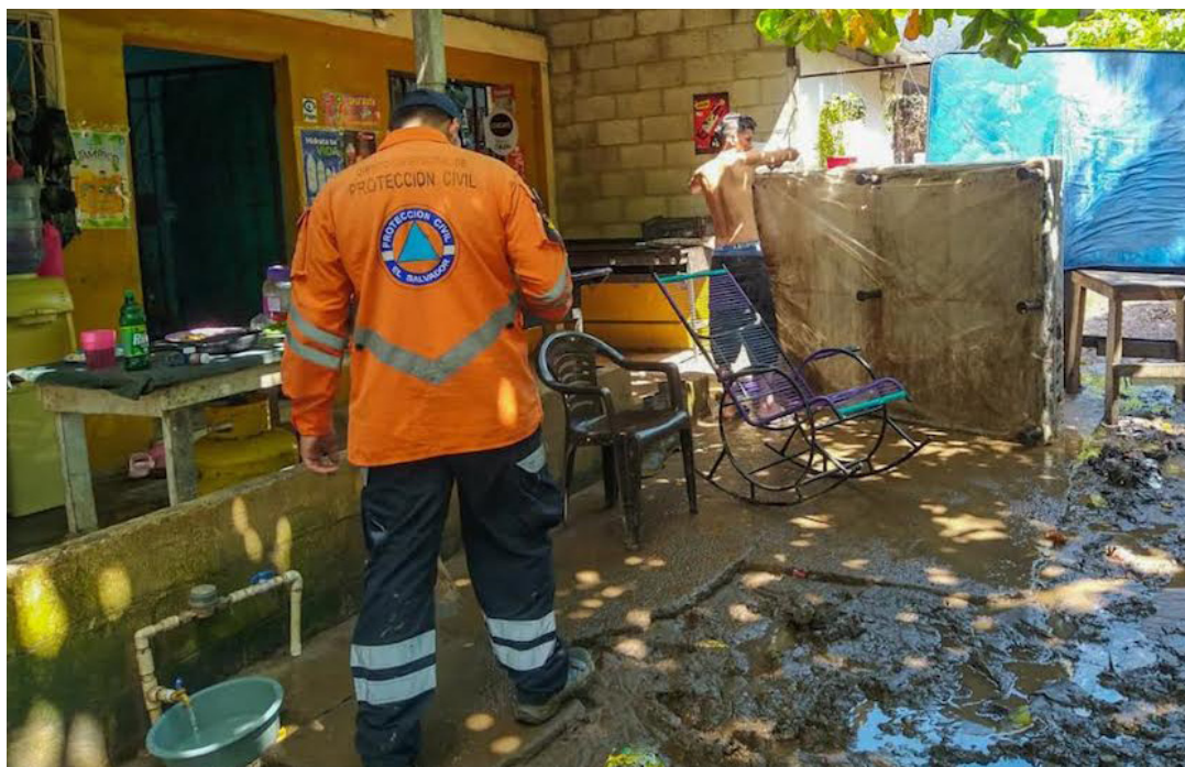
Protección Civil inspecciona las viviendas afectadas por las últimas lluvias, en la comunidad Pequeña Inglaterra, Ciudad Arce, La Libertad.