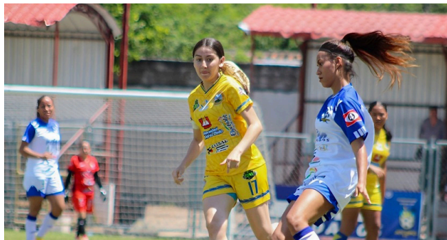
Jocoro golea a Municipal Limeño 6-0 en el segundo partido del Apertura en la Liga Femenina y se convierte en líder.