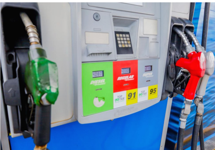
El Diésel tendrá un aumento de $0.12 a escala nacional, este aumento estará vigente desde el 19 de septiembre hasta el 2 de octubre.

La normativa que permitía que los precios se mantuvieran fijos durante varios meses de 2022 no fue prorrogado como ya los parlamentarios lo habían hecho sesiones atrás. La decisión de las autoridades se debió a que el precio del petróleo en los mercados internacionales había bajado lo suficiente, incluso, más de los precios fijados.