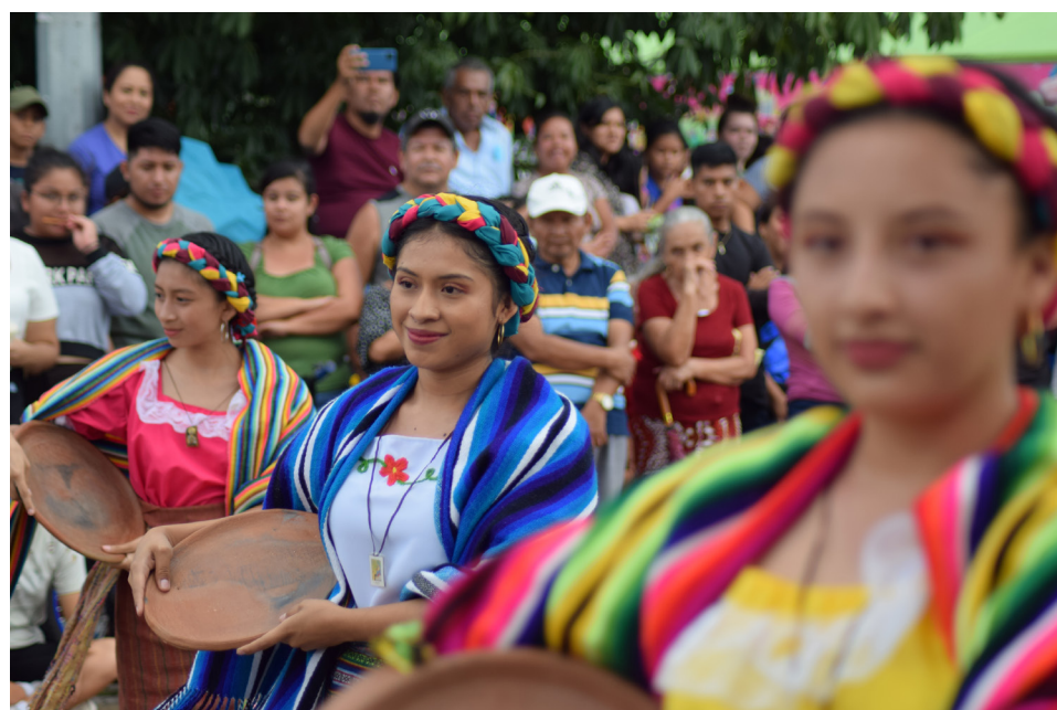
Cinco grupos de danza folclórica conformados por miembros de diferentes comunidades del Municipio de Santiago Texcuangos.

En las calles aledañas del municipio, niños, jóvenes y adultos disfrutaron de una exhibición de autos de diferentes clubs de El Salvador que se realizó en el Complejo Deportivo de Santiago Texcuangos. En el municipio también han llegado los juegos mecánicos.