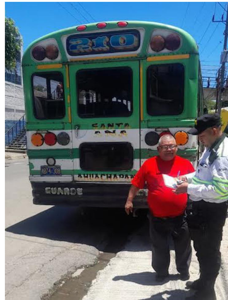
El ministro de Obras Públicas, Romeo Rodríguez, anuncia diversas intervenciones en la obra pública en el país. Y mayores controles de tránsito en prevención de accidentes.