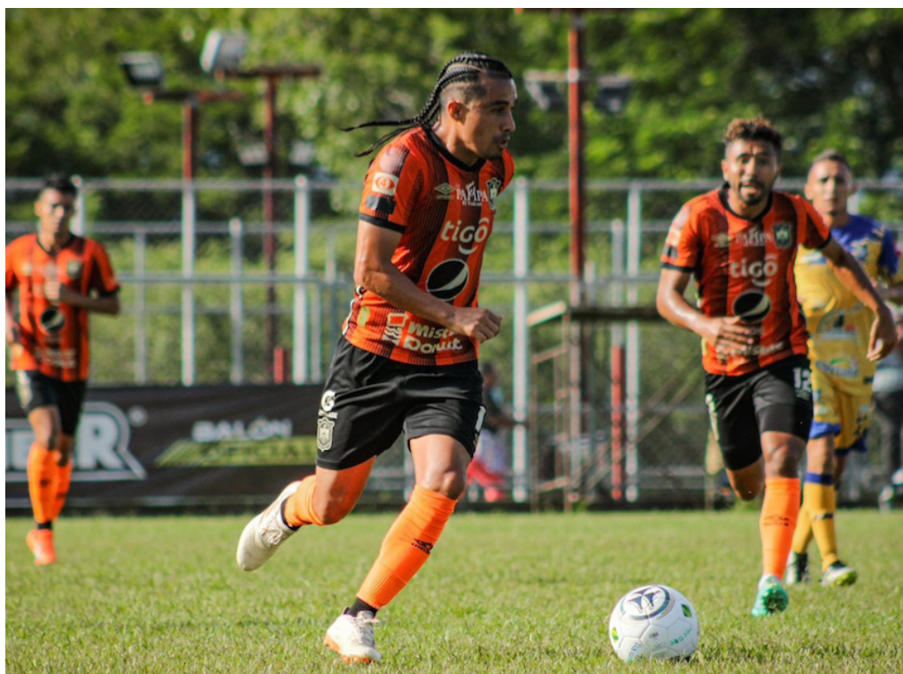
Águila recupera el liderato del Apertura 2023 tras vencer a Jocoro en Tierra de Fuego 0-2.