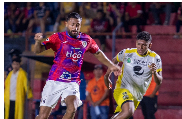
Once Deportivo cae ante FAS, en la casa del cuadro tigrillo, y se aleja 5 puntos de la primera posición de la tabla del Apertura 2023.

En la cuarta casilla de la tabla se encuentra Firpo con 13 puntos, por debajo FAS con 12, el Fuerte, Jocoro y Dragón con 10, Municipal Limeño con 8, Platense con 6, Isidro Metapán con 5 y la situación de Santa Tecla es alarmante porque el equipo colinero no ha podido despertar y se encuentra en el sótano con 1 punto.