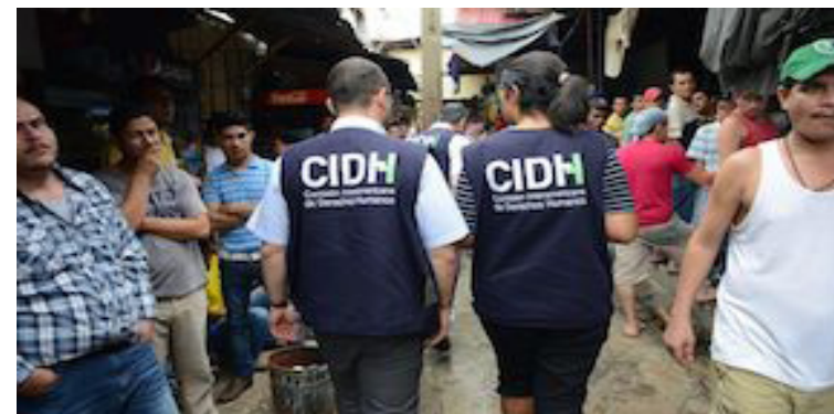
La Comisión Interamericana de Derechos Humanos (CIDH), instó en un comunicado oficial, al Estado de Nicaragua, a cesar la persecución contra la Iglesia Católica.

“Al respecto, la CIDH ha señalado que un espacio cívico abierto, libre y plural constituye una condición esencial para garantizar que las personas tengan la libertad de profesar, manifestar y practicar su