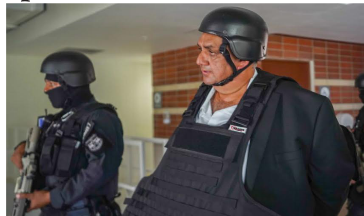
El ex diputado de Alianza Republicana Nacionalista (ARENA), Alberto Romero, es procesado por los supuestos delitos de enriquecimiento ilícito y lavado de dinero y de activos.

La Fiscalía General de la República sostiene que en sus investigaciones ha detectado presuntamente más de una veintena de inconsistencias en el patrimonio del diputado: entre los años 2011 y 2022, -según la institución- el diputado arenero obtuvo ingresos mayores a $1 millón 162.388.00