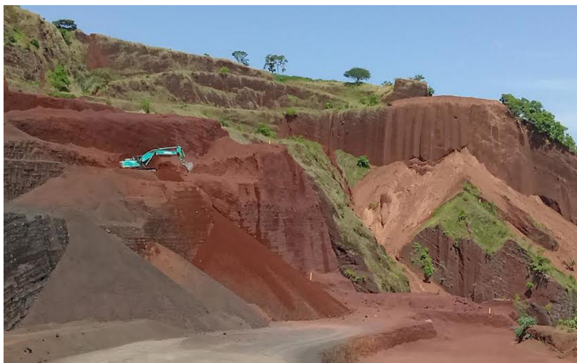
En el país no se está financiando la demanda social, se está destruyendo el medio ambiente, pese a la urgencia de los daños del cambio climático.

“No tenemos conocimiento que se estén haciendo estas acciones, porque esto pasa con que el país tenga una Ley de Cambio Climático, lo que se tienen son NDC (Contribución Determinada a Nivel Nacional)