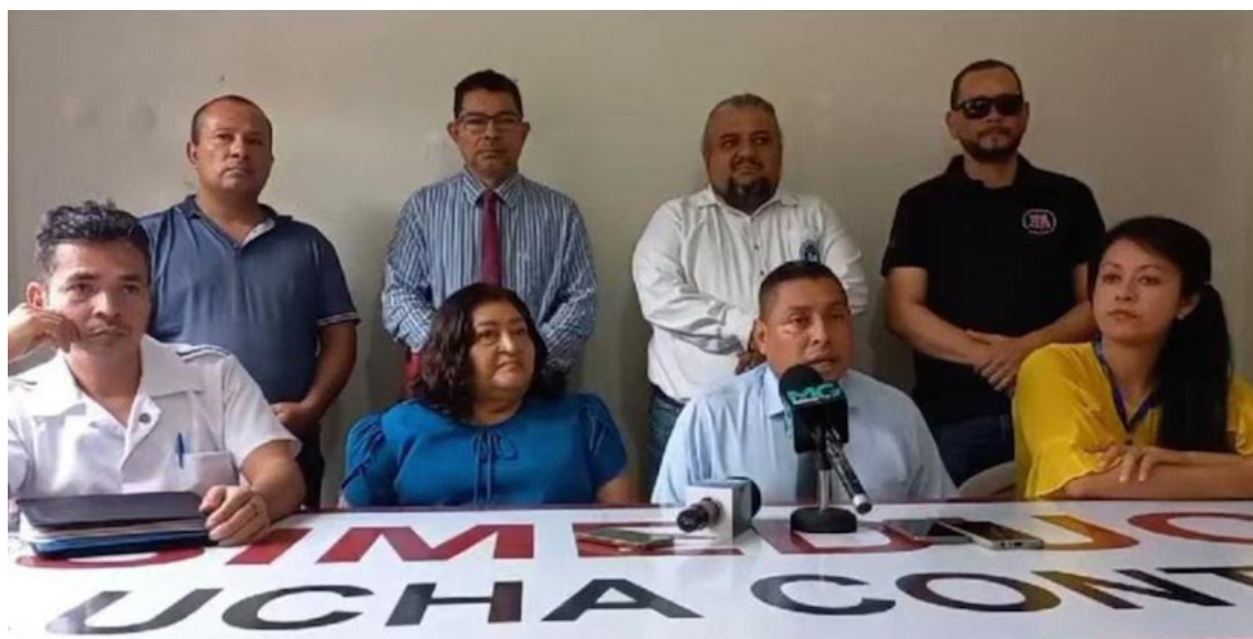
Sindicatos y movimientos sociales piden la restitución de trabajadores de Salud suspendidos, luego de reclamar el derecho al pago de nocturnidad y vacaciones retrasadas.

“La razón de ser de las organizaciones y como dirigentes sindicales es denunciar y exigir