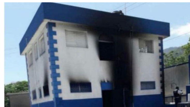
Este acto criminal tuvo lugar a plena luz del día y puso de relieve la creciente violencia de los delincuentes que operan con impunidad en la zona. | Foto: haitinews2000

Sin embargo, el incendio en la instalación policial puso de relieve la necesidad urgente de adoptar medidas rápidas y concertadas para contrarrestar la creciente influencia de los gru-