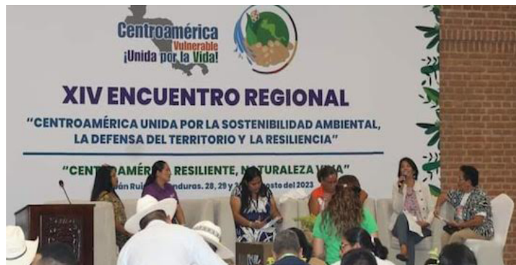
En el cierre del XIV Encuentro Regional: Centroamérica Unida por la Sostenibilidad Ambiental, la Defensa del Territorio y la Resiliencia”, entre otros temas, se concluyó que es necesario buscar una alternativa de justicia ecológica y climática en la región.