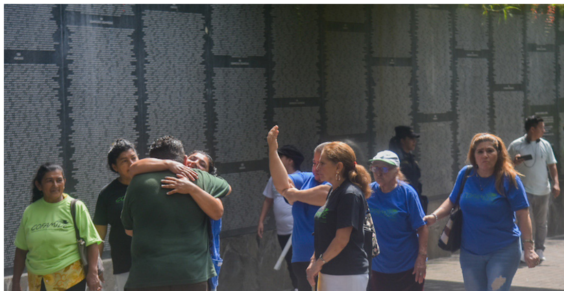
Familiares de víctimas de la desaparición forzada durante el conflicto armado de El Salvador piden al Estado que abra los archivos de la Fuerza Armada para esclarecer parte de esas desapariciones forzadas.

La Comisión de la Verdad cuando dio su informe el 15 de marzo de 1993 dijo que para superar la impunidad debían de investigarse los delitos que se cometieron durante el conflicto, aprovechándose de esa situa-