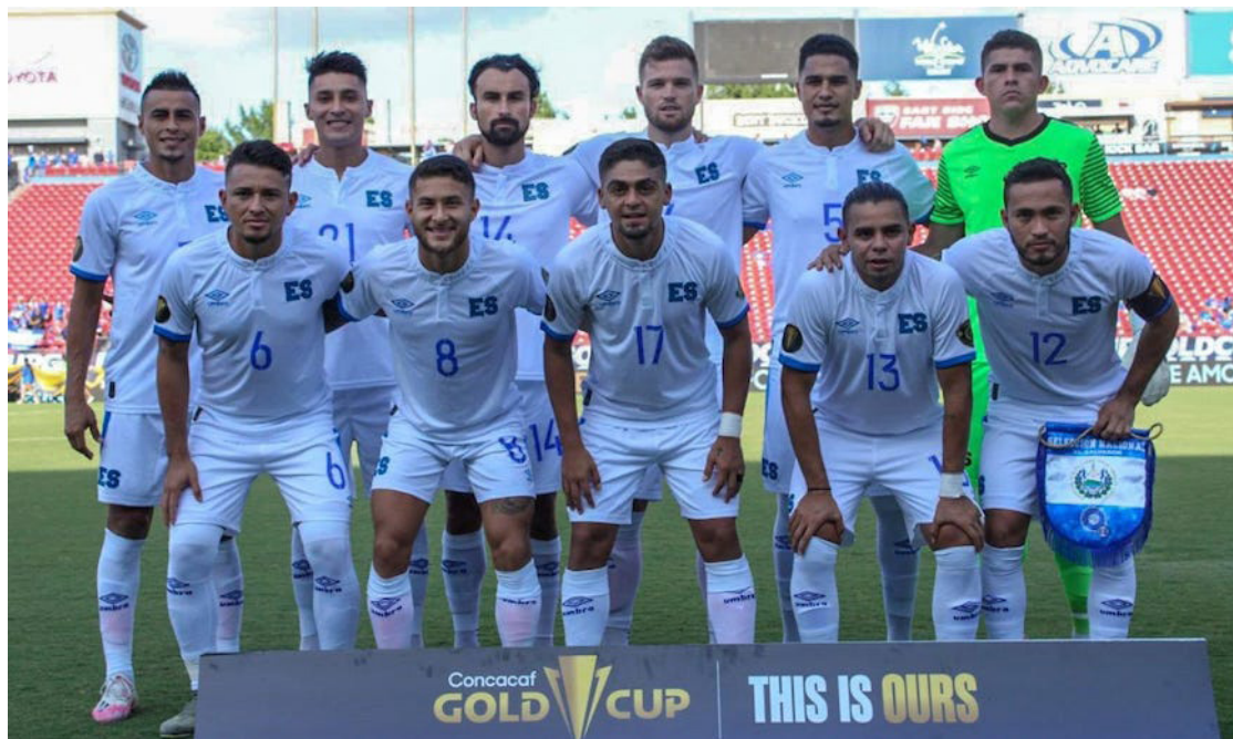
La FESFUT presenta la nómina oficial de la Selecta con nuevas incorporaciones previo el inicio de la Liga de Naciones de CONCACAF.

En medio de la polémica la Federación Salvadoreña de Fútbol (FESFUT) presentó la convocatoria oficial de la Selecta para la fase de grupos de la Liga de Naciones de CONCACAF, en la cual el combinado nacional debutará el 7 de septiembre contra Guatemala.