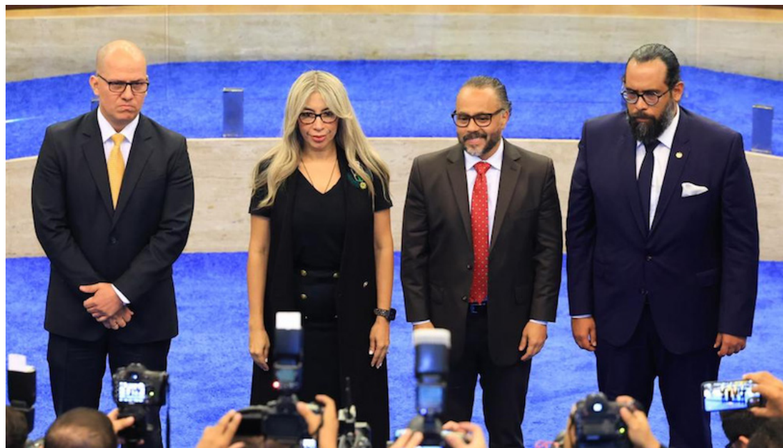
Estos son los 3 funcionarios que estarán en la Corte de Cuentas de la República desde el 28 de agosto 2023 hasta el 27 de agosto de 2026.