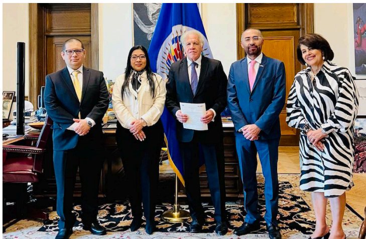
Magistrados del TSE solicitan a la OEA el envío de una misión de observadores, para las votaciones de 2024.

Además, fue presentada la guía para inscripción de candidaturas en las elecciones de presidente y vicepresidente, diputaciones a la Asamblea Legislativa, al Parlamento Centroamericano (PARLACEN) e integrantes de concejos municipales, que iniciará el próximo 7 de septiembre de 2023.