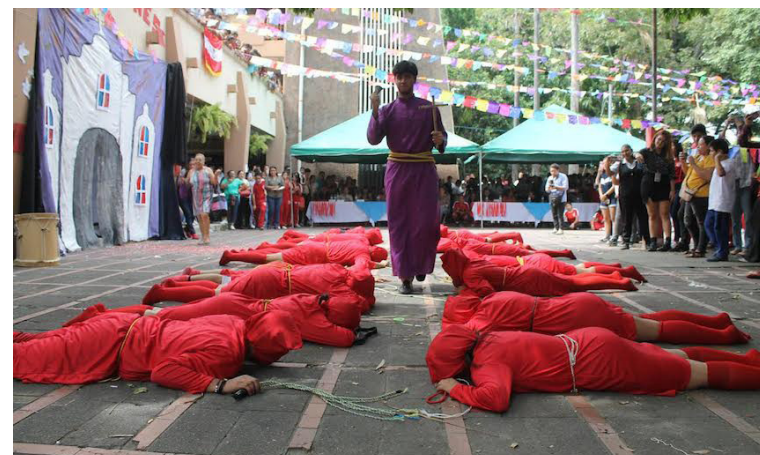
La sección 2-1 de Turismo, fue parte del equipo que representó la tradición de los Talcigüines, originaria del municipio de Texistepeque, en el departamento de San Ana.