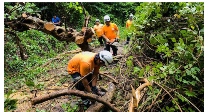
Protección Civil removió un árbol que cayó y dejó incomunicado al cantón Las Flores, en Caluco, Sonsonate, debido a las lluvias de las últimas horas.

Asimismo, el Equipo Táctico Operativo destacado en la zona occidental del país, llevaron a cabo un monitoreo por lluvias y remoción de ramas caídas, en la colonia San Genaro, calle que conduce a Nahuizalco, Sonsonate.