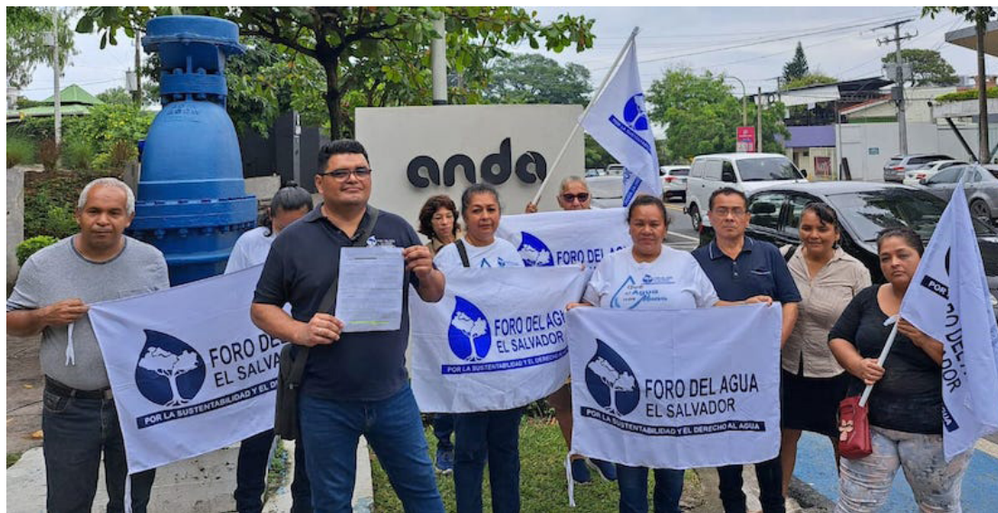
Representantes del Foro del Agua piden a las autoridades de ANDA, información sobre los procesos de purificación que aplicarán en la Planta Potabilizadora de Ilopango.

Sostuvo que en el caso del Boro tiene 10 veces más de lo permitido por la norma técnica de la potabilización del agua, de Arsénico es mil veces más. Estos metales tienen implica-