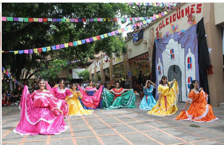
Este festival es una tradición”, en el Bachillerato de Servicios Turísticos, en el cual los estudiantes de las distintas secciones dan a conocer su creatividad y entusiasmo en relación a la cultura salvadoreña.