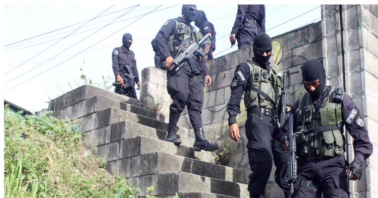
El Ministerio de Seguridad obtiene un refuerzo presupuestario para la alimentación de 27 mil agentes entre agosto y septiembre de 2023.

Durante la plenaria, los legisladores también votaron para reforzar el presupuesto del Ministerio de Agricultura y Ganadería para garantizar la seguridad alimentaria y nutricional de la población, así como para entregar suministros agropecuarios y alimentos a los productores salvadoreños. La enmienda a la Ley de Presupuesto 2023 permitirá a Hacienda transferir $2 millones al MAG. Con estos recursos, el MAG pretende continuar apoyando a los productores, principalmente a los que resultaron afectados por la tormenta tropical Julia, en octubre de 2022.