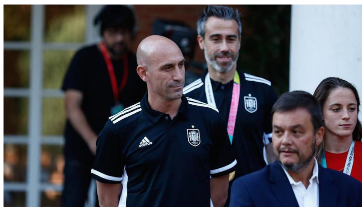
Luis Rubiales, presidente de la Real Federación Española de Fútbol (RFEF), renunciará por polémica con jugadora en la final del Mundial.

El contexto del caso gira en torno al incidente que ocurrió en la final de la Copa del Mundo en el Accor Stadium en Australia, en el cual Rubiales, en el momento de