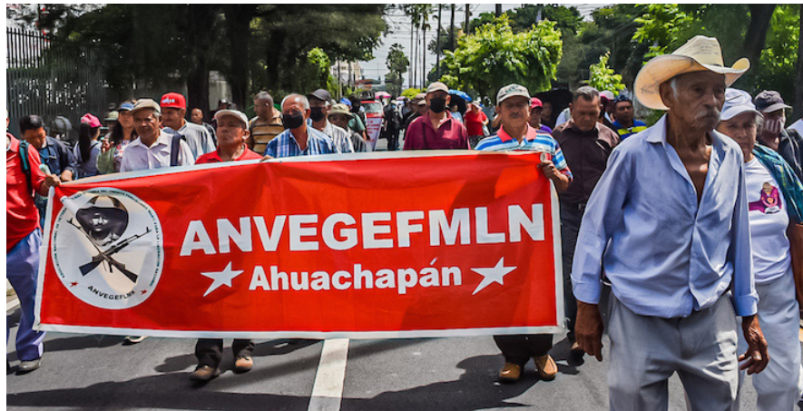
Veteranos y ex combatientes marchan a Casa Presidencial para pedir un aumento en su presupuesto de 2024.

Veteranos y excombatientes del conflicto armado marcharon este martes hasta Casa Presidencial para pedirle al presidente Nayib Bukele un aumento en el presupuesto de los veteranos a fin de que se cumpla con sus beneficios.