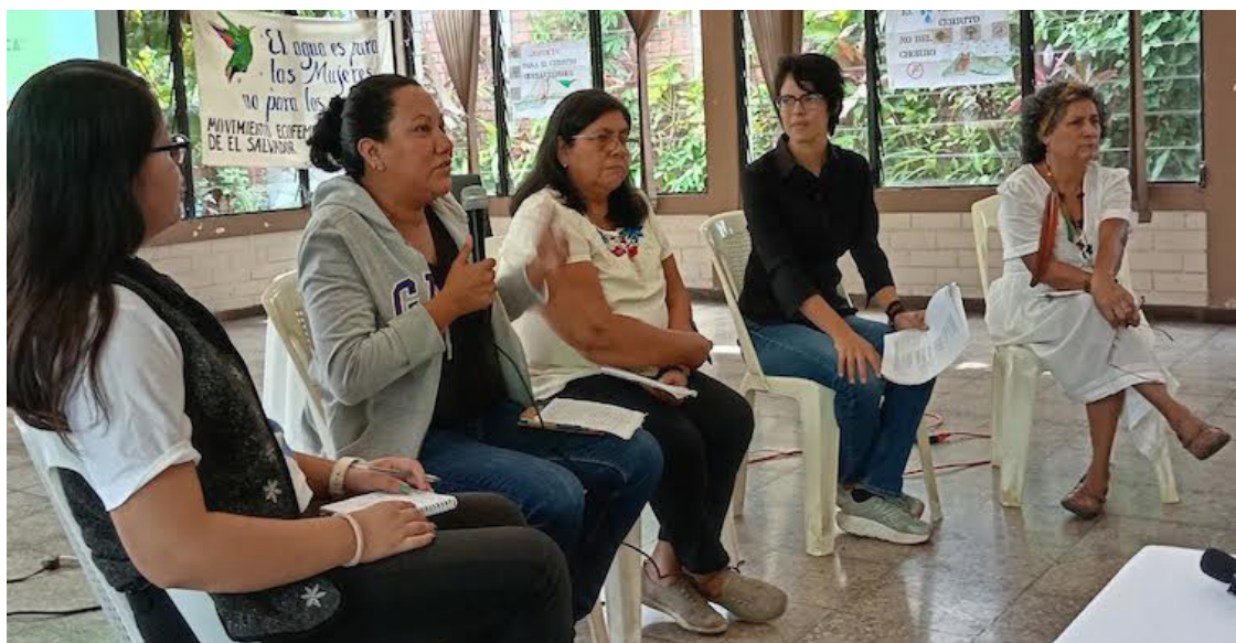
Mujeres lideresas y organizadas hablan del papel comunitario y estratégico en la defensa del medio ambiente en el territorio nacional.