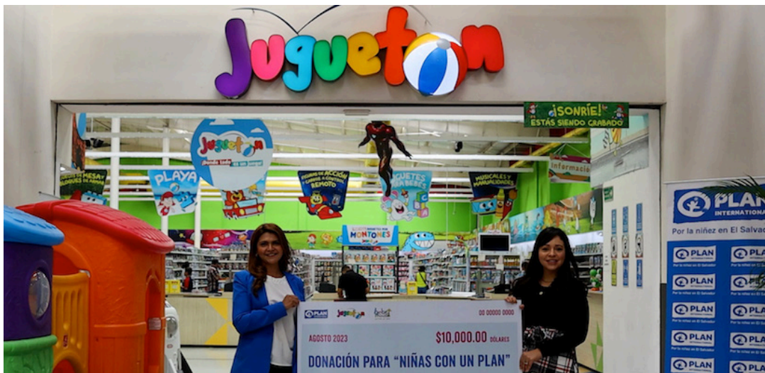
Plan Internacional recibe un donativo de la empresa Juguetón, para apoyar la estrategia “Niñas con un Plan”.

La iniciativa “Niñas con un plan” tiene el propósito de impulsar el ciclo de vida de las niñas y adolescentes, sobre todo de aquellas en situación de vulnerabilidad, muchas de ellas no son valoradas por sus familias y dentro del hogar, tiene sobrecarga de quehaceres domésticos; no tienen acceso a la escuela y a una educación de calidad.