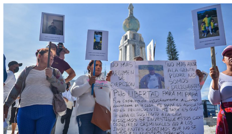
Familiares de personas detenidas injustamente piden a las autoridades que sus presos sean liberados.