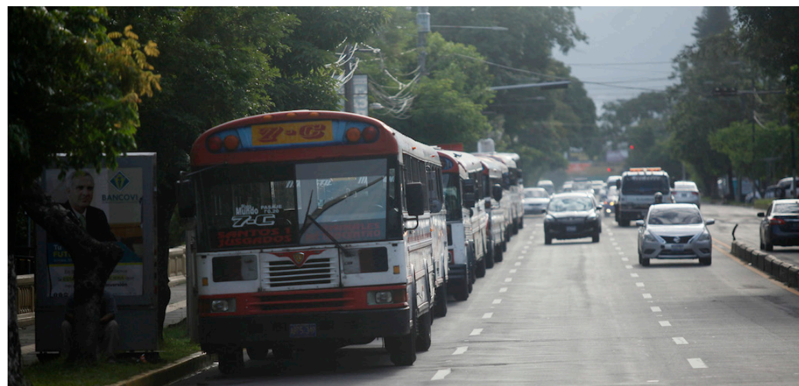
Empresarios del transporte colectivo proponen al gobierno asignar un precio tope al Diésel que utilizan las unidades, o les deje cobrar una tarifa técnica, que implica un aumento al pasaje.