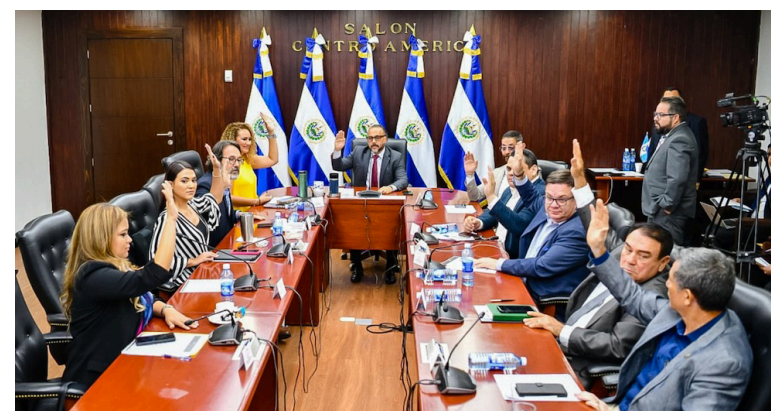
La Comisión Política emite dictamen favorable para que, en la plenaria de este miércoles, los grupos parlamentarios propongan las ternas a presidente y magistrados del ente contralor.

En elecciones de segundo grado que anteriormente la Asamblea Legislativa ha efectuado, es la decisión de Nuevas Ideas que predomina, tomando en cuenta que tienen mayoría absoluta en el Congreso, por lo cual, estas elecciones de funcionarios pasan por un solo partido político; el resto (aliados) solo acompañan con la votación sin tener incidencia. Mientras que las propuestas de la oposición no