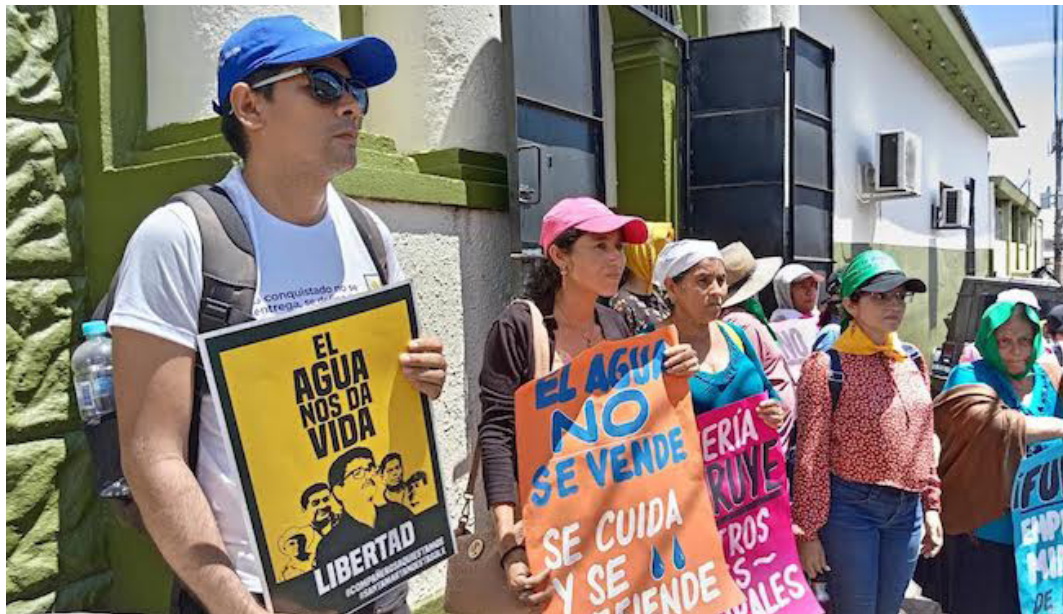
El Juzgado de Instrucción de Sensuntepeque realizará este miércoles 23 de agosto, la audiencia especial de revisión de medidas para los líderes comunitarios de Santa Marta y ADES.

“El Juzgado de Instrucción de Sensuntepeque realizará este miércoles 23 de agosto, la audiencia especial de revisión de medidas